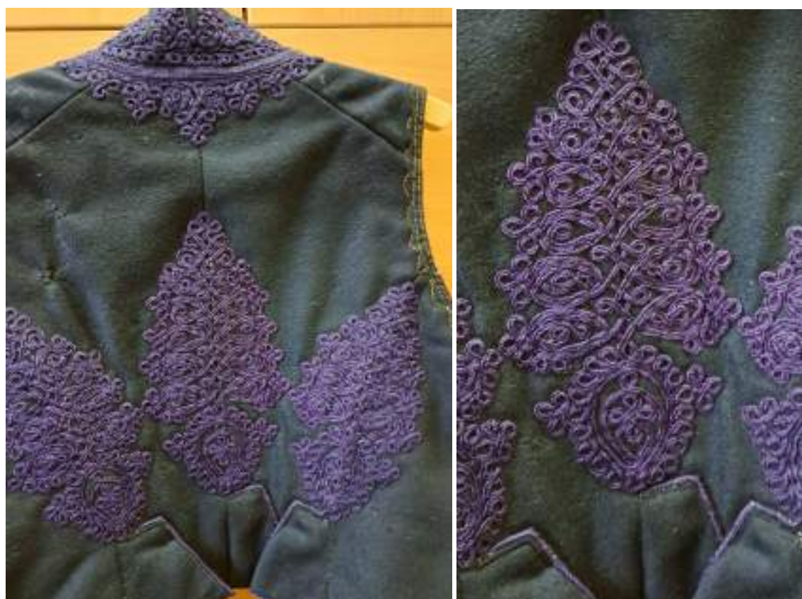
Obr. 78 Detail zdobení mužské vesty – zadní díl, Jalubí