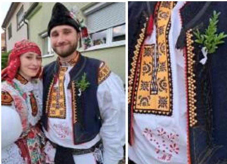
Obr. 60 Slavnostní kroj hodové mládeže. Babice, 2025