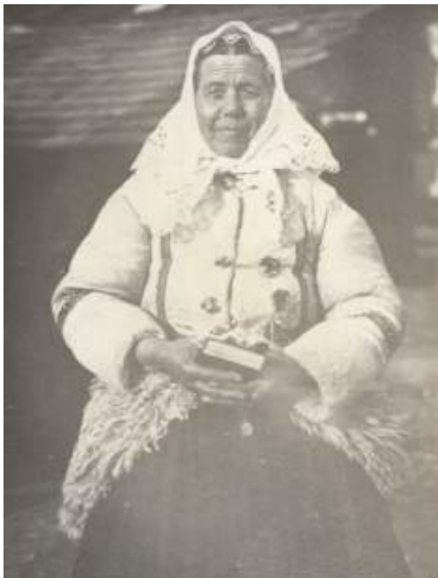
Obr. 5 Žena v beláku, Piešťany, 1. tretina 20. storočia

Zimnou odevnou súčiastkou vydatých žien v Piešťanoch bol aj kožuch z bielej kožušiny – belák . Žene siahal približne po kolena, horná časť a rukávy boli úzke, od pásu nadol sa mierne rozširoval a mal vysoké manžety. Ženy si predné diely vypínali k pásu na kožené gombíky, aby im neprekážali pri chôdzi. Kožuch bol zdobený našívanými farebnými kúskami kože do tvaru kvetov, lístkov a pášikov na chrbtovom diele, predných dieloch a popri manžetách. Na chrbte bol zdobený aj strapcami z pášikov farebnej kože. Nášivky mohli byť doplnené vyšívaním farebnými vlnenými nit'ami.