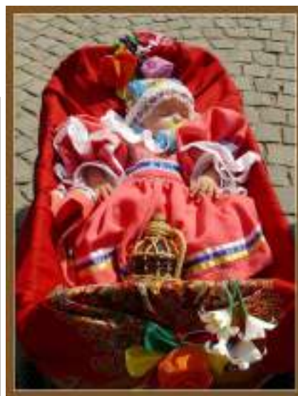
Obr. 197 Zleva: Kojenecká čepička, tzv. portovica, zdobená stužkami a portami. Vlčnov, 1900. Fond Slovákého muzea v Uh. Hradišti (foto: Ladislav Chvalkovský)