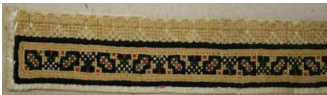
Obr. 165 Výšivka z kadrlí ženských rukávů s motivem „na dubový list“. Vyšito bílým, zlatožlutým, červeným, zeleným, modrým a černým hedvábím. Velikost výšivky je 710 x 30mm. Blatnice, 1870 (fond Slovákého muzea v Uh. Hradišti)