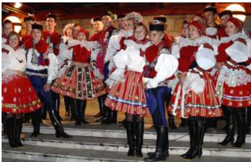
Obr. 195 Současná podoba slavnostního a svátečního kroje. Vlčnov, 2009

Vlčnov byl obcí výrazně zemědělskou, a zdejší kroj tak odpovídal nárokům na pohodlí a ochranu těla při polních pracích. V souvislosti s hledáním pracovních příležitostí v průmyslu začaly kroj odkládat nejprve rodiny pracující v průmyslu a po roce 1945, se zánikem soukromého zemědělského hospodaření, ustávalo každodenní oblékání kroje zcela. Kroj se stal oblečením příležitostným k světským i církevním svátkům a slavnostem.