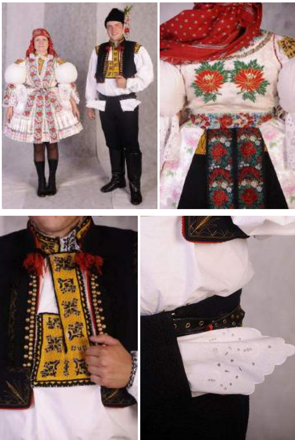
Obr. 71 Slavnostní kroj hodové mládeže. Současná podoba kroje. Kněžpole, 2009

Mužský slavnostní kroj je v této lokalitě stejný. Chlapci nosí do soukenné korduly dudovou košili s vyšíváním na výřez. Z jednoduchých prostých motivů se vyvinuly velké složité vzory od kroměřížských růží s baluzí, křížů až k velkým kyticím , čímž se zvětšila i šířka vyšivkových pruhů. Soukenné kalhoty zdobí cifrování a několikrát protažený řemen s bílým nebo červeně vyšitým plátěným kapesníčkem. V tomto krojovém typu nosí chlapci beranice s voničkou a navázanou stuhou.