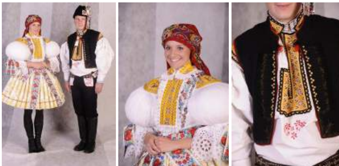
Obr. 65 Slavnostní kroj hodové mládeže. Traplice, 2009

Mladá traplická chasa se obléká do kroje hlavně na hody. Každý návštěvník této slavnosti se rád podívá na dobře oblečené chlapce a děvčata. Místní vyšivačky Františka Fusková, Hedvika Hanáková a Vlasta Hubáčková, obohatily kroj o nové ztvárnění výšivkové sestavy. Nejčastějšími vzory jsou motivy na kříže s fialovými výplněmi a z obou stran s vyšitou fialovou formičkou.