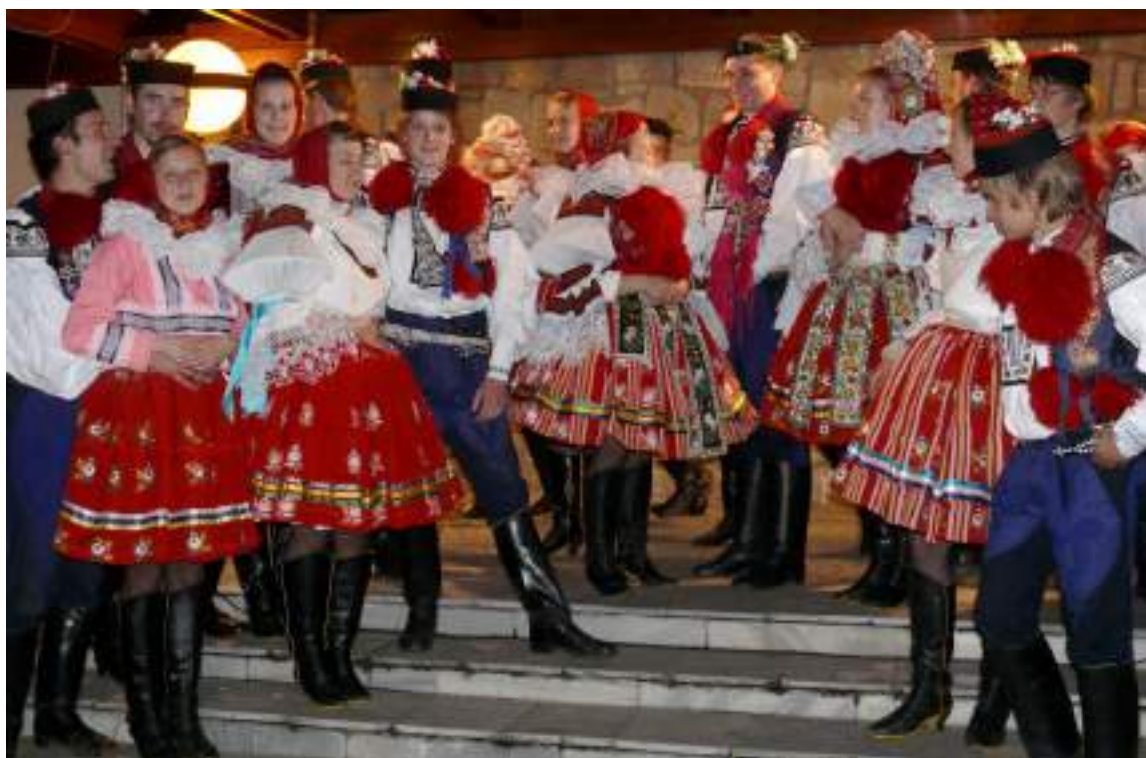
Obr. 29 Současná podoba vlčnovského kroje, sváteční, slavnostní a obřadní varianta (J. Tymonek, 2009)