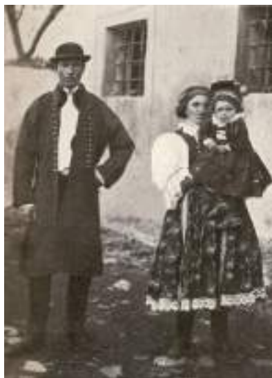
Obr. 32 Rodina ve slavnostních krojích, muž v slavnostním kabátě-mentýku. Ostrožsko, Blatnice pod Sv. Antonínkem, 1892.