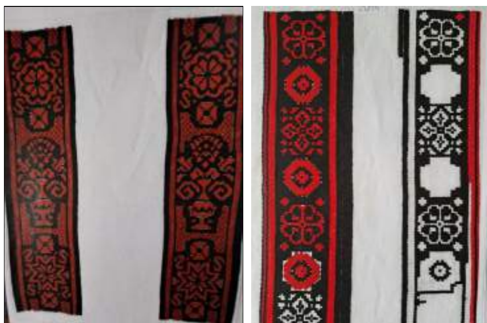
Obr. 115 Ukázka mužského výřezového vyšívání – detail nárameníků. Kunovicko, 2025

Barevnost se od poloviny 19. století proměňovala od rezné po sytě červenou, stejně jako u ženského vyšívání. Josef Klvaňa uvádí, že tyto košile, které se nosí do kostela bez obleku, tedy jen s kordulou, nesmějí být nikdy prány a jsou vždy z nové látky. Pokud byly ušpiněny, muselo se bohaté vyšívání odpárat a všivalo se do nového plátna.