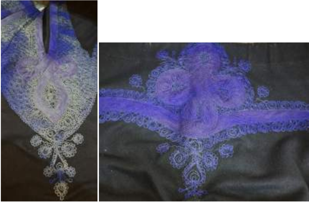
Obr. 221 Šňůrování na mužských nohavicích z Vlčnova (stehno, zadní sedlo). Fond Slovákého muzea v Uh. Hradišti

Soukenná kordula se stříhově nezměnila, výrazně se však vyvinula výzdoba v podobě krejčovské výšivky a cifrování. Nejstarší ženské kordulky z hedvábných látek si šily ženy a dívky samy, mužské korduly byly vždy dílem krojových krejčích. Původní jednoduché zdobení na límečku se vzorem jatelinek se rozrostlo o výrazné červené vyšití. Zřejmě nejstarší mužská kordula je uložena ve sbírkách Slovákého muzea v Uherském Hradišti a lze ji datovat do doby kolem roku 1860. Motiv na levé straně korduly je šňůvaný modře. Červeně je zvýrazněno pouze šňůrování límečku. Na zádech ještě nejsou patrné velké pány, ale také zde je nad rozparky pouze motiv trojlístku. Tato vesta je velmi příbuznou se současnou vestou z Kunovic, kde nedošlo k rozvinutí výzdoby. Malé kytky jsou červeno-modré a na pravé přednici je našita řada obyčejných plechových knoflíků. Korduly kolem roku 1890 už měly červeně vyšitý límeček, levá přednice však byla stále ještě modře šňůvaná s podložením menšího kousku červeného sukna. Na zádech měla tři modře šňůvané pány.