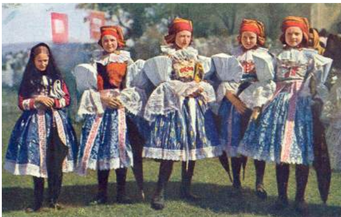
Obr. 143 Slavnostní ženský kroj Ostrožska – volně lomené rukávce žen bez vycpávek s úvazy „na naušnice konce hore“. Ostrožsko, kolem roku 1915

Od druhé poloviny 20. století se rozšířily kadrlé krepinkové, zhotovované z bílých textilních galanterních krepinek, spojovaných bavlněnou nití do pruhů prokládaných krajkou. Rukávce nabývaly na velikosti a vytvořily dnes nadměrně objemný a nepraktický tvar.