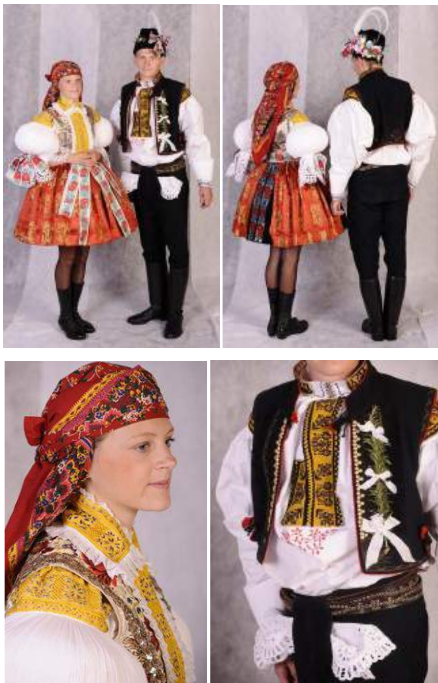
Obr. 61 Slavnostní kroj hodové mládeže. Huštěnovice, 2009

Slavnostní kroj chlapců má obvyklou sestavu jako jinde na Staroměstsku. Zajímavé je označení stárka o hodech, který má na tmavé vestě připnutou zdobnou voničku, beranici má ozdobenou kromě voničky s navázanou stuhou a kosírky i zeleným věnečkem s bílými květy. Zajímavé jsou vzory na výřezové výšivce do stylizovaných kytic a haluzí , do věnečků , kombinované s ostrožkami . Starší muži chodí v lajblech a sámkových košilích s červeně vyšitými přednicemi. Motiv provedený plochým stehem tvoří květinový ornament. Malí chlapci -školáci oblékají bílé plátěné traslavice, dudovou košili s vyšíváním na výřez, na ni nosí tmavou kordulu. Nejzdobnější je přední modrotisková zástěra, mnohdy s barevnou vlnou vyšitými vzory a barevnou strojově vyšívanou pentlí v pase.