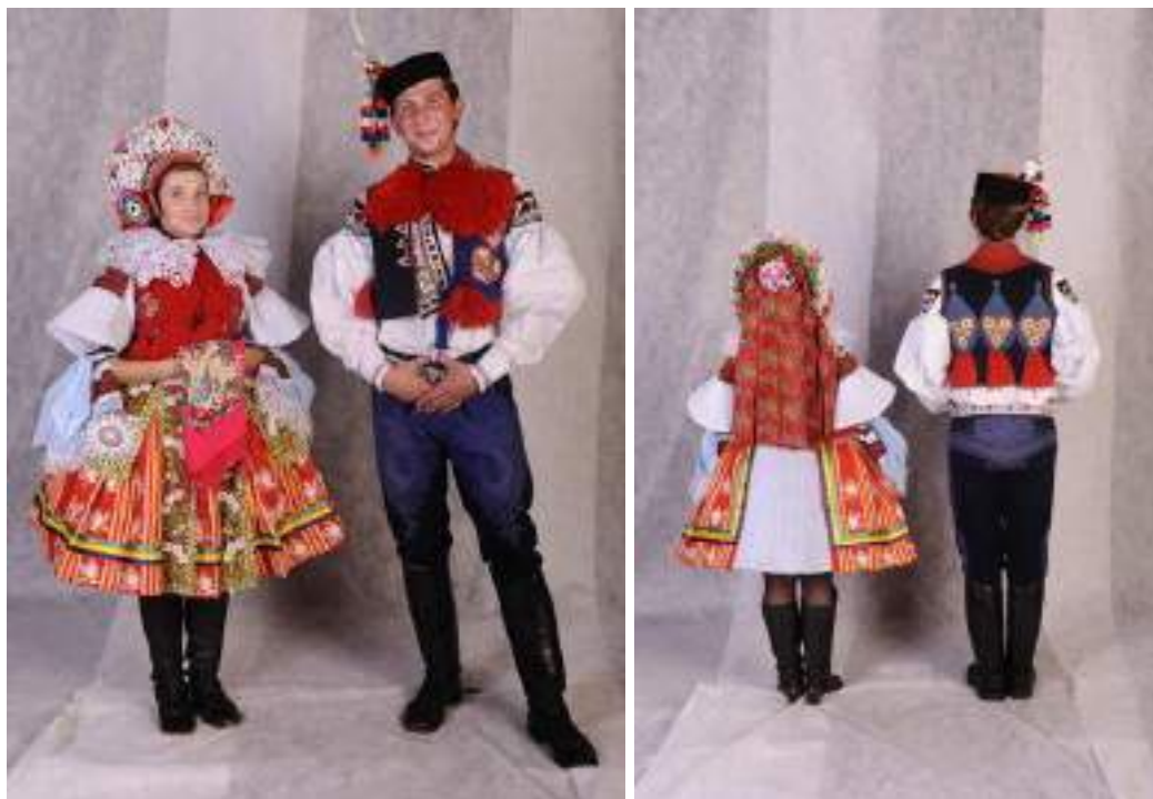
Obr. 226 Současná podoba vlčnovského slavnostního a obřadního kroje. Vlčnov, 2009