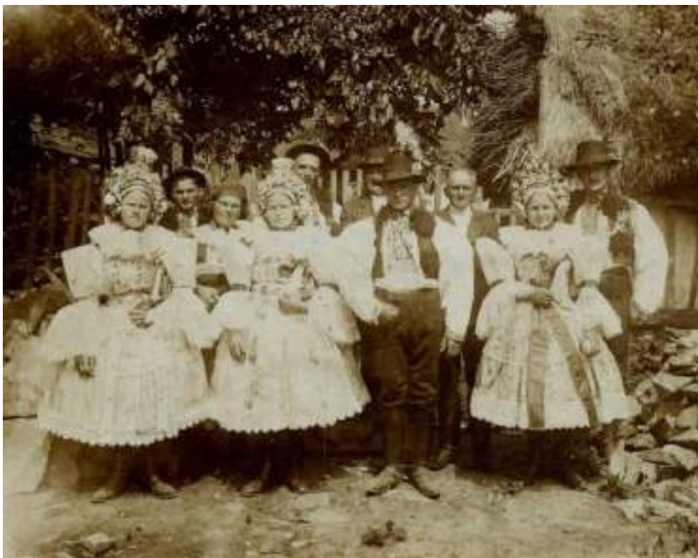
Obr. 142 Obřadní kroj Ostrožska – volně lomené rukávce žen bez vycpávek s obřadním pentlení dívčích hlav. Blatnice pod Sv. Ant., počátek 20. století