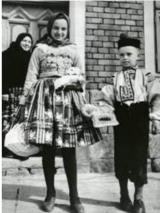
Obr. 201 Dětský kroj z Vlčnova, chlapec v košili, kalhotech z mašestru a kloboučku, děvče v jupce, štofce a šátku na babušu. Vlčnov, 1945-1946

K prvnímu svatému přijímání oblékají děvčátka poprvé obřadní kroj, to jsou rukávce, kordula, bílý zadní fěrtoch a bílý přední fěrtušek. Nejstarší obřadní fěrtušky byly mušelínové, s jemným vytkávaným nebo i tištěným vzorem, později polobrokáty. Na hlavě měly družičky věneček se dvěma copy z bílých konvalínek a poupátek růží, na nohou bílé punčochy a šněrovací boty. Starší děvčata nosila k obřadním příležitostem malý věneček s copy až do čtrnácti let, kdy vyšla ze školy a začlenila se mezi dívky, které brzy začaly chodit k muzice, pak mohly nosit velký obřadní věnec. Větší dívky nosily místo bílého mušelínového fěrtušku vlněné štófové sukně, na nohy obouvaly čížmy.