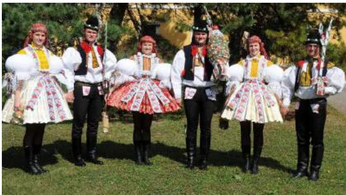
Obr. 66 Slavnostní kroj hodové mládeže. Současná podoba kroje. Staré Město, 2015

V krojovém okrsku staroměstsko-jarošovském je město Staré Město nejtradičnější, v oblékání krojů. Velkou úlohu tu sehrály v první polovině 20. století různé kulturně osvětové spolky, které udávaly ráz kulturnímu a společenskému životu a byly nositeli tradičních folklorních aktivit. Od roku 1956 to byla zásluha především národopisného souboru Dolina. Kroj chlapců a mladých mužů ve Starém Městě podobně jako v Jarošově a v Mařaticích je zdobný a pestrý hlavně díky vestičce-korduli. Je šitá z tmavého sukna a vyšívána jasnou červenou vlnou kolem límce a kapes. Na zádech nad třemi šúsky tvoří výšivka tři červené tulipány. Ze stejného materiálu jsou i kalhoty-nohavice, které jsou tmavě šňurované a s vyšívaným kapesníčkem vloženým v průstříhu kalhot. Kalhoty drží pásek-řemen dvakrát omotaný v pase a mírně pod pasem, kde je konec upevněn malou mašličkou. Chlapci mají na hlavě beranice zdobené voničkou, stuhou a péry kosírky, stárci mají navíc po obvodu beranice věneček zeleně a bílých kvítků. Slavnostní kroj doplňuje bílá plátěná dudová košile s vyšíváním na límečku, náramenicích a přednici se starými tradičními motivy, většinou rozpracovanými do kytic. Na nohy obouvají vysoké boty-čizmy z černé kůže.