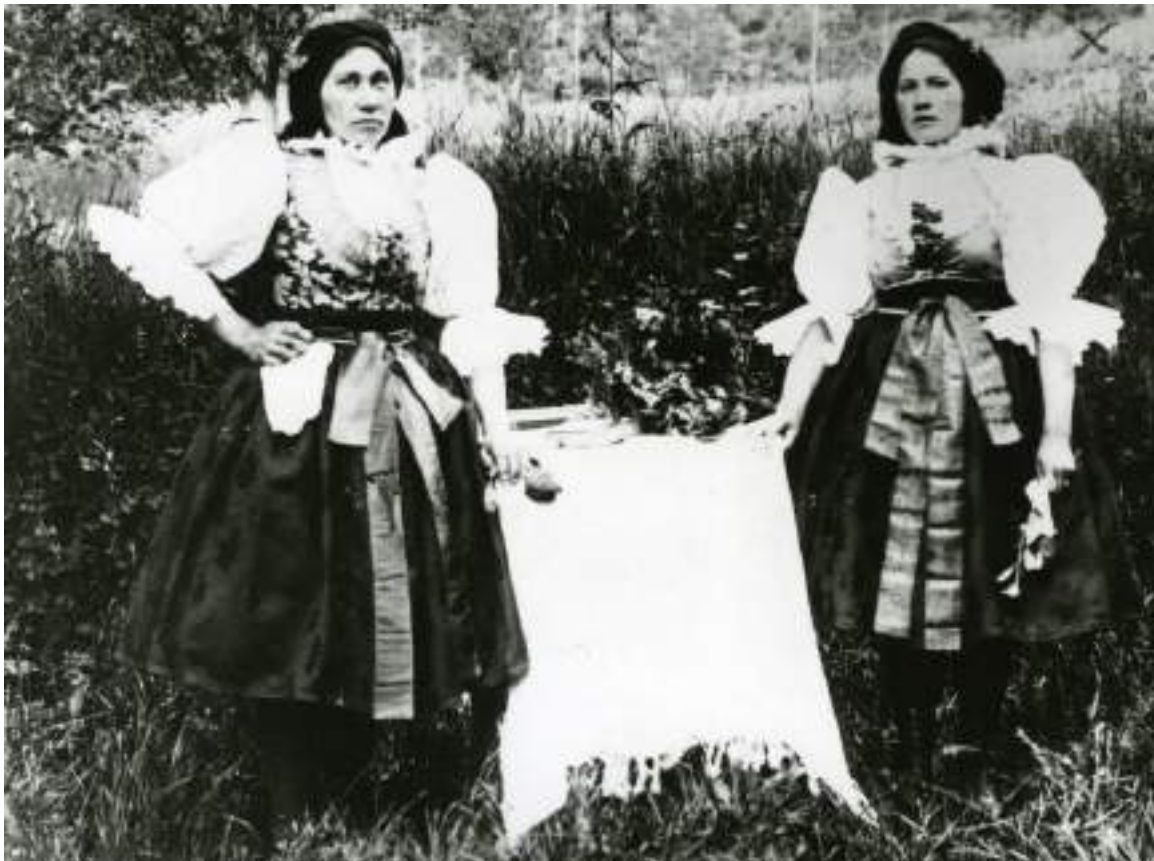
Obr. 42 Podoba slavnostního a svátečního kroje. Stříbrnice, kolem roku 1900