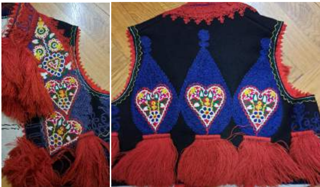
Obr. 224 Mužská vesta z Vlčnova – přední a zadní díl s cifrovanou výšivkou. Fond Slovákckého muzea v Uh. Hradišti

Vnější kapsičky, kryté ozdobnou patkou, se využívaly málo, přestože byly plně funkční. Šňurování, stejně jako výšivka, bylo původně umístěno na nejvíce namáhaných místech a švech, které se mohly dále párat a měly funkci nejen ozdobnou, ale primárně měly tato místa zpevňovat a krýt prošíití. Toto malé třepení bylo hezkou ozdobou, a tak se mimo konce šňurek začaly samostatně přišívat chomáčky či kytky z červeného kamrholu, které ještě zdůrazňovaly převažující červenou barvu v krojovém celku. Kvůli objemu a velikosti třepení na mužských i ženských kordulách se ve Vlčnově této ozdobě neříká zdobnělinou, ale používá se název kyta, kytý. Největší kytý jsou přišity pod límečkem na obou stranách, na levé přednici je však našita další velmi bohatá kyta kryjící část šňurování a výšivky i légu s knoflíkovými dírkami zvanou špunt. Knoflíkové dírky byly na starých kordulách prostrženy, naznačuje to tedy, že byly funkční a v dolní části se kordula zapínala. Jako pozůstatek další fáze zapínání je v knoflíkové dírce navlečena modrá šňůrka zápinka, která mohla stahovat obě části korduly k sobě. Při obřadních příležitostech rodinného nebo výročního zvykoslovného cyklu se do knoflíkové dírky zasunoval růžový vlněný šátek tibétek. Červené vyšívání prováděli krejčí jemnou vlnou harasem, kytý tvoří střípce namotaného kamrholu, příze, jejímž základem je velbloudí srst (z německého Kamel Haar).