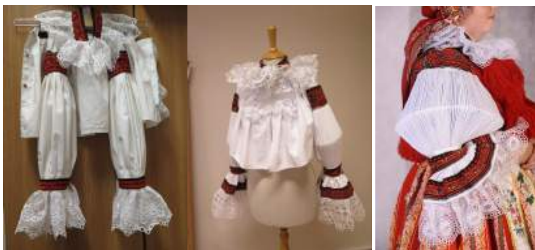
Obr. 202 Zleva: Slavnostní ženské rukávce z Vlčnova, kolem roku 1920 a 1930. Soukromý archiv (foto: Romana Habartová)

Starší rukávce příramkového střihu měly delší stánek a volně tvarované rukávy stejného střihu jako na mužské košili. V zimě se nenosily podkasané, ale stažené k zápěstí, proto se jim také říkalo natahačky. Rukávce tohoto typu zdobila výšivka původně žluto-černá, během sedmdesátých až osmdesátých let 19. století však zcela převládla v ženském vyšívání barva červená. Výšivky byly zásadně stejné barvy a vzoru na náramenicích, obojku, přednicích, úpěstích a kadrlicích. Případně se k širším náramenicím vyšívaly varianty přesně daného vzoru výšivky v užším provedení pro kadrle a úpěště (např. k náramenicím vyšitým vzorem na esko patří kadrle vyšité na ostrožsku). Kadrle, límeček i přední díly zdobila užší krajka původně tovární výroby. Ve všední dny při práci a v létě se nosily také samostatně bez kodulky, k svátečním kroji patřila kordulka, která byla šitá z hedvábných látek, v chladnějším počasí se oblékala soukenná.