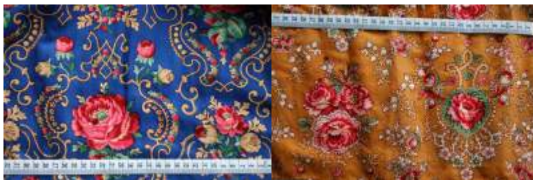
Obr. 153 Detaily atlasových předních sukni-fěrtůšků (osnova hedvábí, útek bavlna). Ostrožsko, začátek 20. století (fond Slovákého muzea v Uh. Hradišti)