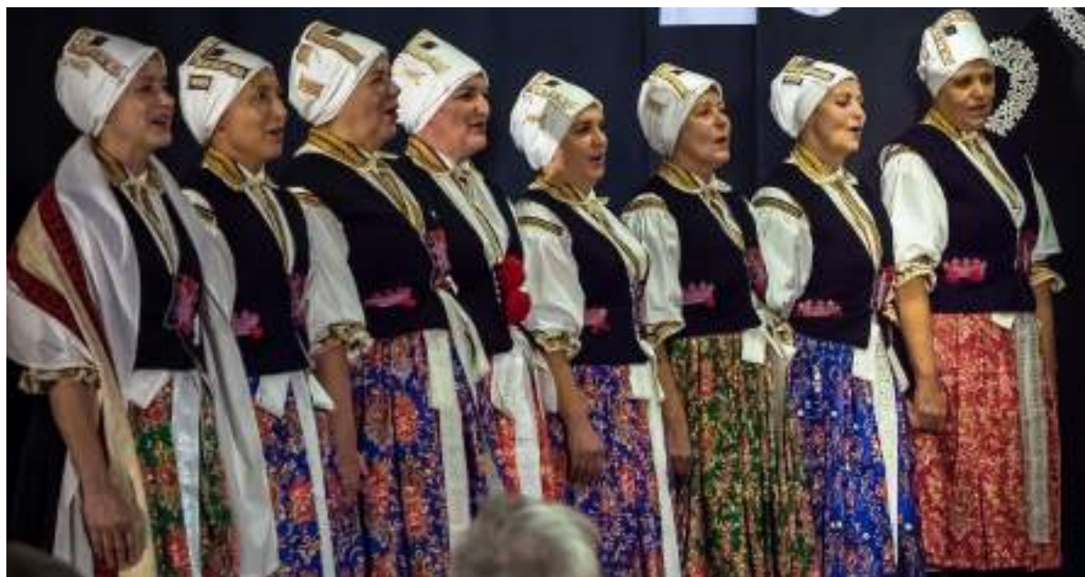
Obr. 111 Rekonstrukce slavnostního kroje z Kunovicka kolem roku 1860 podle sbírek Slovákčého muzea v Uh. Hradišti podle návrhu R. Habartové. Kunovice, 2025