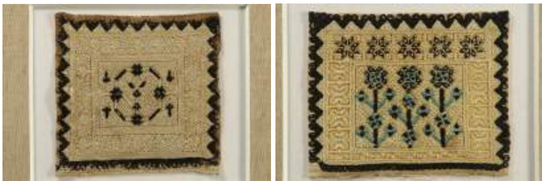
Obr. 215 Vzácná dýnko z čepců vyšitá pracnou výřezovou výšivkou. Vlčnov. Kolem roku 1850. Fond Slovákckého muzea v Uh. Hradišti

Podle příležitostí se rozlišovalo dvojí vázání šatky – konce hore a konce dole. Při úvazu konce hore se šatka vázala na uzel v zátylku. Oba konce se pak obtočily kolem hlavy. Na spánkách vynikl vzor výšivky, tzv. spona. Vázání konce hore bylo pro všední dny, k muzice a k polosvátečním příležitostem. Do kostela, zvláště k velkým církevním svátkům a obřadním příležitostem, nosily ženy šatku s konci volně splývajícími na záda. Z dvojího vázání šatky se také vyvinul dvojí způsob vázání čtvercového tištěného šatku.