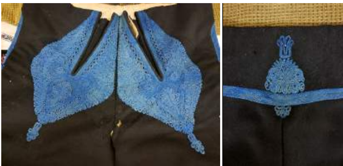
Obr. 116 Detail mužských soukenných kalhot zdobených šňůrováním na předním a zadním dílu. Kunovicko

Výzdoba kunovických soukenných kalhot je v souladu s celým mužským krojem velmi prostá, nevtravá, jednobarevná: vepředu oba šikmé rozstříhy (punt) zdobí husté šňůrování, které tady nesahá níž než do horní třetiny stehen. Zadní šev zakrývá malý tulipánek, boční švy i šev od kyčlí směrem dozadu takzvaně utahuje či drží poměrně úzká šňůrka. Celá tato výzdoba je provedena našitými užšími i širšími šňůrkami barvy ultramarínové modře.