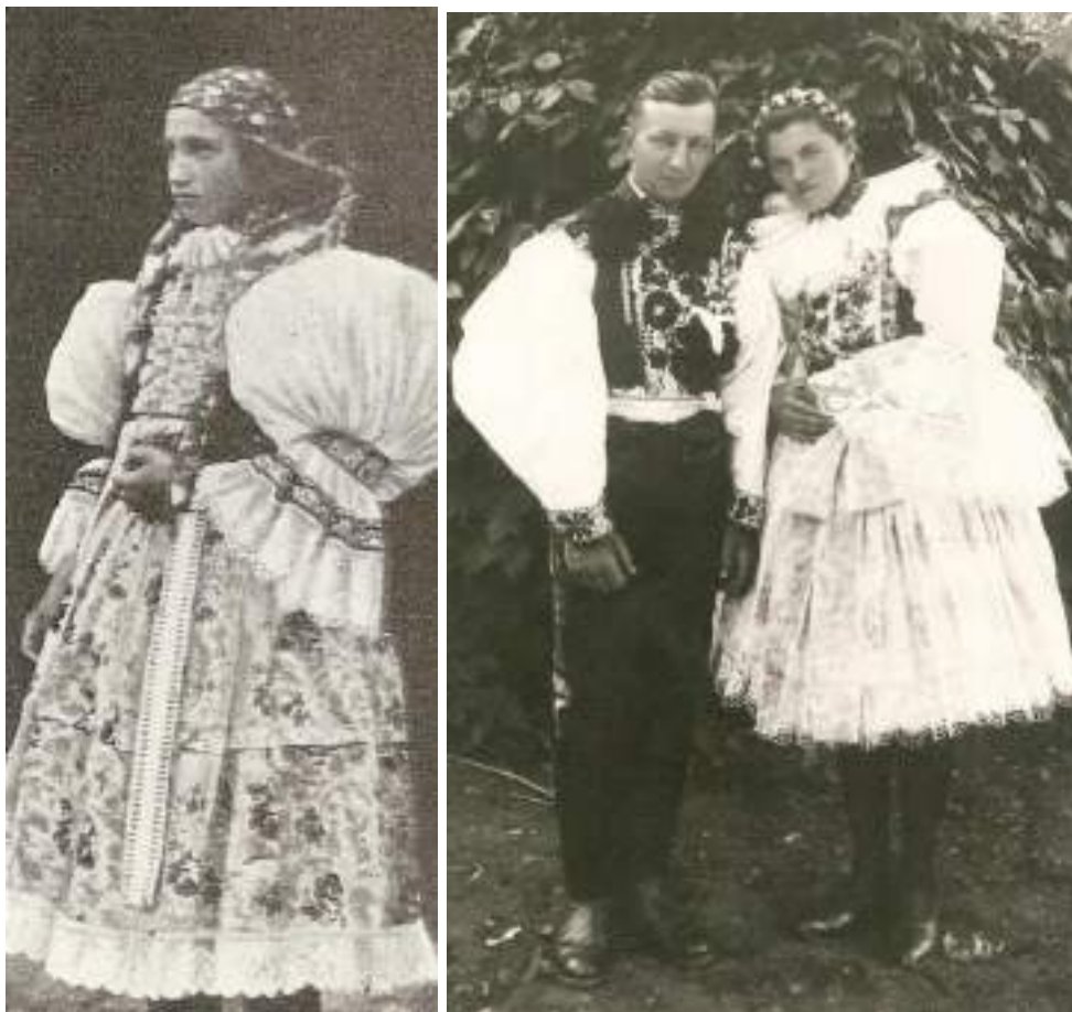
Obr. 145 Zleva: Ženský slavnostní oděv z oblasti Ostrožsko, baňaté volně vrapené rukávce, délka sukni pod polovinou lýtek, vysoké holínkové boty, Ostrožská Nová Ves, 1892

tzv. lémce. Obřadní zadní sukni i zde představuje bílý, hustě navrapený fěrtoch, šitý z bílého šifonu, který měl ještě na přelomu 19. a 20. století v pase vyšitou formu přes vrapy.