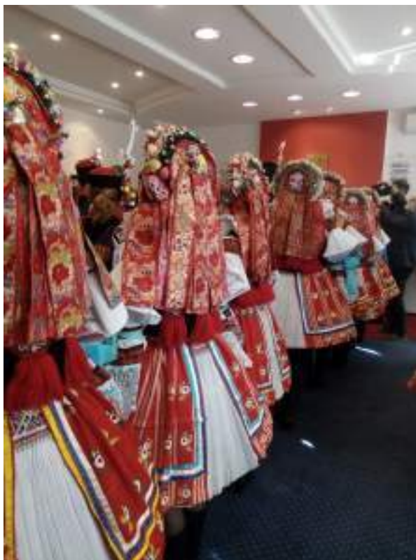
Obr. 213 Dívky z Vlčnova v obřadním kroji s věncem na hlavě, v bílých zadních sukních-fěrtoších a předních sukních s našitými pentličkami. Vlčnov, kolem roku 2024

Výrazný vývoj zaznamenala délka sukní. Před rokem 1890 sahala sukně ženám až do půli lýtek a délka dodávala celé siluetě důstojnosti. Postupně se délka sukní zkracovala. Po první světové válce to bylo ještě hodně pod kolena, kolem roku 1945 pod kolena. Platilo pravidlo, že při pokleknutí v kostele by měly sukně dosahovat právě na zem.