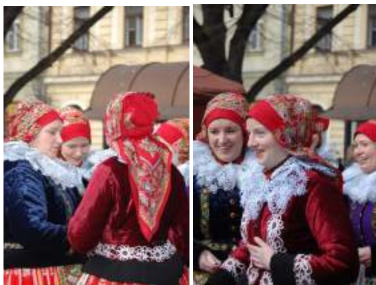
Obr. 207 Mladé ženy z Vlčnova v zimních kabátcích-jupkách a kabaních, ve specifickém úvazu šátku. Vlčnov, 2008