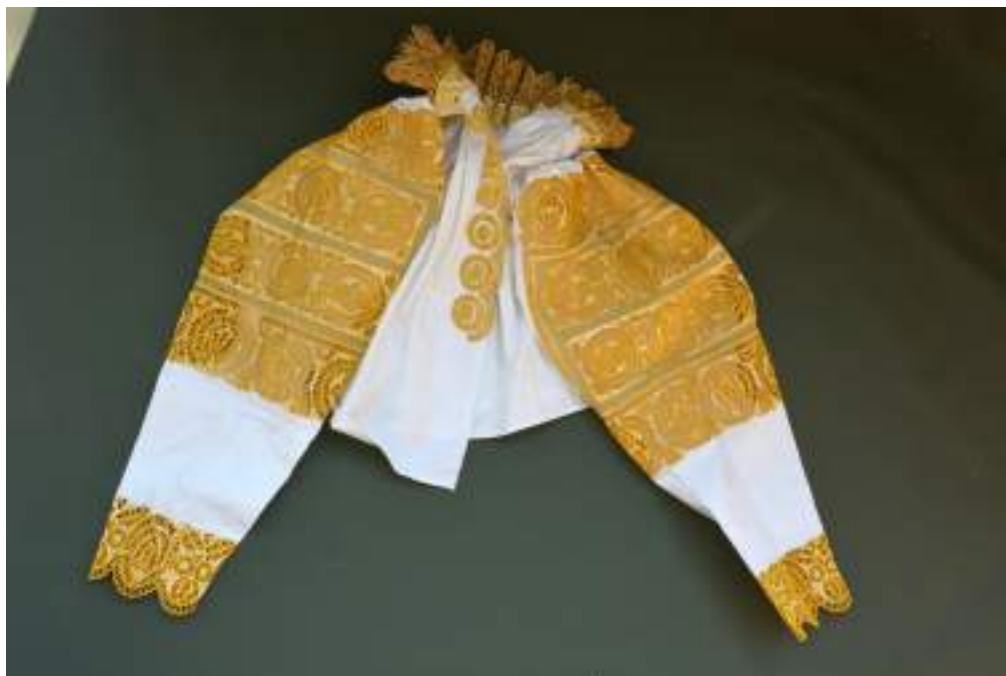
Obr. 13 Sviatočné sirkové rukávce. Krakovany, 1. polovica 20. storočia