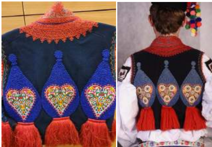
Obr. 223 Mužská vesta z Vlčnova – zsdní díl s cifrovanou výšivkou. Fond Slovákého muzea v Uh. Hradišti; mladý muž ve slavnostní soukenné korduli. Vlčnov, 2009