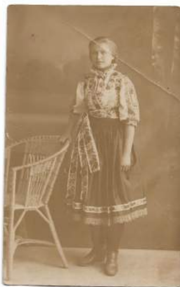
Obr. 1 Dievka vo sviatočnom odevu, 1. tretina 20. storočia (archív autorky)

Zásterky sa obliekali v poradí zadná - predná . Predná zásterka prekrývala okraje zadnej zásterky na bokoch nositeľky alebo vzadu. Spod zadnej zásterky mohol cca 3 cm vytrčať okraj rubáša.