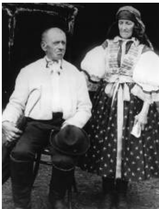
Obr. 45 Sváteční kroj starší generace. Bílovice, kolem roku 1890

d) typ kroje bílovického se nosí v obcích Bílovice, Včelary, Březolupy, Šarovy, Částkov, Svárov, Zlámanec, Nedachlebice, Mistrice, Javorovec, Kněžpole a Topolná.