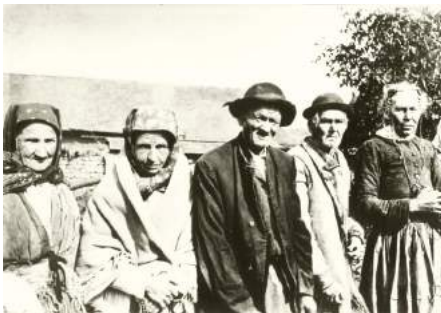
Obr. 31 Lidový oděv chudých obyvatel Kunovic, kolem roku 1900 (soukromý archiv)

Ve svátečním oblečení se záhy začalo odrážet postavení nositele a stav hospodářského a společenského vývoje určité obce nebo regionu. Lze již sledovat větší pestrost v materiálu a fakt, že hlavním požadavkem už není jen funkčnost a účelnost, jako je tomu u pracovního oblečení. Součásti již mají více variant, a to dobových, krajových, místních, a dotvářejí celkový charakter oblečení. Tyto změny vrcholily v závěru 18. století. Záleželo na jednotlivých panstvích, kde vrchnost diktovala různá nařízení, umožňovala větší svobodu jako hlavní předpoklad pro hospodářský a společenský růst oblasti. V souvislosti s tím pronikaly do oblečení nové i dovážené textilie, nové střihy, doplňky, způsoby zdobení, techniky apod.