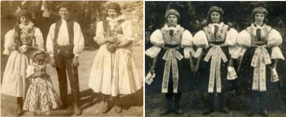
Obr. 41 Podoba slavnostního a svátečního kroje. Medlovice, kolem roku 1900 a 1910