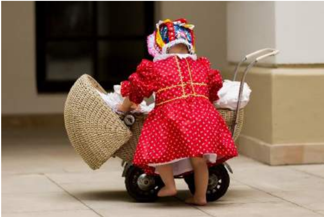
Obr. 129 Současná podoba lidového oděvu batolete – rekonstrukce podle návrhu R. Habartové. Děvčátko v šatičkách-kanduších. Ostrožsko, 2020

Děvčata , šolačky, byly oblékány různě v závislosti na jejich sociálním původu. Děvčátka z rolnických rodin chodila do školy v kroji, v rukávcích, vestičkách-kordulkách , sukních-šorcích a předních fěrtúškách , nejčastěji vlněných štofových nebo pruhokvětách, ve 20. století běžně oblékala podle ročního období lehčí hedvábné nebo teplejší sametové svrchní kabátky-jupky , zdobené prýmky, portami a kraječkami jako u ženské varianty, u krku s krajkovým nebo plátěným krejzlíkem.