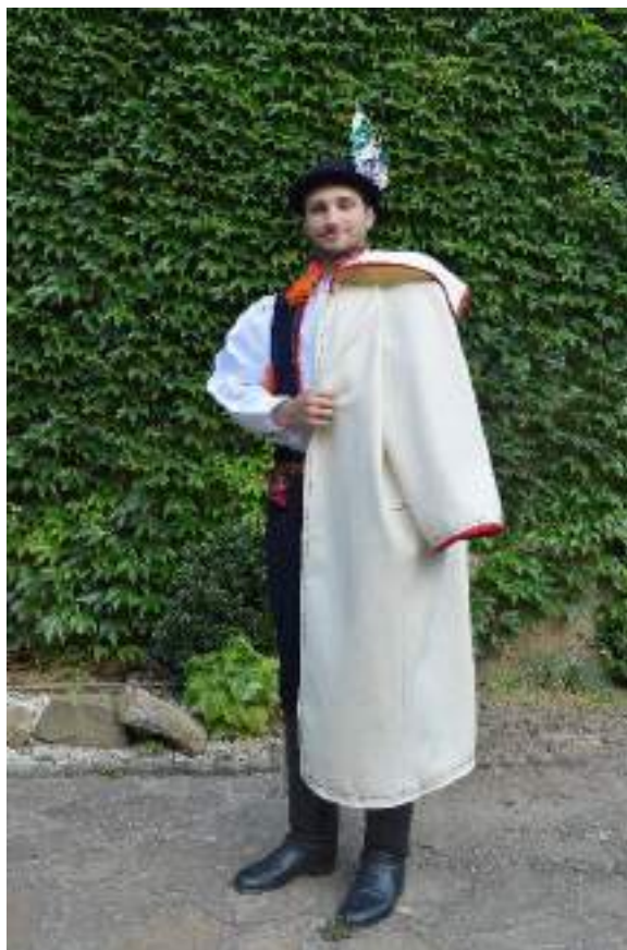
Obr. 192 Mladý muž ve slavnostním kroji – v korduli, starší formě kloboučku a v haleně z Ostrožska. Rekonstrukce kolem roku 1890 podle návrhu R. Habartové. Blatnice, 2015. Podle fondu Slováckého muzea v Uh. Hradišti

K starým součástem mužského svrchního oděvu patří tříčtvrteční nebo až ke kotníkům sahající haleny rovného střihu s čtverhranným límcem sahajícím do třetiny zad. Muži je nosili především k práci, často jen přehozené přes ramena, a v chladném počasí. Klvaňa zapsal, že se halena této lokality lišila od okolních hlavně límcem, který sahal hlouběji do zad a na konci byl ofranclený , tedy přizdobený krátkým třepením, nad ním se dvěma černými asi deset centimetrů od sebe vzdálenými vodorovnými proužky. Haleny byly šité z huně nebo světlého sukna a po obvodu lemované červeným sukénkem. 73