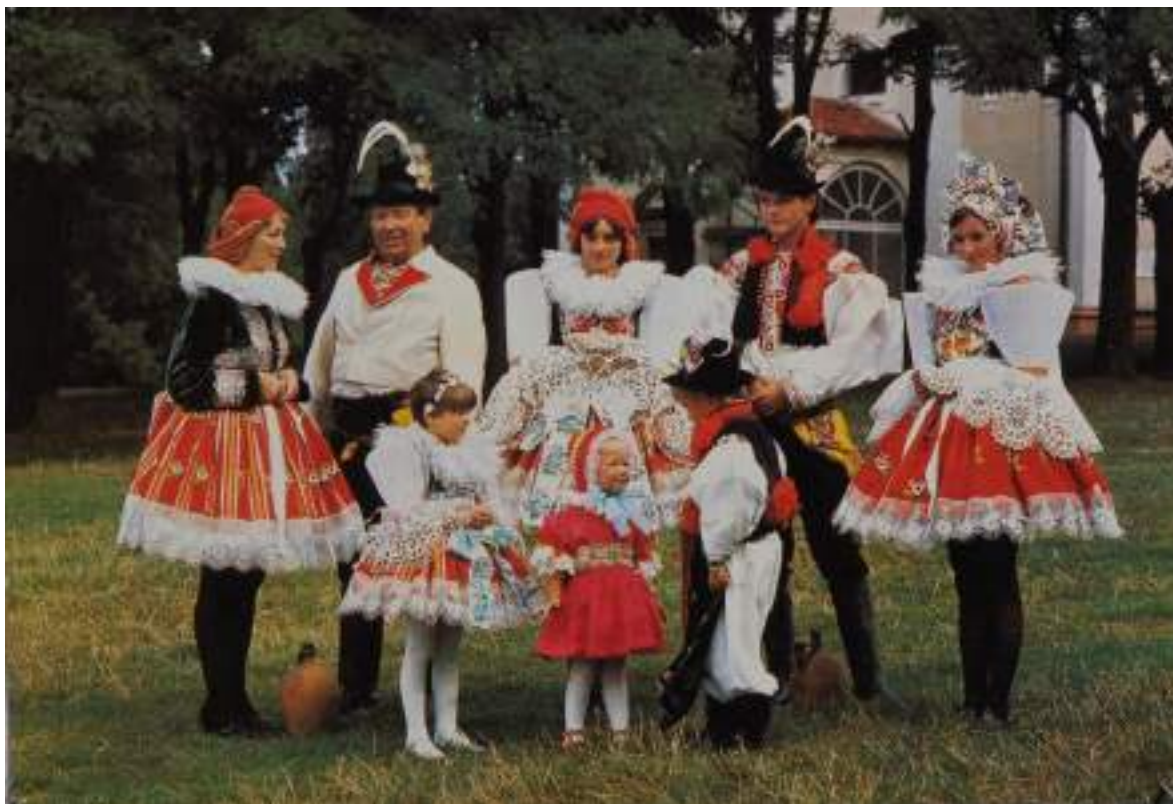
Obr. 27 Rodina v ostrožském typu kroje, ve slavnostní a obřadní (družička) variantě na pouti u Sv. Antonínka. Současná podoba kroje. Blatnice u Sv. Antonínka, 2013