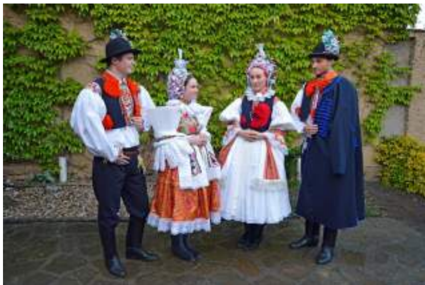
Obr. 36 Rekonstrukce obřadního kroje z Uherskoostrožska, podle muzejních sbírek kolem 1890 (vpravo) a 1920 (vlevo) navrhla Romana Habartová. 2012