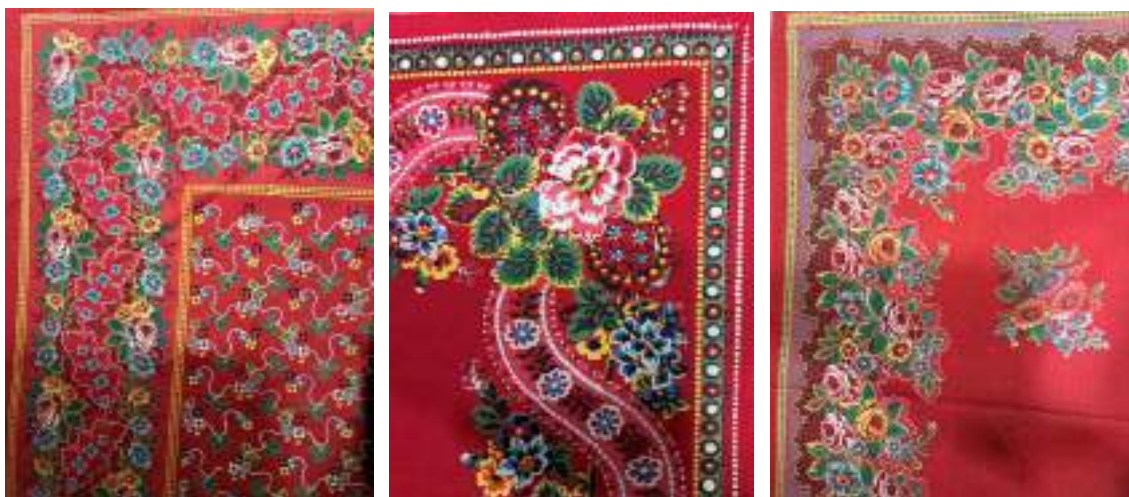
Obr. 112 Ukázka tureckých šátků z Kunovicka

Červené a černé turecké šátky jsou dodnes obvyklou a výraznou součástí svátečního oblečení žen i dívek, které se příležitostně v průběhu slavností a obyčejů oblékají do kroje. Šátek je čtvercového formátu o straně asi 160 centimetrů a je kvůli náročnému vázání největší ze všech šátků na Slovácku. Na každém šátku dle slov pamětnic rozlišujeme kraj, prostředek a hlavní část. Krajem je rozuměna bordura, obruba, která lemuje obvod. Bývá potištěn rozmanitými většími i menšími květy, linkami, pruhy a puntíky barvy bílé, žluté, narůžovělé, modré i černé a zelenými listy a lístečky ohraničenými často žlutými čárkami.