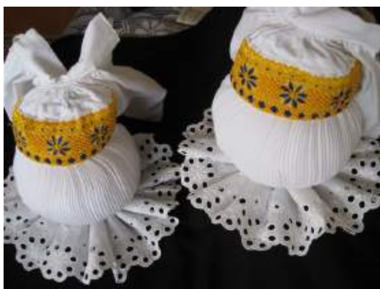
Obr. 88 Rukávce s kordulkou, kadrle a baně s kadrlemi, Břestek