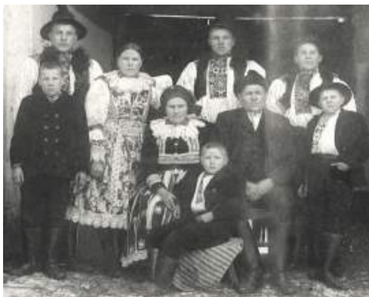
Obr. 190 Slavnostní kroj i poměštěný selský mužský oděv. Ostrožsko - Hluk, kolem roku 1920

Pro zpevnění tvaru se namáčely do cukrové vody a po zaschnutí a rozpletení dosáhly žádaného kudrnatého vzhledu. 72