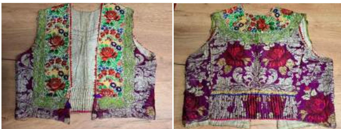
Obr. 84 Ženská vestička/kordulka – přední a zadní díl, Staré Město