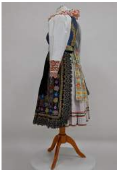
Obr. 7 Dievocký odev na tanečnú zábavu. Krakovany, 1. polovica 20. storočia