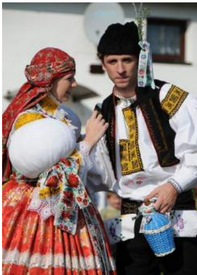
Obr. 73 Slavnostní kroj hodové mládeže. Současná podoba kroje. Částkov, 2009

Dívčí slavnostní kroj řadíme k bílovickému typu kroje. Výřezové vyšívání na obojku, přednicích a na ramenou je nejvýznamnější krojovou součástí, většinou se v rodinách dědilo, proto se objevuje vyšívání se starými motivy, ale lidé si pořizují stále častěji nové světle žluté s fialovými výplněmi znameny . Brokátové kordulky světlých barev doplňují povětšinou červené přední brokátové sukne zdobené našitou širší či užší bílou tylovou krajkou. V Částkově není zvykem uvazovat na šorec černou pentli. Na hlavu si děvčata uvazují turecký šátek na záušnice po ploše s drobnými kvítečky nebo halouzčkami, na nohou mají černé punčochy a vysoké boty na šněrování. Děvčata, která se zúčastňují výročních a církevních slavností, chodí tzv. za družičky, v bílých krojových součástech a na hlavě nosí věneček z umělých látkových a povoskovaných kvítečků a lístků.