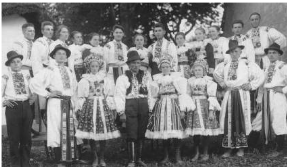
Obr. 179 Svatebčané v obřadním a slavnostním kroji z Ostrožska. Hluk, 1928 (soukromý archiv)

K základním součástem mužského oděvu patří košile. Mužská slavnostní příramková košile dudovice je šitá z bílého, původně šifónového plátna. Má široké baňaté, tzv. vyduté rukávy, u zápěstí zúžené do užší manžety, a je zdobená výšivkou. V 19. století byla výšivka provedená jemnou výřezovou technikou, ve 20. století byla nahrazena výšivkou plnou, dnes je často provedená křížkovým stehem. Výšivka zdobí ramena, límeček i manžety, na hrudi je široká náprsníčka .