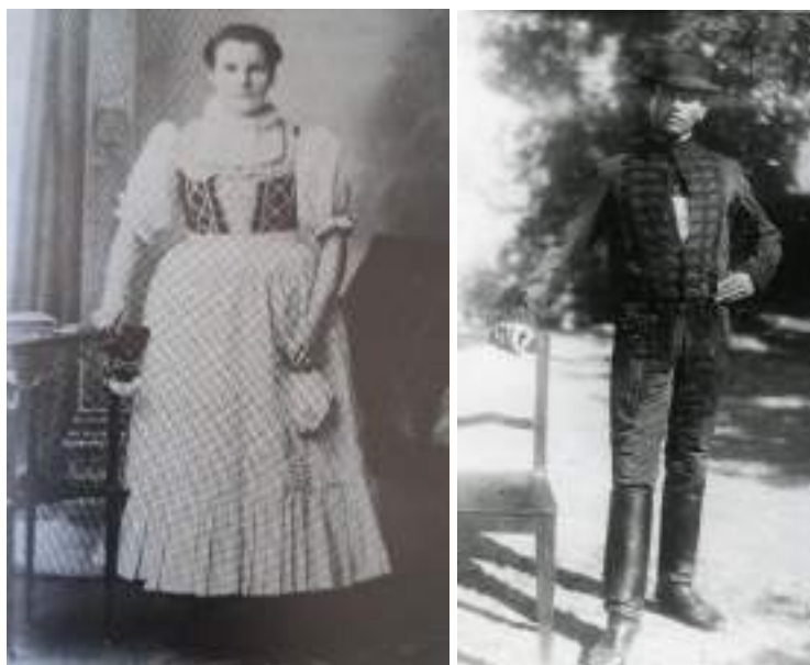
Obr. 56 Starobylá podoba slavnostního kroje v obci Osvětimany. Osvětimany, kolem roku 1890