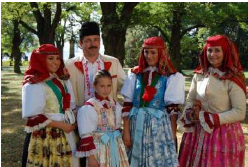
Obr. 98 Současná podoba slavnostního kroje Kunovicka, 2008

Barevné stuhy, pentličky, jimiž se mnohdy uvazují kadrle nad lokty, jak je vidíme všude v okolí, na Kunovicku ke kroji nepatřily.