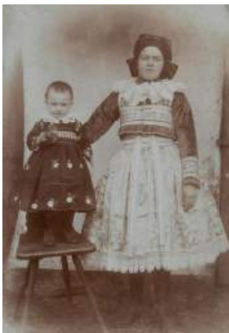
Obr. 131 Matka s dítětem ve slavnostním kroji , matka v sametové jupce, dítě v kanduších-němkyni. Blatnice pod Sv. Ant., kolem roku 1910

Na hlavě nosí malý klobouk s voničkou nebo beranici . Děvčata se oblékají jako starší dívky. Nosí lomené rukávce , sametové kordulky jsou miniaturami dospělých kordulek, po obvodu výstřihu jsou zdobené výraznou vyšívanou pentlí. Sukně jsou šité z pastelových brokátů, po celém obvodu zdobené bílou krajkou. Na hlavě mají hranatý úvaz na ušnice. Vzadu na zádech z něj dolů splývá zapletený cop, lelík, s pentličkou.