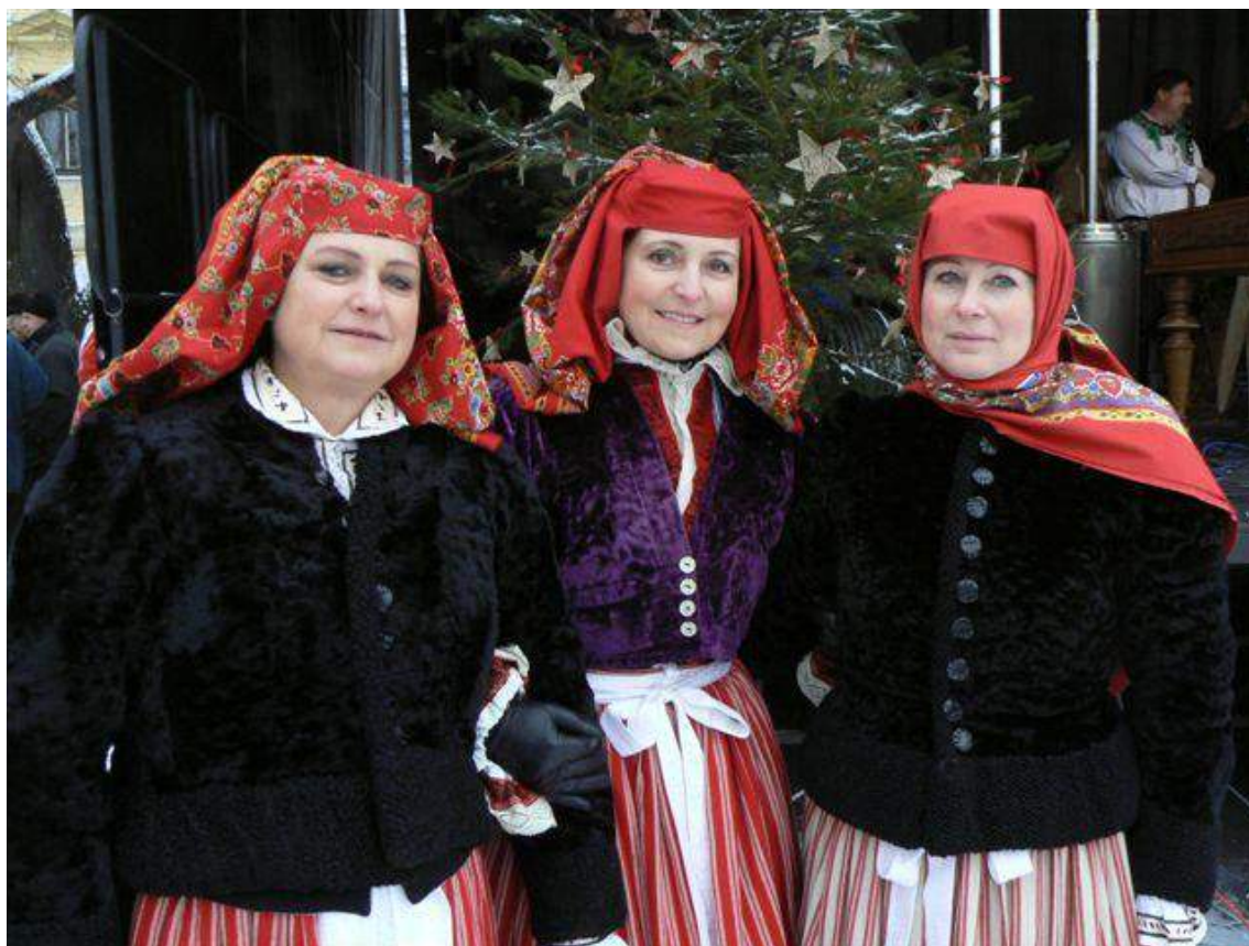
Obr. 105 Vdané ženy ve sváteční podobě kroje Kunovicka, v zimním kabátku-upjačce a fialové kabani, v tureckém šátku uvázaném na rožky, na záušnice a pod bradu. Kunovice, 2015

Kabaně byly bez límce, kolem krku lemované úzkým páskem z téže látky, rukávy byly v ramenou nabrané do drobných vrapů, od ramen splývavé a k zápěstí zužované. Strih rukávů fialových i červených moldonek byl jednošvový, ale protože byly v ramenou širší než šířka látky, musely být po obou stranách každého rukávu vloženy klínky tvaru trojúhelníku. Spodním okrajem sahaly jen do pasu, aby vzadu bylo na sukni vidět celou šířku šorcové formy.