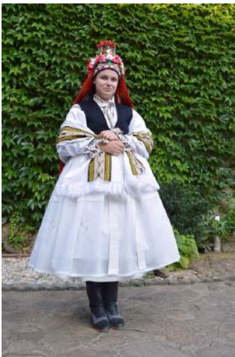
Obr. 108 Rekonstrukce obřadního kroje kolem roku 1870–1880 pro nevěstu podle návrhu R. Habartové. Kunovice, 2018

Josef Klvaňa píše: „Hlavním motivem ve středovém pruhu úvodnice je paličkovaná vložka, zvaná na grumle. Vložky bývaly různě široké, nejčastěji 6 až 7 cm, výjimečně i 8,5 cm. Byly provedené paličkovanou technikou z hrubých rezných nití přírodní barvy s černým vzorkem. Po obou podélných stranách krajky jsou našity pruhy vyšívání širokého 1,5 až 3 cm. V Kunovicích měly motiv na hodinky, a to buď slepé, nebo šesterné, makúvkové, struhálkové s paožkama, se zuby na vnějších stranách, na eska a ostrožku i s výřezem, po obou stranách hlavního vyšívání jsou šesterné hodinky i zadržací řetázky. Vyšívání je provedeno precizně lesklým nažloutlým hedvábím.“ 31