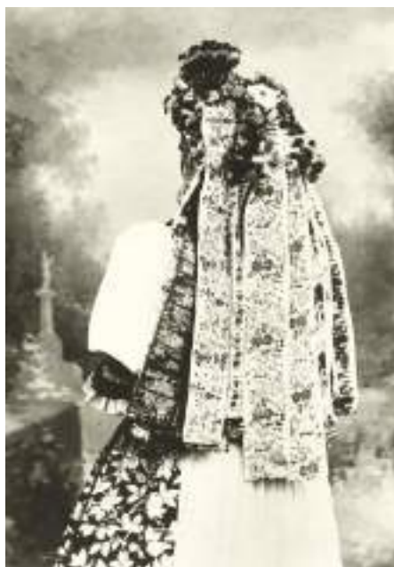
Obr. 92 Dívka v pentlení z Kunovic, pohled zezadu na tzv. ocas, 1890

Naprosto mimořádný je původní obřadní věnec – ženské nevěstovské pentlení, které nepodlehlo žádným inovacím. Dodnes se přivazuje k vlasům postupně sedm samostatných částí. Klvaňa toto pentlení hodnotí jako jedno z nejpůsobivějších u nás. Pouze pentle v ocasu-fáboru zhruba z 12 až 14 stuh bývaly dříve užší a s červeným základem, ve 20. století jsou širší, se základem bílým. Do roku 1900 sahaly vzadu i dvacet centimetrů pod pás, během 20. století byly zkracovány a jejich spodní okraje dosahují k formě fěrtochu, aby bylo formu vidět. Spodním prádlem žen byly starobylé spodní košile rubáče, které vyčnívaly ještě kolem roku 1920 na dlaň, tj. asi šest centimetrů. Dnes je to asi jeden centimetr.