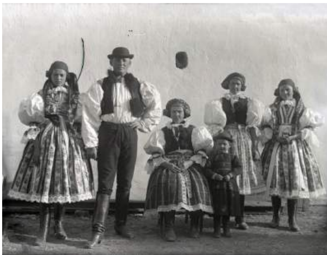
Obr. 174 Rodina ve slavnostních krojích z Ostrožska, kolem roku 1900