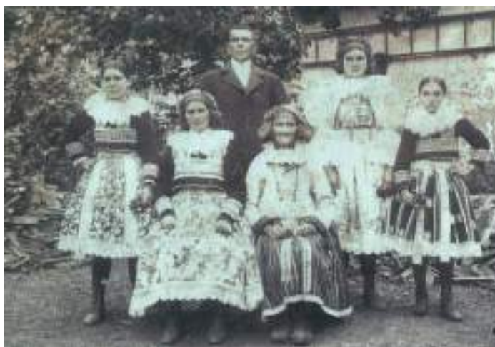
Obr. 173 Rodina ve svátečním oděvu, různé typy obuvi, starší žena má vysoké boty holínkového typu, děvčata mají šněrovací střevíce, muž již v městském oblečení, rozdílná pevnost a forma úvazu šátku u staré ženy, mladší ženy a děvčat, Blatnice, počátek 20. století

Ke kompletnímu ženskému kroji patří odpovídající pokrývka hlavy. Ještě v první polovině 19. století měly ženy hlavu pokrytou plátěným čepcem a pruhem plátna, tzv. šátkou s pracnou výšivkou na jemný výřez ve smetanových, žlutých nebo okrových barvách, s černými zoubky a černými řetízky po obvodu, často po obvodu s úzkou paličkovanou kraječkou, která korespondovala s vyšíváním na rukávcích. Šatky měly na obou koncích jemnou černo-smetanovou hedvábnou výšivku, vázaly se na čepce s čtyřhranným dýnkem větším než na Kunovicku. Tyto starobylé a dnes velmi vzácné krojové součástky byly v první polovině 19. století vytlačovány červenými tureckými šátky , kterým i zde předcházely tmavomodré, žlutě kvítkované, podomácky barvené barveňáky .