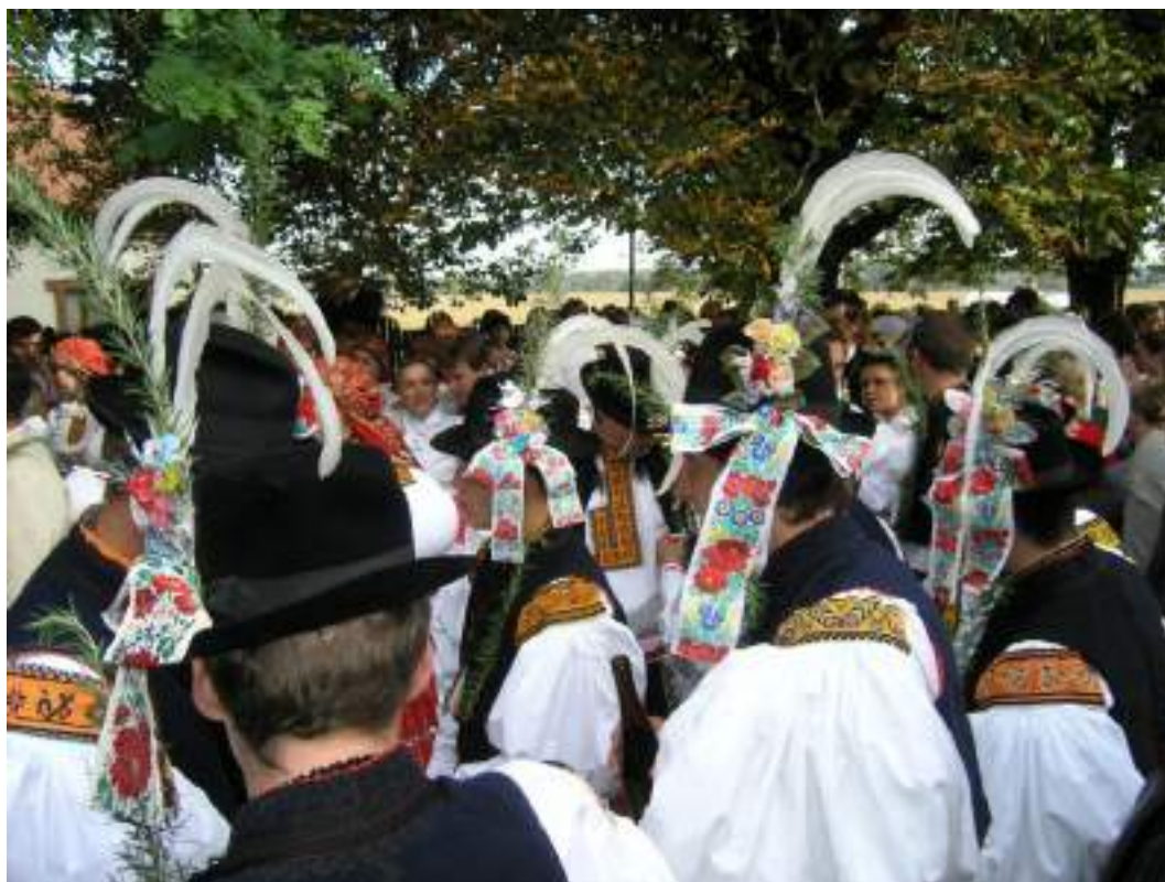
Obr. 47 Výzdoba klobouků mládenců hodové chasy. Polešovice, 2005

K slavnostnímu mužskému kroji patří tmavé až černé soukenné nohavice a kordula, které jsou zdobené jemným a bohatým šňurováním. Plátěná košile má velké nažehlené dudové rukávy; košili zdobí vysoké bubénkové vyšívání na hrubý výřez v původní barevnosti, syté oranžové barvě s barevnými fialovými a modrými znameny . Na hlavách nosí zdejší svobodní muži klobouky bohatě zdobené voničkou se stuhou a s velkými kosárky. Takto se oblékají k hodům jenom stárci. Celá mužská svobodná chasa obléká dudovou košili, kordulu, plátěné tráslavice a modrotiskovou zástěru, která se uvazuje širší tkanicí. Starší zástěry jsou vyšíváné,