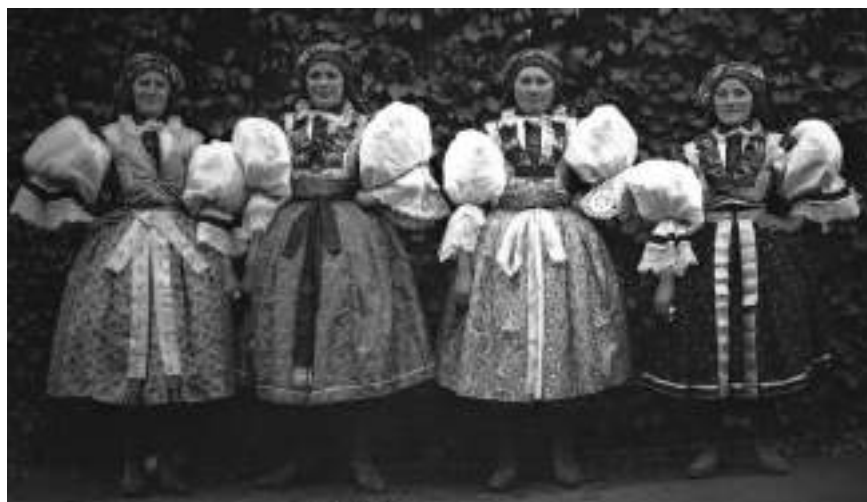
Obr. 39 Dívky ve slavnostním kroji. Polešovice, 1908