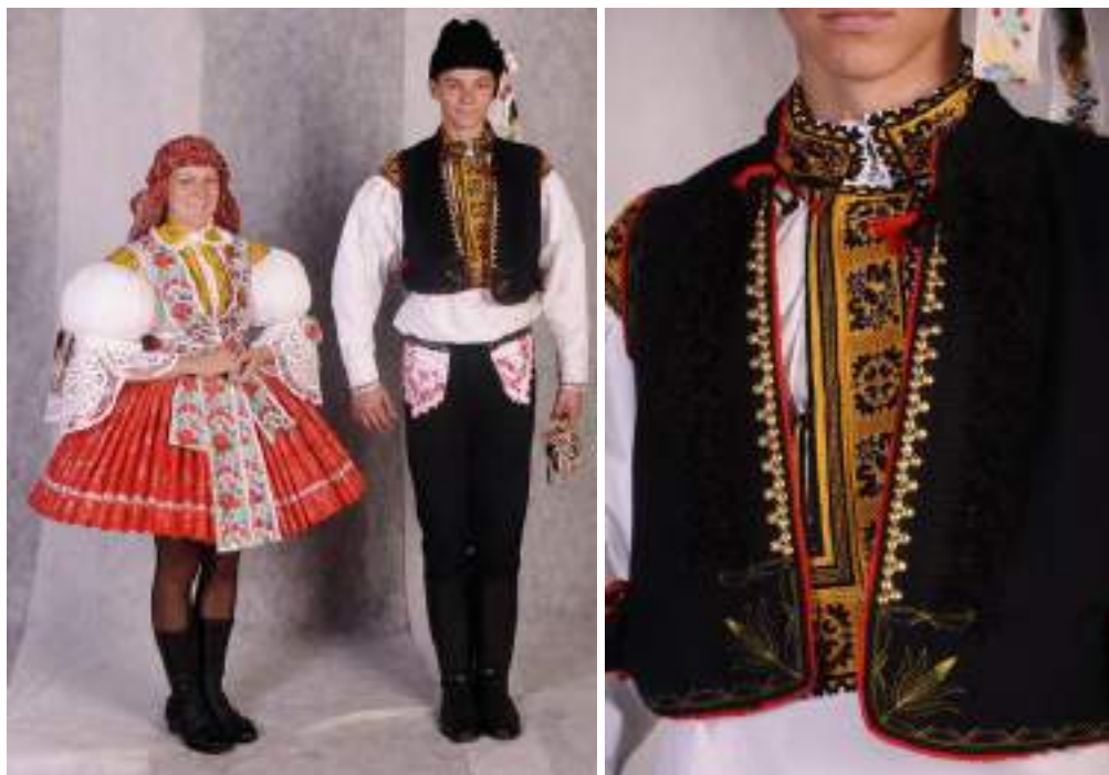
Obr. 69 Slavnostní kroj hodové mládeže. Současná podoba kroje. Bílovice, 2009