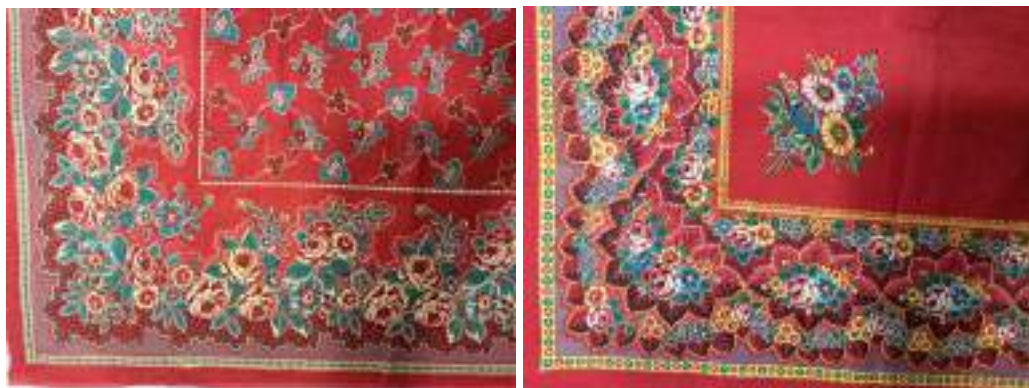
Obr. 74 Detail motivu tureckých šátků