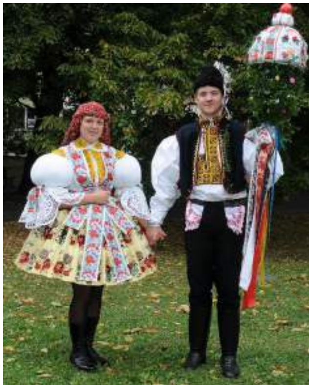
Obr. 68 Slavnostní kroj hodové mládeže. Současná podoba kroje. Bílovice, 2009