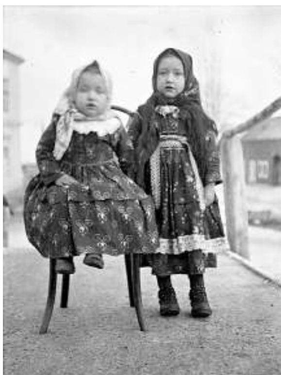
Obr. 128 Děvčátka v tradičním lidovém oděvu – v šatičkách-němkyních a šátku. Ostrožská Lhota, 1908