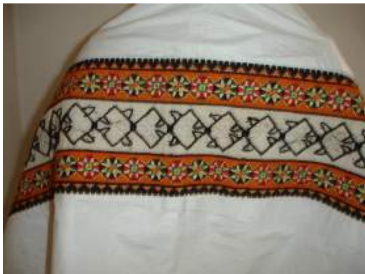
Obr. 170 Úvodní plachta přes ramena ženy, rekonstrukce podle návrhu R. Habartové podle muzejních sbírek – střed úvodnice je necovaný s motivem na grumle, pruhy tvoří pracná výšivka podle počítané niti podle předlohy kolem roku 1880. Práce L. Farkašové. Ostrožsko, 2013

Byl to přes dva metry dlouhý pruh plátna, jehož střed tvořila podélná výšivka. Šíře se pohybovala kolem padesáti centimetrů. Barevnost a provedení výšivky korespondovaly s výšivkami uplatněnými na čepcích a na rukávcích. V 19. století to byla umírněná stylizovaná geometrická výřezová výšivka v krémových barvách provedená hedvábím. Ve 20. století začal být pás výšivky druhotně používán např. rozstříháním jako výšivka na rukávce či na šorec.