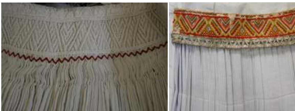
Obr. 147 Zleva: Plátěný fěrtoch s geometrickou výšivkou přes vrapy, Uherskoostrožsko. Kolem roku 1890