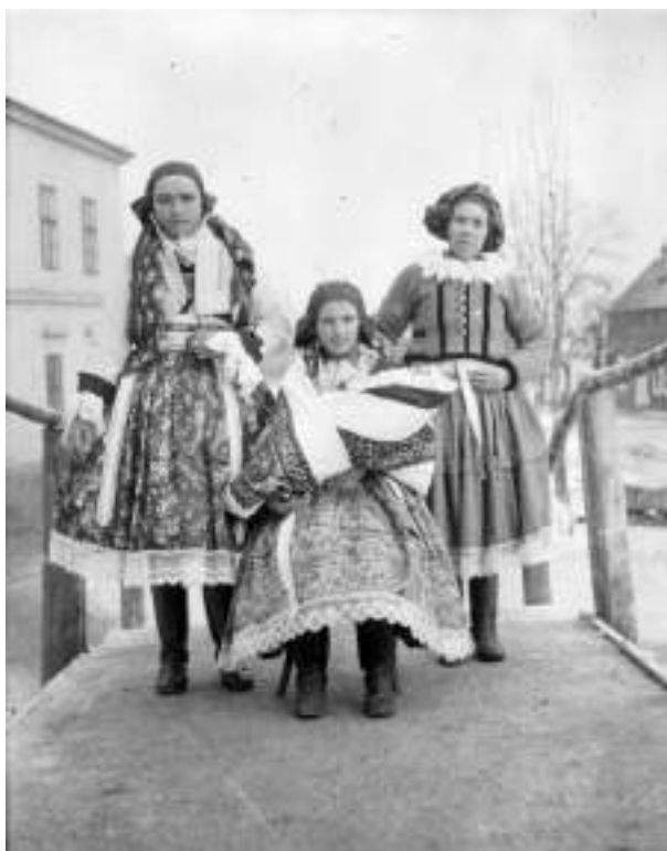
Obr. 127 Ženy ve slavnostních krojích Ostrožska, ve svrchním kabátku-kabani a v lajblech, matka s kojencem v úvodní plachtě. Ostrožská Lhota, 1908 (soukromá sbírka)

avrstičky- kordulky , také cajkové nebo manšestrové sedlcké oblečky tvořené kalhotami, sakem i vestičkou, do ní oblékali bílé košile sámkovice, po stranách sámků zdobené pruhy s květovanou výšivkou. Na hlavě nosili širáčky nebo beranice .