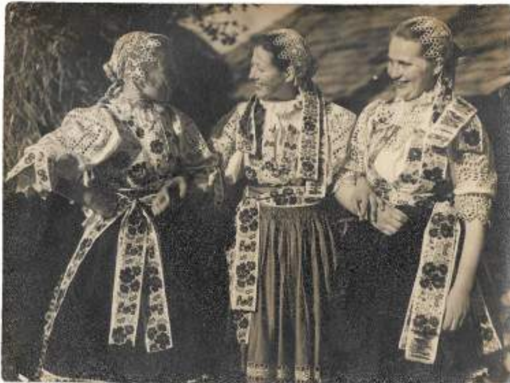
Obr. 4 Ženský letný sviatočný odev, 1. tretina 20. storočia, Piešťany

Vydaté ženy nosili k sviatočnému odevu aj tylangrové šatky . Tie boli strihané do štvorca a aspoň z dvoch strán lemované paličkovou alebo kupovanou čipkou. Prekladali sa do trojuholníka. Okolo uší sa naskladali a pod bradou najskôr zopli špendlíkom a následne uviazali na uzol. Cíp, ktorý visel vzadu mohol byť vyšívajú dierkovou a hladkou výšivkou bielou bavlnkou. V chladnejšom počasí nosili ženy šatky z pevnejšieho materiálu, napr. z brokátu, ktoré boli po troch stranách zdobené dlhými strapcami.