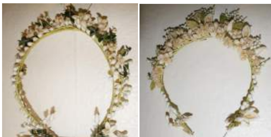
Obr. 177 Věnečky z umělého textilního a voskového kvítí. Blatnice, 1. polovina 20. století (fond Slovákkeho muzea v Uh. Hradišti)