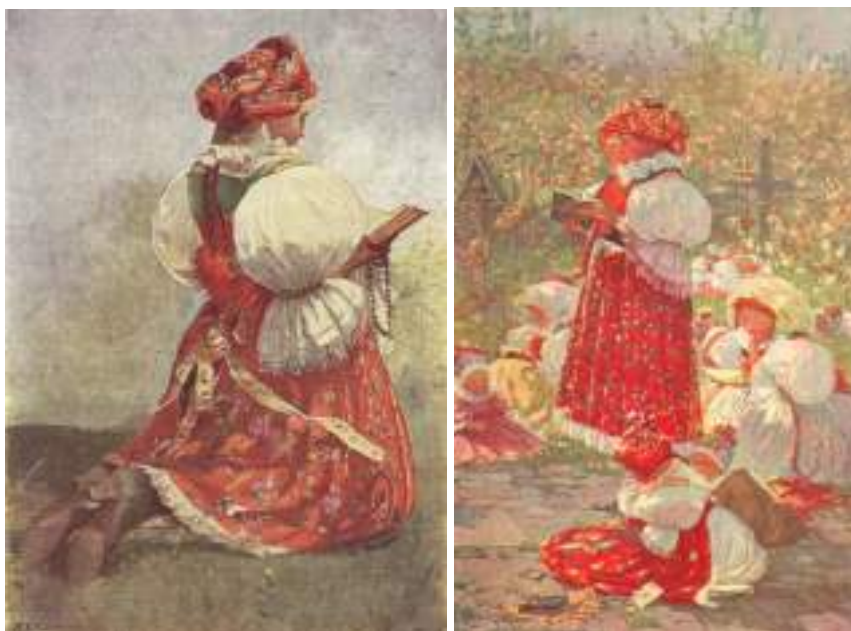
Obr. 121 Zleva: Děvče od Uherského Ostrohu, kolem roku 1910. Joža Uprka. Reprodukce pohlednice.