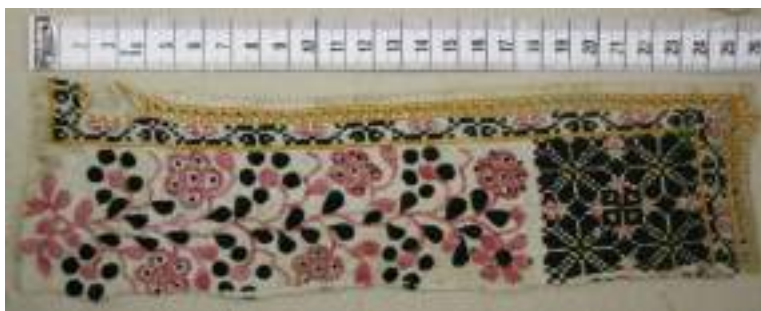
Obr. 184 Fragment mužské košile, kombinace geometrické a malované výšivky, barevnost žlutá, červená a černá, Blatnice, 1900. Fond Slovákého muzea v Uh. Hradišti

Výšivka podle předkresleného vzoru, malovaná výšivka svou ornamentikou nerespektuje podkladovou tkaninu. Výšivka se provádí zpravidla na rámu, kde se vypíná vyšivací tkanina. Materiálem bývá jemnější plátno. Ve volné ruce bez upevnění na rám se vyšivaly jen oděvní součástky jako např. kožich.