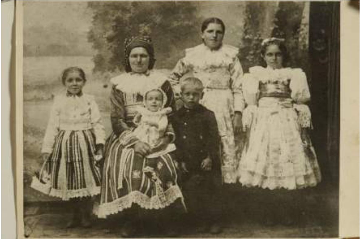
Obr. 124 Rodina ve slavnostních krojích, batole v plátěných šatkách a čepičce, školní děti již ve zmenšenině dospělých krojů, chlapec v poměštěném selském oblečku. Ostrožsko, 1920