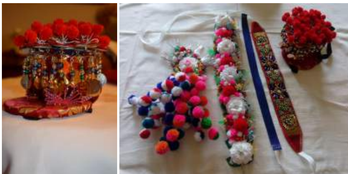
Obr. 113 Detaily rekonstruovaných částí dívčího obřadního pentlení pro Kunovicko