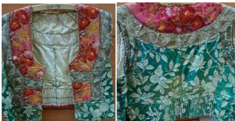
Obr. 81 Ženská vestička/kordulka – přední a zadní díl, Polešovice