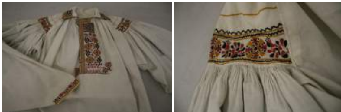
Obr. 180 Mužská košile-dudovice, kombinovaná výšivka provedené hedvábím. Blatnice, 1890 (fond Slovákého muzea v Uh. Hradišti)

Naturalistický květový motiv je proveden podle předkreslené niti pestrobarevně, obvykle červeně, žlutě a černě. Někdy jsou na ostrožské košili pod výšivkou v malém medailonu v podobě kroužku, srdce nebo věnečku uváděny iniciály či jméno majitele nebo vnočení. Tento typ košile dnes oblékají svobodní mládenci k soukenným nohavicím pro slavnostní příležitosti, mladí chlapci a starší generace ji oblékají k plátěným třaslavicím a zástěře.