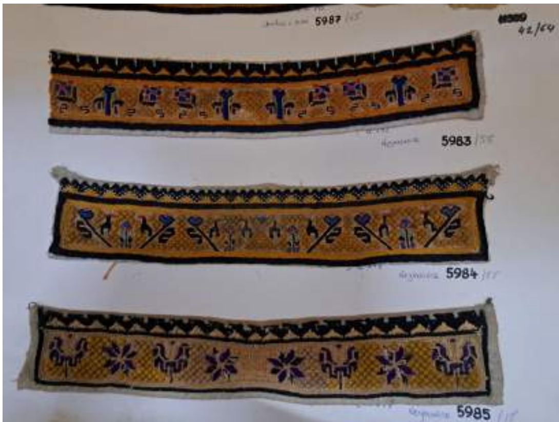
Obr. 86 Výšivky podle počítané niti, na hrubý výřez, Boršice, Nedakonice