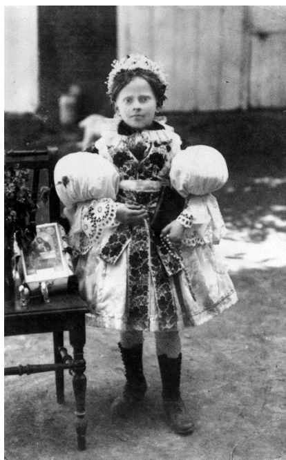
Obr. 52 Boršice, obřadní kroj dívky k 1. sv. přijímání (F. Horenský, kolem roku 1928)

Boršický kroj řadíme z národopisného pohledu do uherskohradištského Dolňácka, do krojů dolňáckých a představuje typ kroje polešovického. Mladí muži nosí plátěnou košili průramkového střihu s baňatými rukávy, se stojatým límečkem, s našitým vyšíváním v sytě oranžové barvě, pro které je typická technika na hrubý bubínkový výřez . Mužské vyšívání si udržuje staré vzory, např. na ptáka na haluzi, strom a haluz, na haluze , s ostrými barevnými výplněmi. Tmavé soukenné kordulky a nohavice jsou bohatě zdobené šňurováním. Kompletní slavnostní kroj doplňují kožené vysoké boty a klobouk nebo beranice. Mladíci nosí i další variantu kroje. Místo soukenných kalhot oblékají lehké plátěné třaslavice, k nimž se vepředu váže tmavá bohatě vyšívána zástěra s květinovými vzory. Je vázána v pase červenou nebo slováckou stuhou s květinovým vzorem. Ženatí muži nosí odlišnou horní část oděvu, mají na sobě sámkovou košili a světlý lajbl, soukenný svrchní kabátek. Na oděvu dětí, ale i mladých mužů se dnes uplatňuje vyšívání nové, které je kvůli velké pracnosti a finanční nákladnosti vyšíváno křížkovou technikou, v černo-oranžové barvě, které nemá mezi základními motivy bubínky a tím více dává bílá plocha více vyniknout vyšitému motivu.