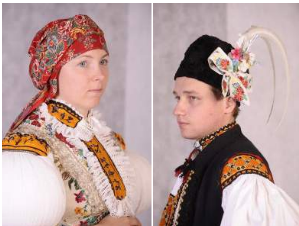
Obr. 49 Slavnostní kroj. Současná podoba kroje. Nedakonice, 2009