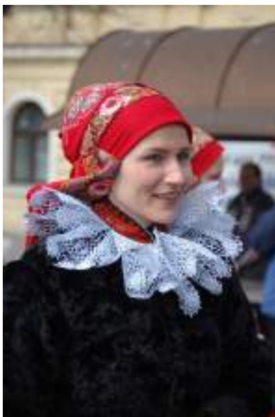
Obr. 208 Mladá žena z Vlčnova v kabátku-kacabajce, s velkým krajkovým límcem. Vlčnov, 2008