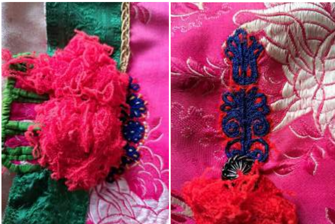
Obr. 103 Detaily zdobení předního a zadního dílu slavnostní kordulky z oblasti Kunovicka