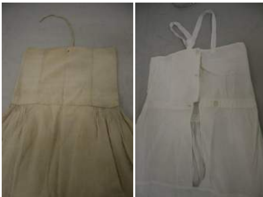
Obr. 137 Spodní košile-rubáč ušitý z konopného a lněného plátna z konce 19. století a košile z bavlněného plátna z 20. století (Ostrožsko)

Základní a nezbytnou součástí ženského slavnostního (ale i všedního lidového oděvu) byla spodní košile, tzv. rubáč . V uherskoostrožském krojovém okrsku nesahal už na konci 19. století pod spodní okraj svrchních sukní a ještě kolem roku 1920 nepoužívaly dívky další spodní sukně, které se rozšířily v polovině dvacátých let 20. století.