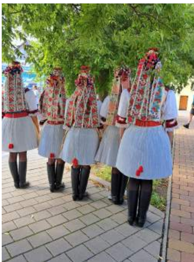
Obr. 94 Družíčky v současné podobě kroje, v obnoveném obřadním pentlení, zezadu. Kunovice, 2024