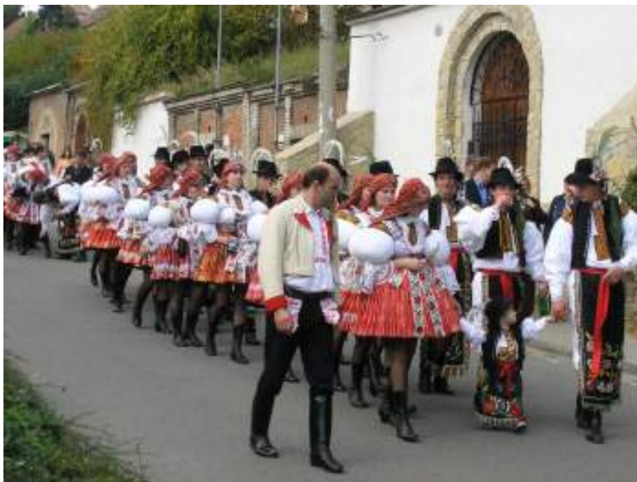
Obr. 22 Současná podoba slavnostních krojů hodové mládeže. Současná podoba kroje. Polešovice, 2005