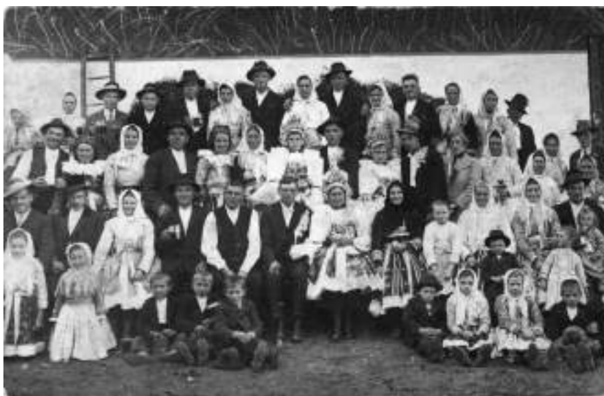
Obr. 191 Slavnostní a obřadní kroje. Ostrožsko. Kolem roku 1920

Vesta bývala po celém obvodu lemována modrou hasavou sutaškou a límec býval podšitý červeným sukem vystřihovaným do zoubků. Pravou stranu přednice zdobí řada mosazných kulatých hustě vedle sebe našitých knoflíčků. Kordula je dnes součástí svátečního, slavnostního a obřadního tradičního oblečení a muži ji nosí jak k soukenným nohavicím, tak k plátěným třaslavicím.