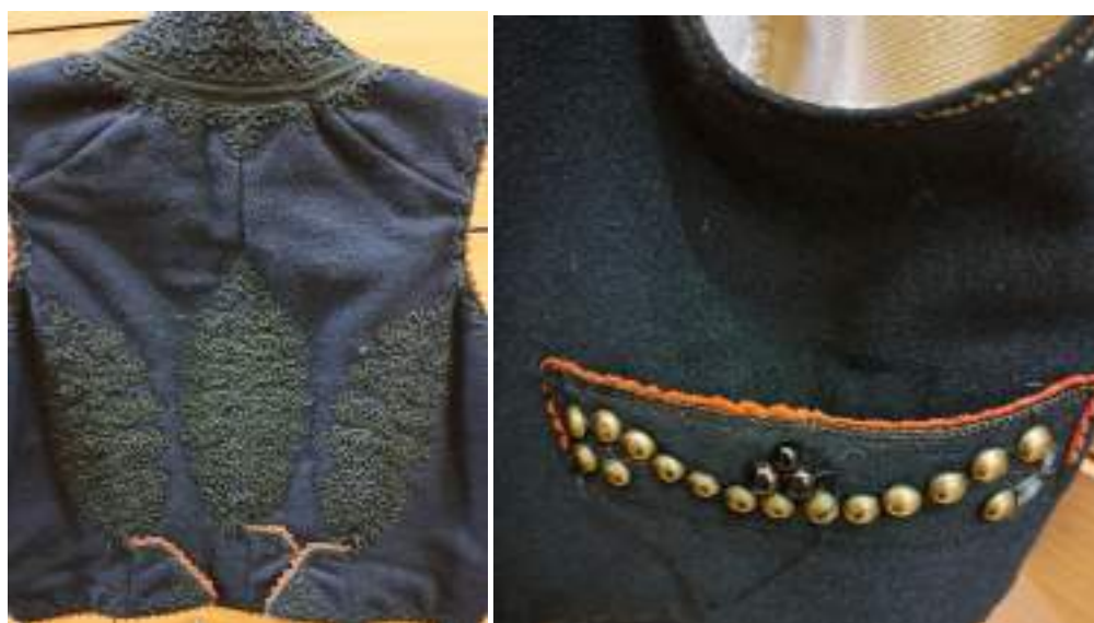
Obr. 76 Detail zdobení mužské vesty – zadní díl, kapsa, Polešovice