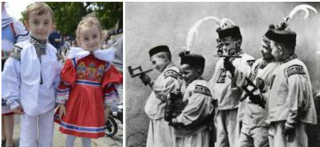
Obr. 199 Zleva: Dětský kroj z Vlčnova, chlapec v košili a třaslavicích a děvče v šatičkách-kanduškách. Vlčnov, 2024

Na hlavě děti nosily bohatě zdobenou čepičku-portovici , šitou ze tří dílů z hedvábného atlasu nebo brokátu. Po ploše byla čepička bohatě posítá stříbrnými patáčky, buliony a portami. Ve věku dvou až tří let začali nosit kluci k šatičkám-tibétce malý klobouček , děvčátka turecký šátek , v chladnějším počasí štrápcový šátek nebo plyšový delínek. K tibétkám se dětem oblékaly silnější punčochy tmavé barvy, k největším svátkům měly děti punčochy bílé a bílé boty. Obouvaly se kožené kotníkové botky na šněrování.