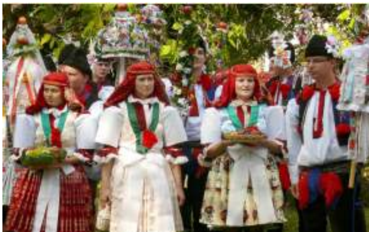
Obr. 97 Současná podoba slavnostního kroje pro mladou chasu o hodech. Kunovicko, 2009