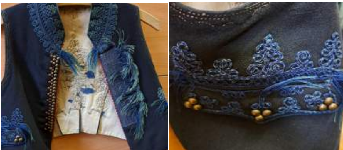
Obr. 77 Detail zdobení mužské vesty – přední díl, kapsa, Jalubí