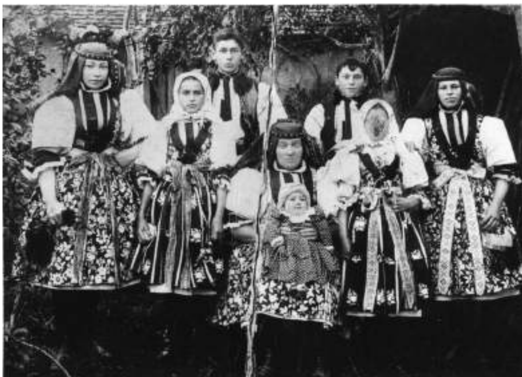
Obr. 95 Matka s dětmi ve slavnostních krojích kunovického okrsku. Kolem roku 1915