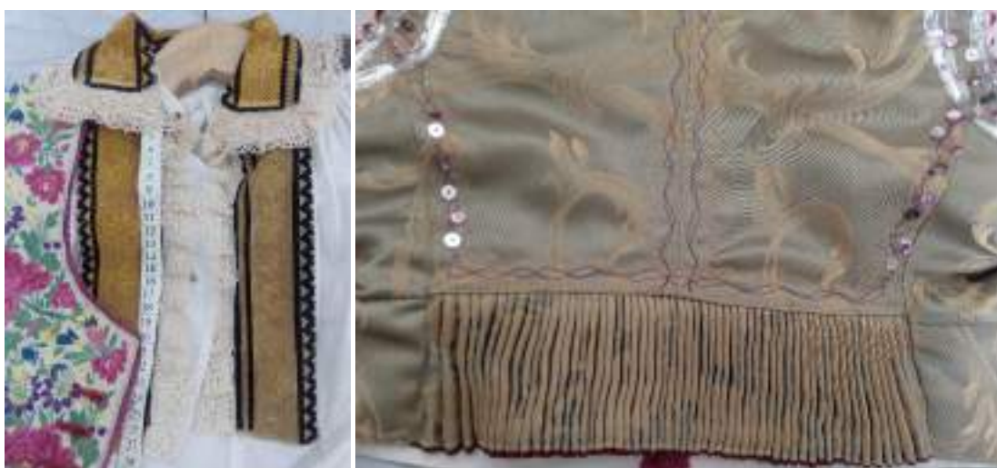
Obr. 85 Ženská vestička/kordulka – přední a zadní díl, Polešovice