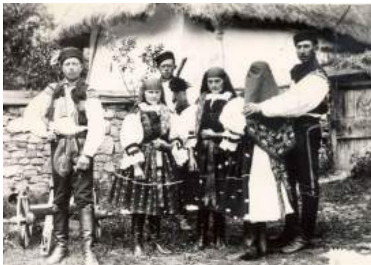
Obr. 216 Vlčnovjané ve svátečním oděvu. Vlčnov, 12891

Turecké šátky se rozšířily téměř po celém Slovácku, vyráběly se ve velkém množství vzorů, v několika rozměrech a v základních barvách červené a černé s výraznou květinovou obrubou, podle jejíhož vzoru dostaly také místní názvy. Turecké šátky, turečáky nebo turčáky, své pojmenování získaly podle výrazné červené barvy nazývané barvíří a obchodníky jako turecká červen, získávané z kořenů mořeny barvířské ( Rubia tinctorum ). Tato bylina má svůj původ v Indii a na Středním východě a pro své barvicí vlastnosti se hojně pěstovala také v Malé Asii a Evropě.