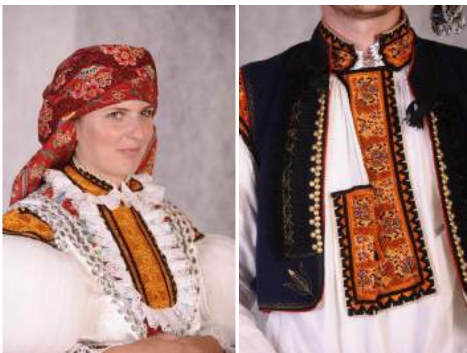
Obr. 53 Slavnostní kroj. Současná podoba kroje. Tupesy, 2009

Kroj Tupesánů řadíme stejně jako zlechovský do hradištského Dolňácka, typu kroje polešovického. Ženský kroj tvoří hustě a jemně vrapené rukávce dnes vyztužené drceným molitanem, na límci, na náramcích a na jedné širší přednici ve výstřihu je zdobí kompletní bubínkové bumbříčkové vyšívání na hrubý výřez. U lokte pod baňatými rukávci jsou přišity široké kadrle zdobené bílou dírkovou výšivkou a na ně je upevňují zdobné podvazadla, mašličky ze slováckých stuh . Zadní glotové sukne šorce nejsou lesklé a mají hrubý vrap, geometrická forma dnes dosahuje výšky až 10 cm. K nejslavnostnějším kordulkám patří bílé brokátové, které nahradily ornátové, v přední části je vystřižena do ostrého, špičatého či hlubokého širokého oblouku. Kolem výstřihu je našita široká květovaná pantla a patinovaná stříbrná portička. Vzadu má kordulka u pasu varhánky, které ovšem zakrývá stuha opasovačka a také cíp tureckého šátku. Přední sukne fěrtoušky jsou šity ze světlých brokátů pastelových barev. Sukně by měla sahat jen mírně za boky, aby vynikla forma na zadní sukni. Šátek mladých děvčat je obvykle posetý jemným rostlinným balouzčkovým motivkem, Dívky nosí černé silonky a třičtvrtěční černé středně vysoké boty na šněrování.