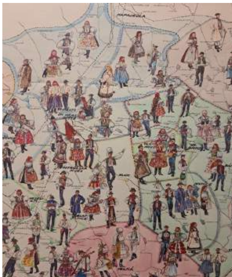
Obr. 46 Mapa Slovácka – detail. Ze sbírek Muzea jihovýchodní Moravy ve Zlíně