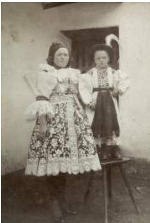
Obr. 130 Matka s chlapcem ve slavnostním kroji – dítě v košili-dudovici s vyščívánou náprsenkou a širokými dudovými rukávy, má kalhoty -třaslavice se zástěrou, v kloboučku s pérkem. Blatnice pod Sv. Ant., kolem roku 1915