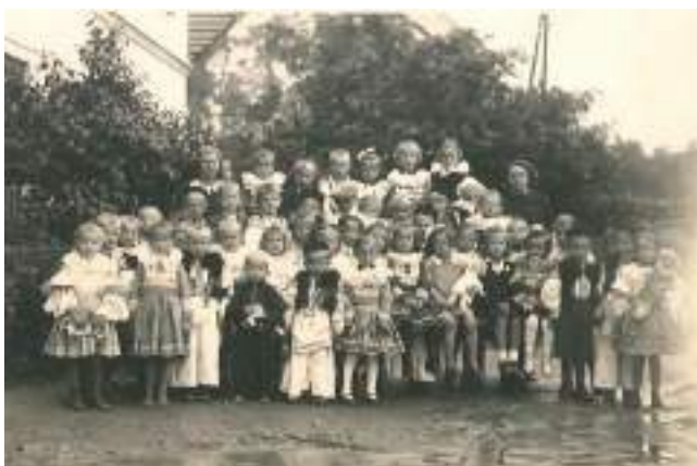
Obr. 196 Pestré sváteční oblečení školních dětí. Vlčnov, první polovina 20. Století

Kojenec byl po narození oblékán do jednoduché košilky s našaseným krejzlem, zavazované za krkem, a zavinulo se do peřinky přepásané povijanem, povijákem. Součástí běžného oblečení byla bílá plátěná čepička nad čelem s kanýrem, vázaná pod krk. Děti se v peřince nosily pevně stažené, aby byly v teple a prosperovaly. Matky při práci nosily miminka v chůvce, loktuši . Byla tvořená pruhem plátna nebo pevnější tkaniny, v níž měla dítě šikmo vpředu na prsou, batolata nosila na zádech, což umožnilo volný pohyb rukou pro práci. Obojí způsob nošení dětí zachytil ve svých dílech také Joža Uprka. Tento způsob nošení zanikal postupně na konci třicátých let 20. století a především ve čtyřicátých letech, kdy se v obci objevily první kočárky. Jako pleny posloužily opotřebované natrhané lůžkoviny.