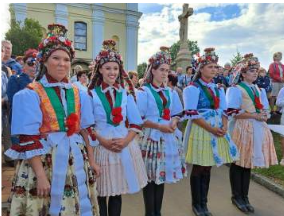
Obr. 93 Družíčky v současné podobě kroje, v obnoveném obřadním pentlení. Kunovice, 2024