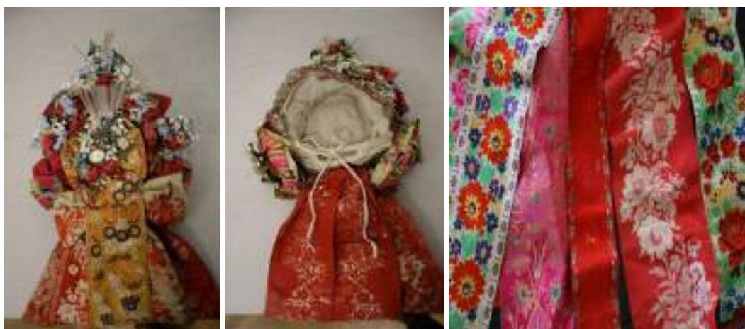
Obr. 175 Obřadní pentlení, obnovované květy, v barevnosti převládá červený odstín tkaných pentlí (původní svatební barva = červená). Ostrožsko, kolem roku 1900. Ukázky barevnosti a vzorů starých stuh-pentlí. Ostrožsko, kolem roku 1900 (fond Slovákkeho muzea v Uh. Hradišti)