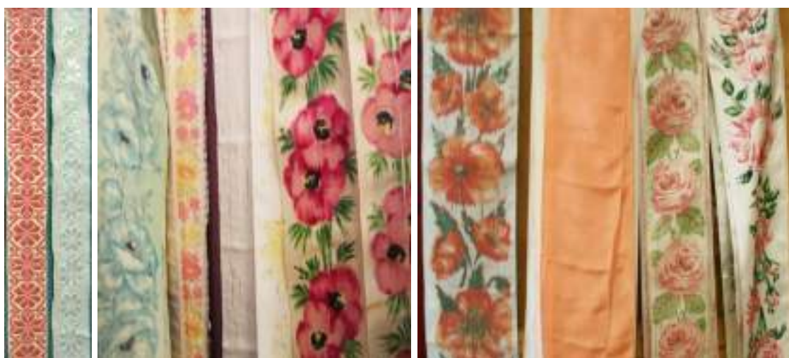
Obr. 156 Typy tkaných stuh-opasovaček do pasu používaných v průběhu 20. století (zleva: geometricky vytkávané povijany, malované saténové stuhy, trháčky vytkávané rostlinným motivem, stuhy hladké i zdobené technikou Chiné á la branche. Průběh 20. století (fond Muzea Blatnice pod Sv. Ant.)

Do pasu si dívky vážou stuhu, tzv. pentli, která byla dříve úzká, v podobě tkaného trháčku, povijanu, zavázaná pouze na jeden suk bez mašle a její okraje splývaly k dolnímu okraji sukně. Rozšířené byly jednobarevné stuhy hedvábné (atlasové, rypsové, taftové), které začaly ženy zdobit vodokresbou, tzv. rozpíjaným květovým motivem, malováním nebo i pestrou naturalistickou plochou výšivkou. Dnes v odívání převažuje méně vhodná široká tzv. slovácká vytkávaná stuha nebo bílá rypsová mašle, která se váže ve středu přední sukně na dvě mašle a konce splývají k dolnímu okraji sukně.