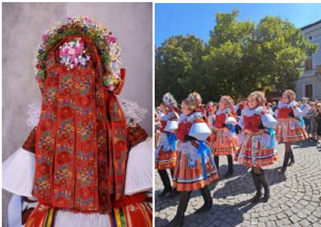
Obr. 218 Vlčnovské dívky v obřadním kroji ve věncích. Vlčnov, 2009 a 2024

Věnec byl určen výhradně svobodným dívkám, nevěstě byl při svatebních zvycích jako znak svobodného stavu, který opouští, snímán a nahrazen šátkem s obálenicí.