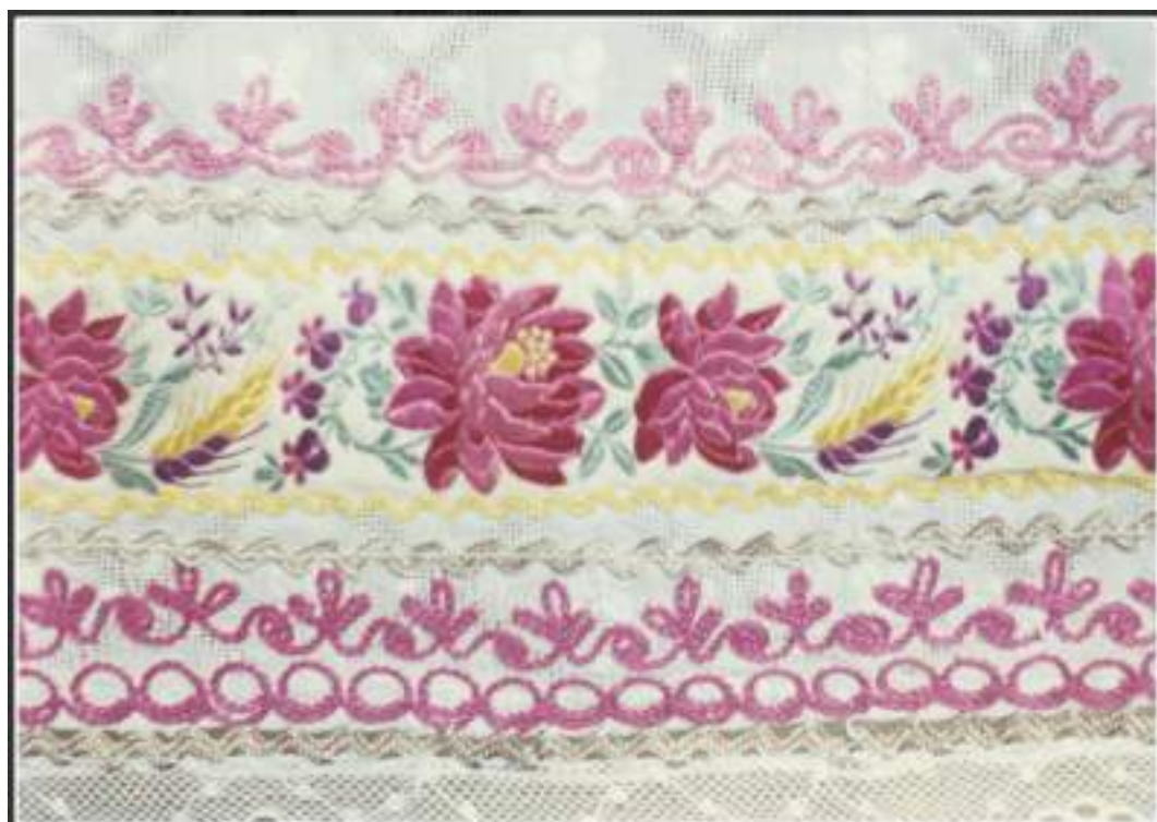
Obr. 10 Detail ženskej svadobnej zástery. Krakovany, 1. tretina 20. storočia