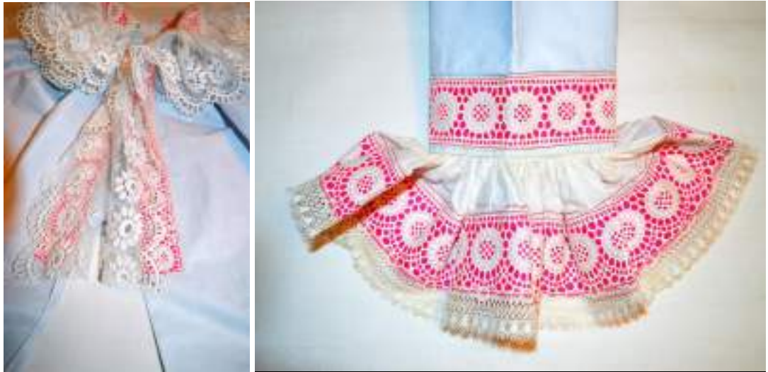
Obr. 99 Detail svátečních rukávců, pohled na podkládaný obojek a přednice zdobené tyranglovou kančíkrajkou, a na zdobení rukávu s kadrlí. Kunovicko, kolem roku 1930 (foto: Romana Habartová)