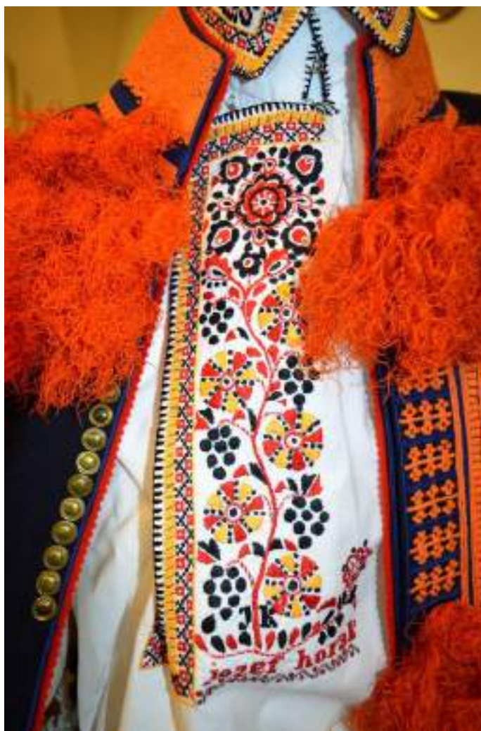
Obr. 181 Slavnostní mužská košile-dudovice. Rekonstrukce uvedené košile výše podle návrhu R. Habartové. Blatnice, 1890. Fond Slovákého muzea v Uh. Hradišti