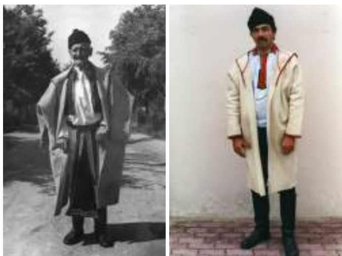
Obr. 118 Mužská halena oblasti Kunovicka, starý muž v plátěných tráslavicích, zástěře a vestě, mladší muž v nohavicích, Kunovice, 20. století

Na území jihovýchodní a střední Moravy se nosily haleny složitějšího stříhu, sešíváné do rozměrné formy kabátu z různých obdélníkových dílců. Sahaly často téměř k zemi, ale v Kunovicích byly kratší; délka také závisela na potřebě ochrany těla před špatnými klimatickými podmínkami. Haleny měly široké rukávy, vzadu rozměrný límec, darmovis, schlopec nebo hazuchu, pokračující na předním dílu do přehnutých, v některých oblastech zdobených přednic, výložek. Límec vývojově souvisí s kapucí a zjevně se z ní vyvinul. V Kunovicích byl límec zkrácený, jednoduchý. 45