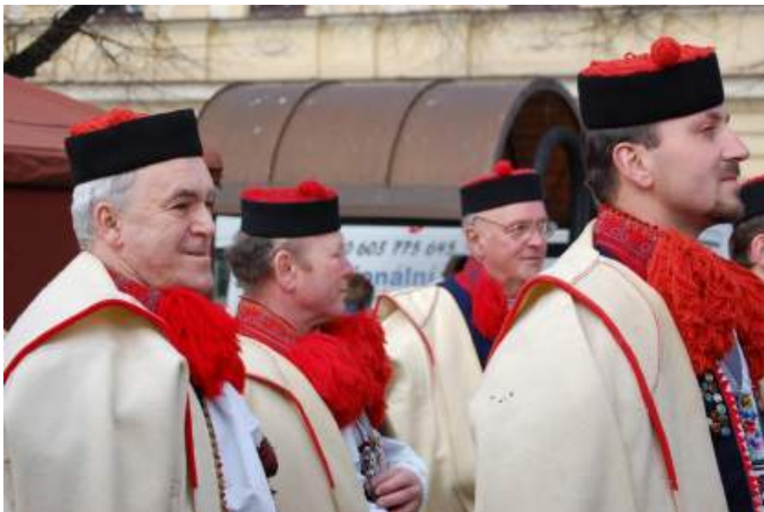
Obr. 225 Starší muži v halenách a v typickém vlčnovském klobouku. 2011

Vonička s kosárky byla vždy znakem legrůtů, vojenských odvedenců, a její nošení na klobouku bylo citlivě vnímáno – kdo nebyl odveden, kosárky jako symbol mužné síly si na klobouk nesměl dát. Klobouk se nosil jako nedílná součást kroje a smekal se pouze v kostele, jinde v místnosti zůstával na hlavě. V chladnějším počasí se místo klobouku nosila beranice z černé beránčiny nebo plyše. Starší muži nosili ještě ve třicátých letech 20. století beranici v dolní části s ohnutým lemem, jako bylo běžné v Kunovicích.