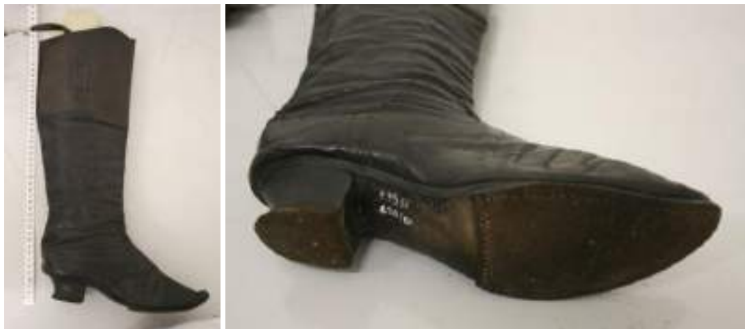
Obr. 178 Ženská krojová obuv vysokého typu se špičatou tupou špičkou, původně se sklady v nártní části boty, projmutí tvar podpatku u paty vytváří elegantní dojem tvaru obuvi. Ostrožsko, kolem roku 1880