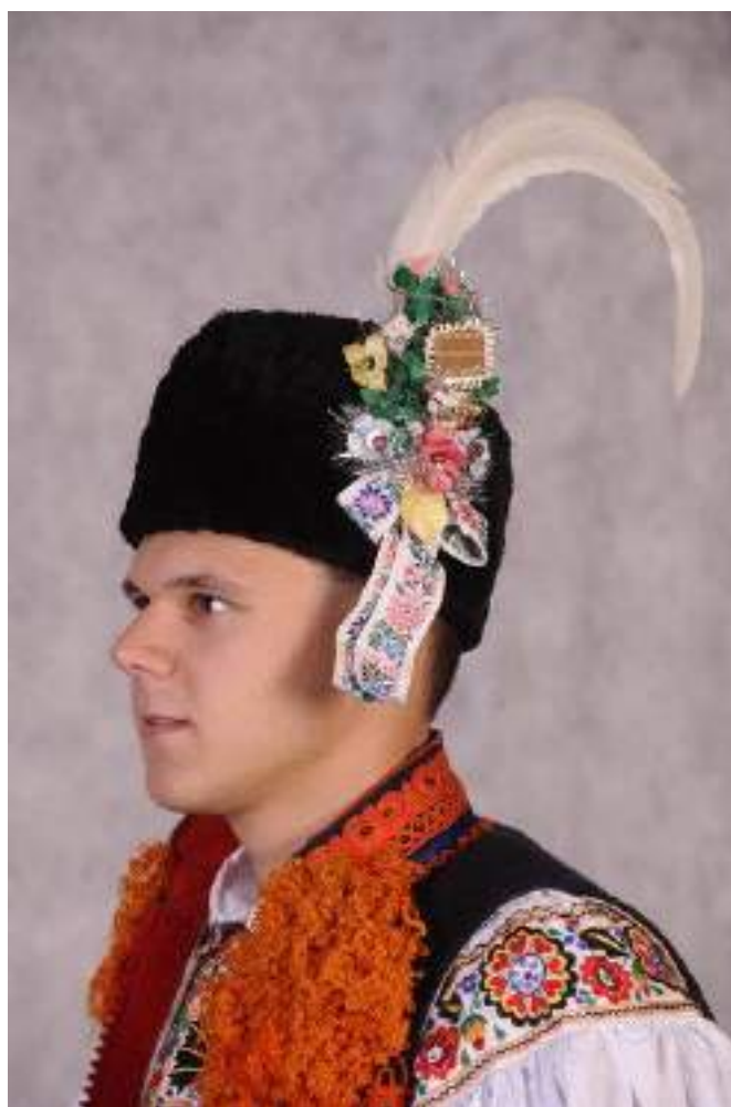
Obr. 193 Mladý muži ve slavnostním kroji – v korduli a beranici-astrigánce. Ostrožsko. Hluk, 2009