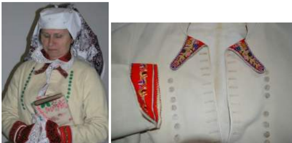
Obr. 104 Starší žena v obnovené sváteční podobě kroje Kunovicka, v zimním lajblu a lipském šátku uvázaném na rožky, detail výšivky. Kunovice, 2015

Tento typ kabátku na začátku 20. století nahradily sametové kabaně a později i teplejší plyšové kacabajky.