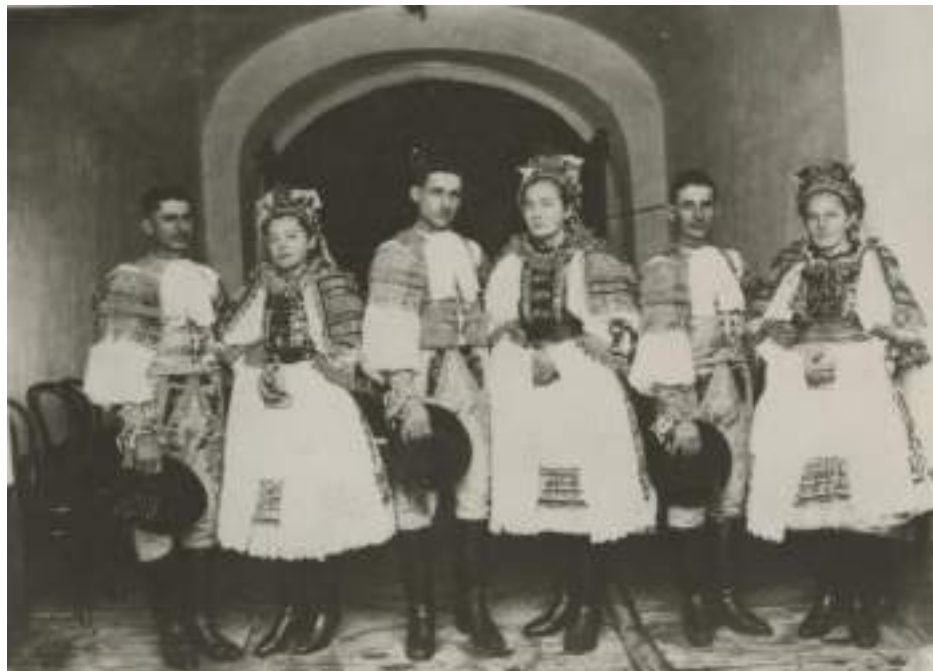
Obr. 9 Tri svadobné páry. Krakovany, 1. tretina 20. storočia

partu, ktorá sa skladala z kartónovej členky obšitej červenou látkou , z korunky (s tromi „ružami“ vyšitými farebnými sklenenými perličkami, flitrami a sklíčkami) a z bielych a žltých stúh, ktoré viseli dolu chrbtom. Výzdoba party bola doplnená našitými skladanými stužkami, farebnými sklenenými perličkami, flitrami a sklíčkami. Parta sa na sobáš požíciavala od ženy, ktorá mladuchu do party aj zapletala.