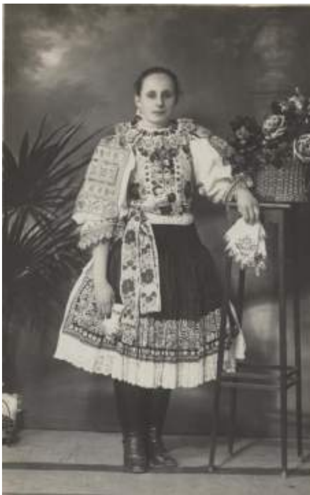
Obr. 8 Sviatočný dievocký odev. Krakovany, 2. tretina 20. storočia (súkromná zbierka Daniely Piscovej)