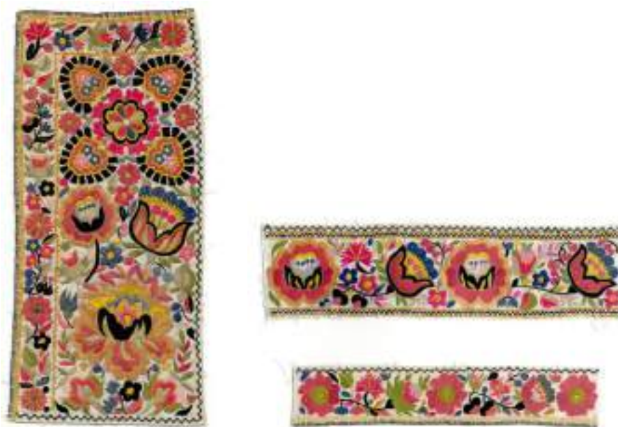
Obr. 182 Přednice, část nárameníku a obojku mužské košile-dudovice, výšivka provedená plochým stehem lesklými lacetkami. Blatnice, 1930. Fond Muzea Blatnice pod Sv. Ant (soukromý archiv)

Dalším druhem mužské košile je červenice , nošená k méně slavnostním chvílím i na všední den. Má stejný střih jako dudovice , ale s menším řasením v rukávech.