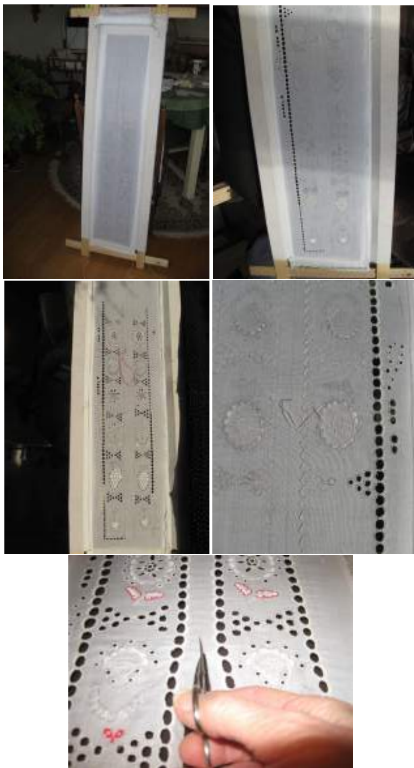
Obr. 89 Postup práce, bílá dírková výšivka, tráčky na zadní bílou sukni-fěrtoch