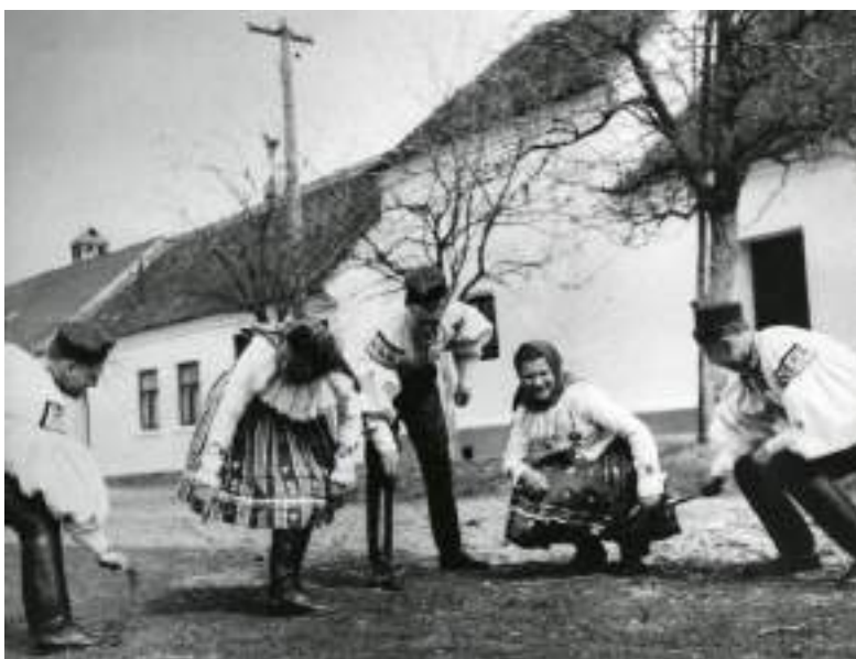
Obr. 209 Mládež ve svátečním kroji z Vlčnova, chlapi v košili, kalhotách z manšestru a kloboučku, dívky v jupce, štófce a šátku na babušu. Vlčnov, 1945-1946

Své místo mají v šatníku žen kabátky-jupky, které se po roce 1900 oblékaly místo rukávců všednímu a pracovnímu lidovému oděvu. Byly ušité z různých materiálů (plátěné tisky, barchety, tibéty, flanely), pro chladnější čas ze sametu nebo plyše. Po roce 1930 se objevily jupky z dražších materiálů, ze saténu, brokátu. Byly už zdobené strojovou výšivkou i aplikací kraje a stužek, tzv. parád, které se našivaly v lichém počtu, od jedné do pěti. Pětiparádové jupky sloužily k polosvátečnímu oděvu. Vdané ženy je nosily na menší svátek, protože byly pohodlnější než rukávce. Zdobily motivem macešek nebo šípových růží. K vyšívaným a zejména pětiparádovým jupkám se oblékal i obojek a turecký nebo stápcový šátek. Až ve čtyřicátých letech 20. století začaly ženy nosit třeba ve všední dny do kostela šaty – set jupky a fěrtušku ze stejné látky.