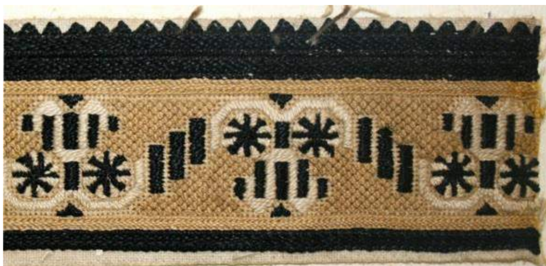
Obr. 164 Výřezová výšivka ženského nárameníku s motivem „na kalich a cestu“ (na kola a cestu, na tragač a cestu). Kalich se skládá ze dvou koleček a tulipánu. Kontrastní dvoubarevná výřezová výšivka doplněná v detailech neutrální bílou (krémovou) barvou. Velikost výšivky je 190 x 50mm. Blatnička, kolem roku 1870 (fond Slovákého muzea v Uh. Hradišti)