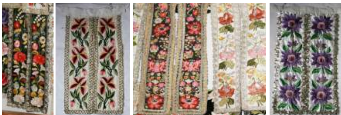
Obr. 151 Vývojová řada zadních stuh na zadní černou sukni šorec (fond Muzea Blatnice pod Sv. Ant., 20. století)