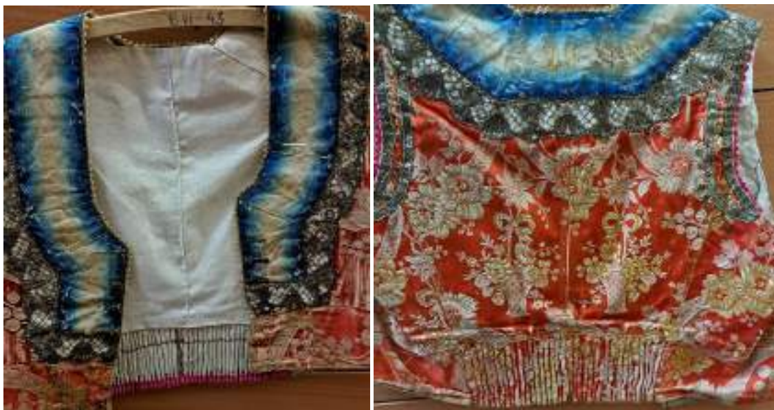
Obr. 82 Ženská vestička/kordulka – přední a zadní díl, Uh. Hradiště