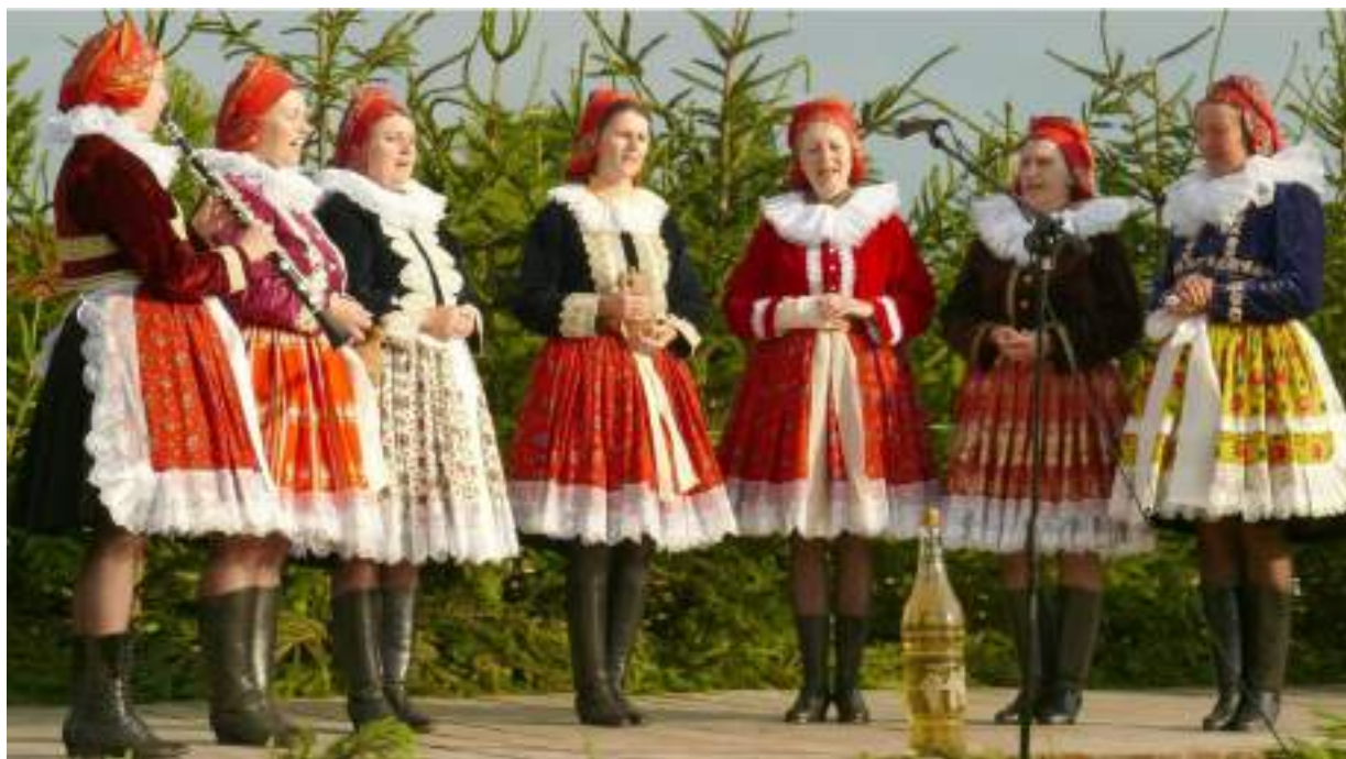
Obr. 155 Současná podoba ženského svátečního kroje s viditelnou pestrostí předních sukní s kaničkami. Ostrožsko, 2009