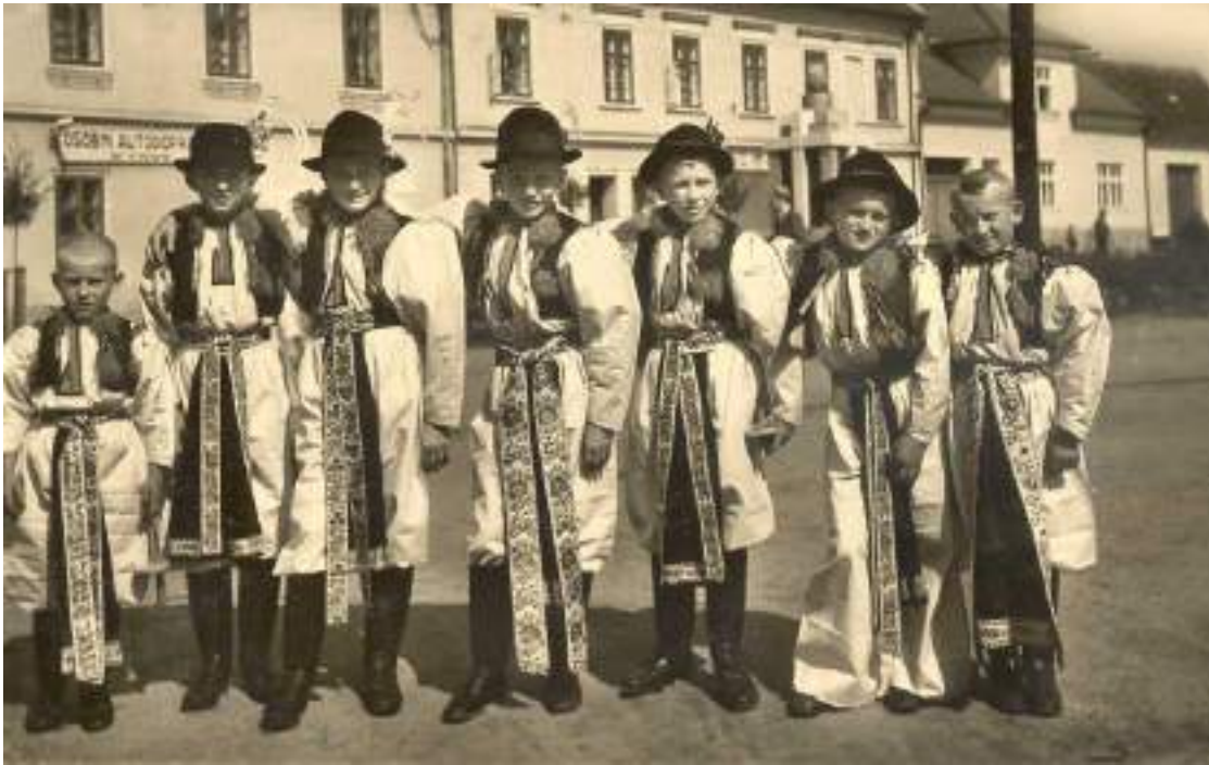
Obr. 96 Chlapci ve svátečním kroji s klobouky na hlavách. Kunovice, polovina 20. století