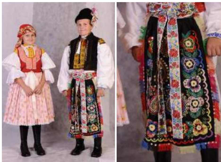
Obr. 59 Slavnostní kroj dětí a hodové mládeže. Současná podoba kroje. Velehrad, 2009