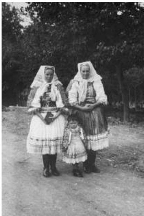
Obr. 12 Ženský sviatočný odev - staršia žena, mladá žena a dieťa. Krakovany, 1. tretina 20. storočia