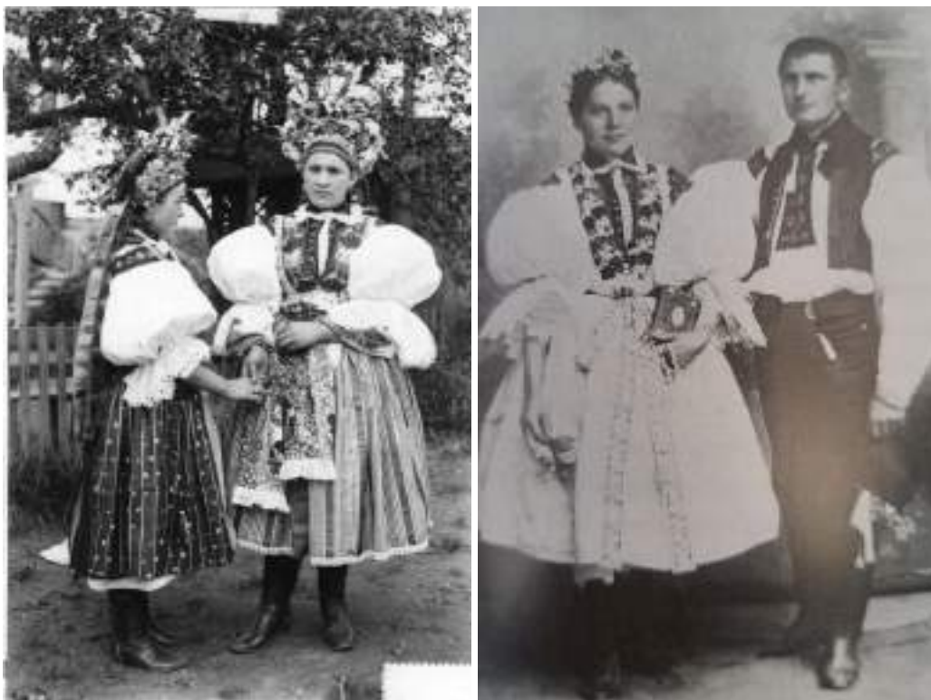
Obr. 44 Družičky v obřadním kroji, Mařatice, kolem roku 1890 a novomanželé v obřadním kroji, Staré Město, 1905

c) staroměstsko-jarošovský kroj je typický pro Staré Město, Mařatice, Jarošov,