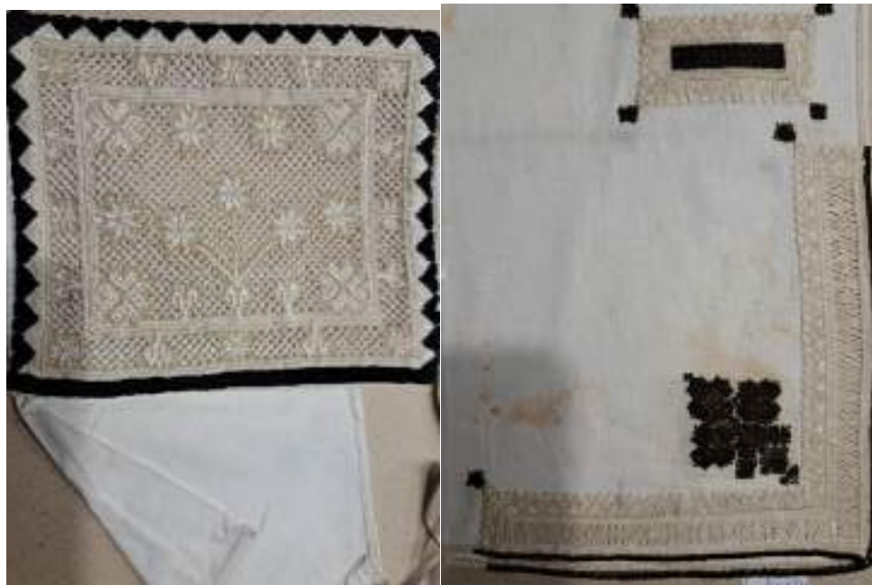
Obr. 110 Čepce se starobylým vyšitým děnkem a šatka s výřezovou výšivkou. Kunovice, kolem roku 1830. Fond Slovákčého muzea v Uh. Hradišti