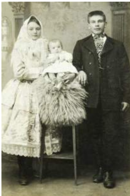
Obr. 132 Mladá rodina ve svátečním kroji, muž v selském kabátě, matka v jupce a třásňovém šátku, kojeneček v plátěné košilce. Ostrožsko, kolem roku 1920 (soukromý archiv)