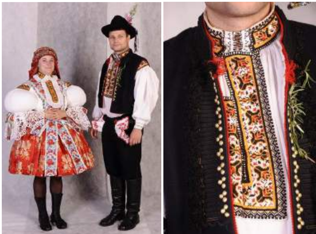
Obr. 54 Slavnostní kroj. Současná podoba kroje. Újezdec u Osvětiman, 2009

Malá obec Újezdec u Osvětiman se snaží uchovávat svůj tradiční kroj. Cílem občanů je pořídit pro obec kroje a krojové součásti, aby se bez větších problémů mohli účastnit slavností v obci i mimo ni. Především k hodkám o svátku Petra a Pavla se oblékají do krojů nejen dospělí a mládež, ale i děti.