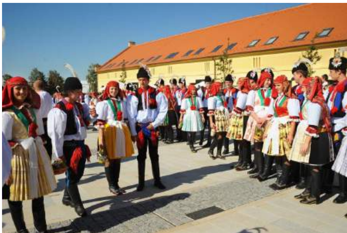
Obr. 25 Slavnostní varianta kroje z Kunovicka oblékaná pro příležitost Slovákých hodů s právem. Současná podoba kroje. Kunovice, 2011