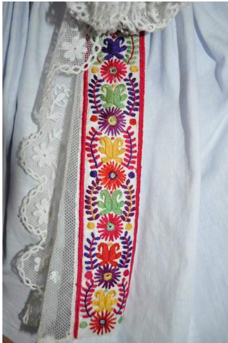
Obr. 100 Detail polosvátečních rukávců, pohled na jednoduše vyšivanou přednici s krajkou. Kunovicko, kolem roku 1950