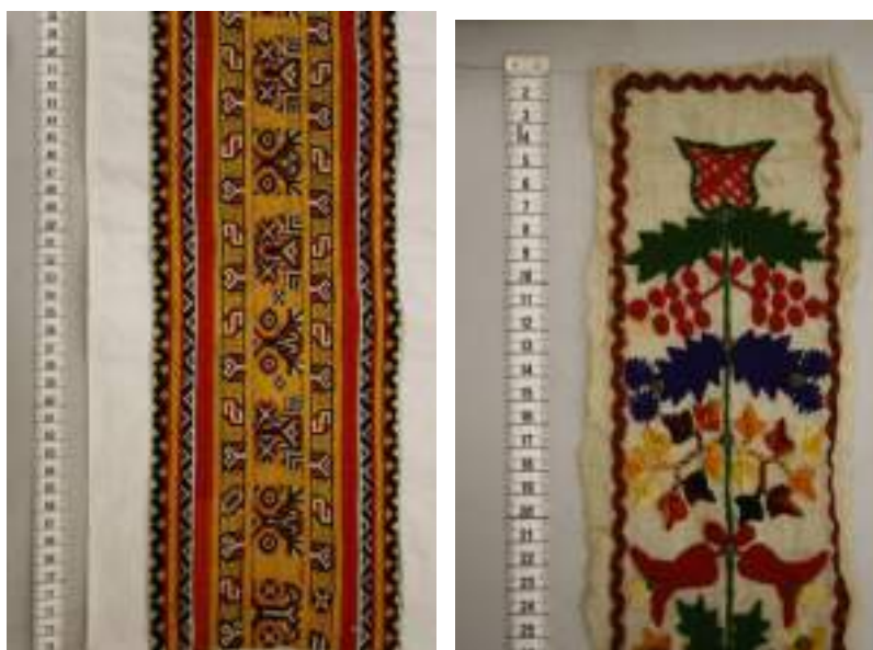
Obr. 171 Zleva: Střed úvodní plachty s geometrickou výřezovou výšivkou. Blatnice, kolem roku 1890. Fond Slovákého muzea v Uh. Hradišti

Úvodnice z první třetiny 20. století měly středy plachet zdobené rostlinným motivem - výšivkou provedenou barevnou vlnou na etamínu. Tato výšivka byla po stranách lemována pásy geometrické mozaikové výšivky, širokými cca 5 cm, provedené původně hedvábím, později vlnou nebo chemlonem.