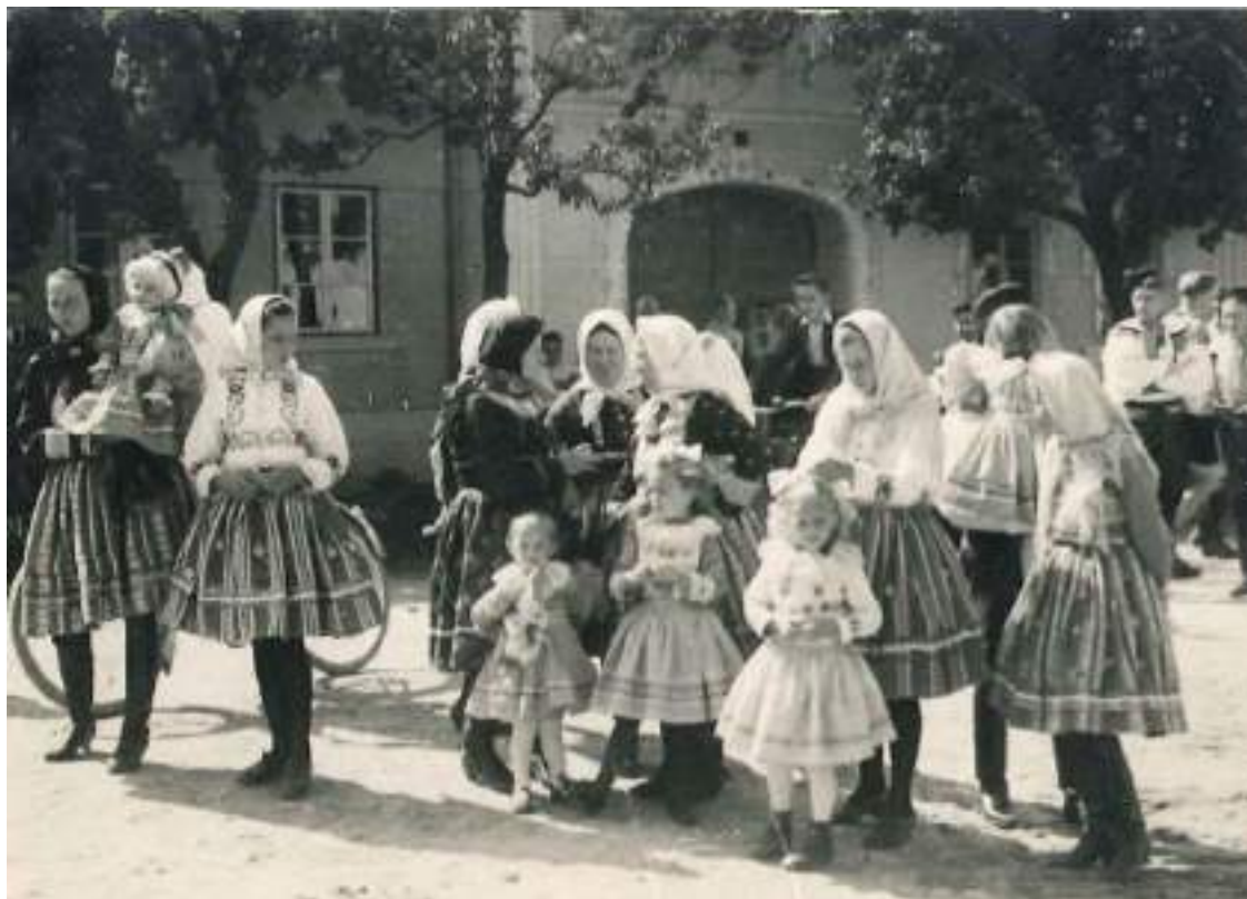
Obr. 212 Ženy a dívky z Vlčnova v jupkách a předních sukních s našitými pentličkami. Vlčnov. Kolem roku 1930

Původně se fěrtůšky šily ze dvou půlek a při uvázání zakrývaly o něco více než polovinu obvodu postavy. Stejně úzký, zpravidla užší byl fěrtoch, proto se při chůzi na bocích mezi oběma sukněmi objevovala spodní košile. Jak nabíral fěrtůšek další množství látky, rozšiřoval se stále víc za boky. Kartúnové fěrtůšky se šily ještě ze dvou, ale i tří půlek, atlasky a tiběty i štófy už ze čtyř půlek a fěrtůšky šité ve třicátých letech 20. století a zejména po roce 1945 i z pěti až šesti částí.