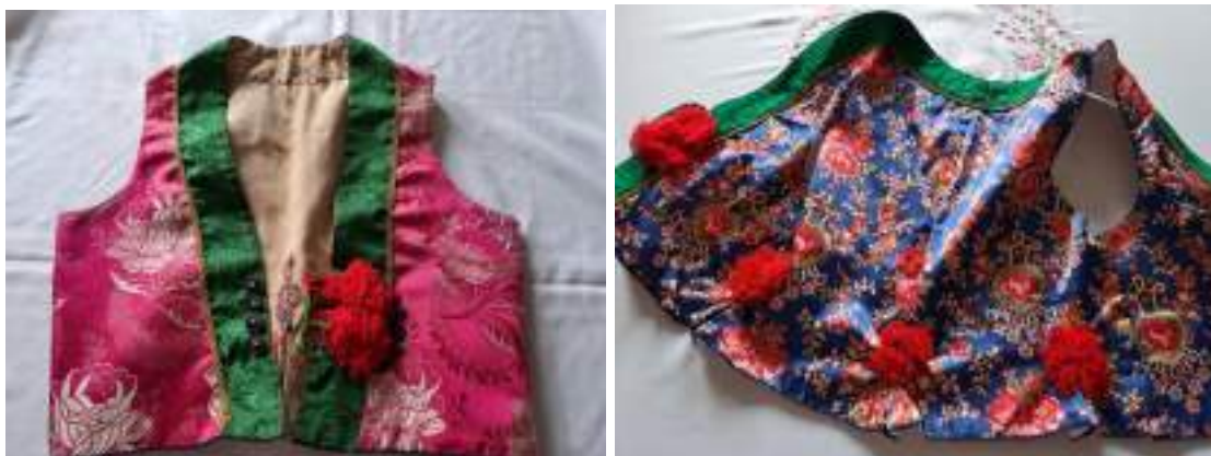
Obr. 102 Současná podoba slavnostní dívčí a ženské kordulky Kunovicka z brokátu, atlasu

Ženská kordula sahala vždy až k pasu, vpředu nad pasem se zapíná na jeden knoflík. Zádový díl zdobí uprostřed malý vyšívaný tulipán, po stranách čtverlístky, na pravé přednici je kapsička s ornamentální výzdobou nad ní, na levé přednici je vyšita léga i plocha vedle ní úzkými šňůrečkami. Výzdobu doplňují červené kytky z kamrholu. Obojek, jaký je na lajblu i mužské kordule, u ženské korduly schází.