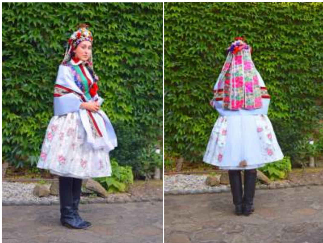
Obr. 109 Rekonstrukce obřadního kroje kolem roku 1925 pro nevěstu a družičky podle návrhu R. Habartové. Kunovicko, 2018

Plachetku oblékaly ženy jako přehoz přes bedra. Odtud se vine kolem rukávů v nadloktí, v loktu se trochu zřasí a oba konce splývají volně dolů po fěrtůšku tak, aby se spodní okraj plachetky kryl se spodním okrajem fěrtůšku. Přechnívají-li konce plachetky, nadnese ji žena v ruku. Oba konce splývají po fěrtůšku, aby bylo dobře vidět sítko. Bylo zvykem, že dívka či žena oděná plachetkou nemá rukávy rukávů vykasané v nadloktí, ale shrnuté dolů k pěstím, které jsou takto půvabně lemovány vyšívanými kadrlemi a síkornovými (později nazývané síkorové) kaničkami (kraječky).