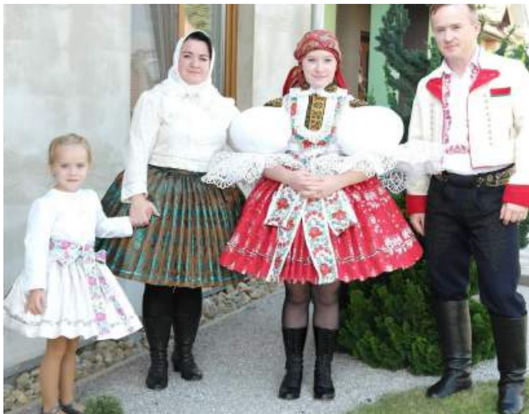
Obr. 50 Rodina ve slavnostním a svátečním kroji. Kostelany, 2015