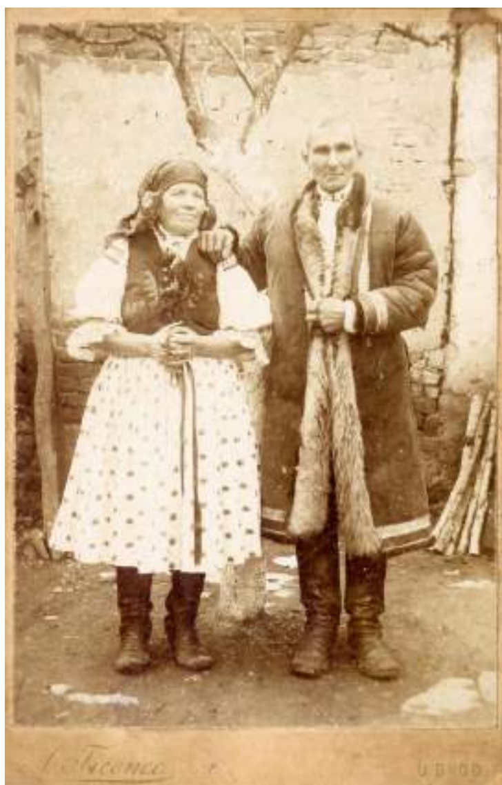
Obr. 217 Starý pár v starobylé podobě vlčnovského kroje, muž v kožichu, žena v soukenné vestě bez příkras a volných rukávcích. Vlčnov, začátek 20. století

Ženy obouvaly ke kroji čičmy , které si ve Vlčnově zachovaly původní tvar i střih a jsou šité starým způsobem na jedno kopyto. Když si žena nebo dívka přinesla nové boty, nebylo poznat, která je pravá a která levá. Boty, vpředu tvarované do výrazné špičky, se naformovaly až při nošení. Žlutě lemovaná podrážka i boční švy jsou charakteristickou ozdobou, stejně jako tvrdá pata zdobená vybíjením mosaznými hřebíčky a vrapení na nártu. Nová bota šitá z kordovánu, dovážené jemné kůže se zrnitým povrchem, měla až třináct vrapů a přední část holínky i nárt byly šité z jednoho kusu. Když se bota obnosila, mohl ji obuvník okaplovat, tedy vyměnit celou část nártu a přišít nastavený kus až k vrapení. Při šití se do podrážek vkládaly kousky kůže, které při chůzi vrzaly. Čičmy se nosily do kostela a ke svátečnímu kroji, ve všední den se v chladnějším počasí obouvaly obnošené boty, na dotrhání a v zimě ženy obouvaly od třicátých let 20. století filcové knoflíčkové papuče. 81