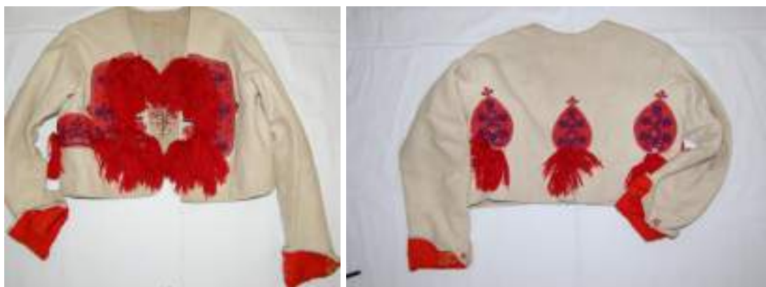
Obr. 205 Ženský soukenný lajbl z Vlčnova, přední a zadní díl. První polovina 20. století. Fond Slovákého muzea v Uh.Hradišti