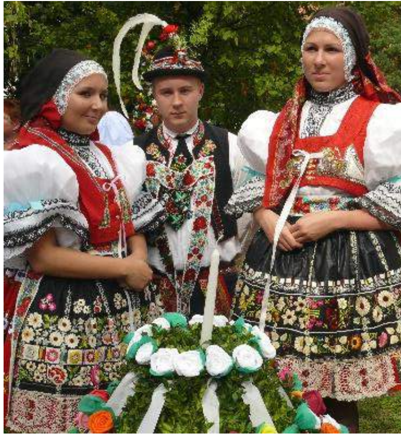
Obr. 57 Současná podoba slavnostního kroje v obci Osvětimany, odklon od Hradištska, dnes se tu nosí severokyjovský kroj. Osvětimany, 2009