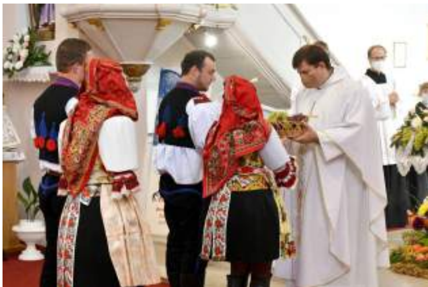
Obr. 101 Současná podoba slavnostního kroje k hodové tradici - pohled za zadní sukňě-šorce s navázanými mašlemi-tráčky. Kunovice, 2021

Některé kunovické parádnice si na černých pentlích vyšívaly a vyšívají rozmanité rostlinné vzory s velkými růžemi křiklavých barev. Spodní okraje tráček bývají zdobeny bílými nebo žlutými, stříbrnými, zlatými kovovými portami, třásněmi i patáčky. Sukně přední – fěrtůšek a trháčky (stuhy do pasu) Přední sukně, fěrtůšek, byla odedávna v Kunovicích užší než všude jinde. Byla vždy šitá ze tří částí a jen lehce překrývala boky ženy, aby vynikla pracnost a harmonie zadního fěrtochu nebo šorce. Pamětnice a znalkyně krojů říkají, že „kunovský fěrtůšek je poměrně úzký, když si ho žena opáše, sahá svými postranními kraji ke kyčlím, řečené po kunovsku na klúby. Nepřekrývá značnou část šorce, jak je tomu hned u sousedního kroje staroměstského“. 26