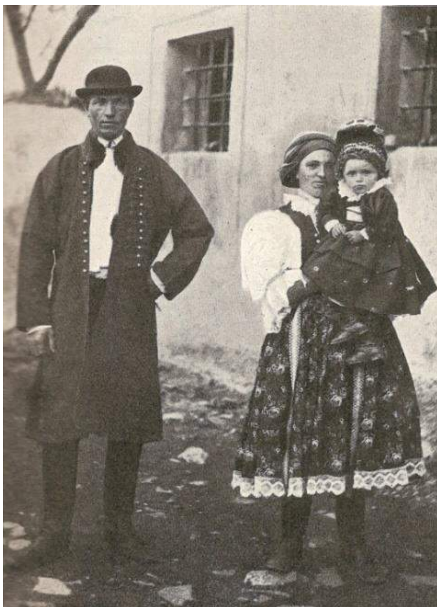
Obr. 194 Mladá rodina ve slavnostních krojích, muž v honosném kabátě-mentýku, žena v úvazu šátku „na zaušnice hore konce“, volné rukávce, dítě v kandaších s čepičkou-frčou .Ostrožsko – Blatnice pod Sv. Ant., 1892

K obřadnímu oděvu řadíme rovněž oblečení odvedenců. Vedle standardně užívaných oděvních součástí, kterými byly třaslavice s modrou nebo černou klotovou zástěrou, zdobenou pouze obsmykováním nebo u dolního okraje s kretonovým vzorem, si rekruti na bílou plátěnou košili s méně řasenými rukávy s pestře vyšívanou náprsenkou oblékali selská saka či soukenné kabáty a na hlavu si dávali klobouky s vyšší stříškou, které byly po celé ploše vysoko vyzdobené umělým, tzv. krámským kvítím se sklíčky, zrcátky, buliony a pavími pery. Z krempe až do pasu splývalo množství hedvábných stuh s vetkaným květinovým motivem.