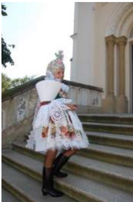
Obr. 136 Současná podoba obřadního kroje Ostrožska s honosnou přední sukní s brokátu, vytkávaném kovovými nitěmi, dívka-družička má na hlavě obřadní pentlení. Ostrožsko, 2010