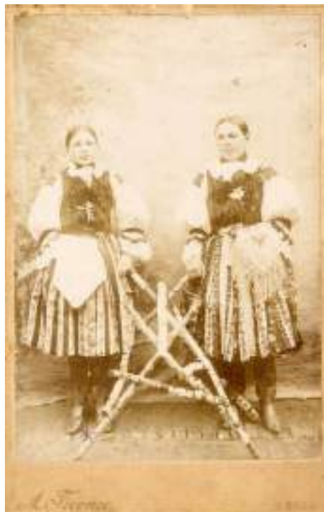
Obr. 210 Mladé ženy z Vlčnova v soukenné kordulce s málo rozvinutým třepením-kytami a v rukávcích s malými volnými baňkami. Vlčnov, začátek 20. století