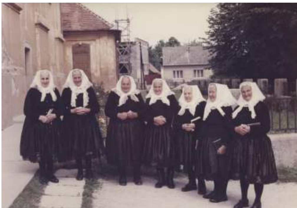
Obr. 15 Smútočný odev a odev starších žien. Krakovany, 2. polovica 20. storočia

Smútočný odev mladých žien a dievok bol v rovnakých farbách ako sviatočný odev starších žien. Výšiviek bolo menej a niesli sa v modrých a fialových tónoch, ktoré boli považované za smútočné. Smútočný odev starších žien sa skladal z bielych vyšívajúcich skosových rukávco, bieleho lajblíka bez zdobenia. Zástery boli veľmi málo zdobené. Vyšívane boli modrou alebo zelenou farbou a olemované čiernou čipkou. Stuha v páse bola čiernej farby. Na bielom čepci sa nosil biely ručník s bielou výšivkou.