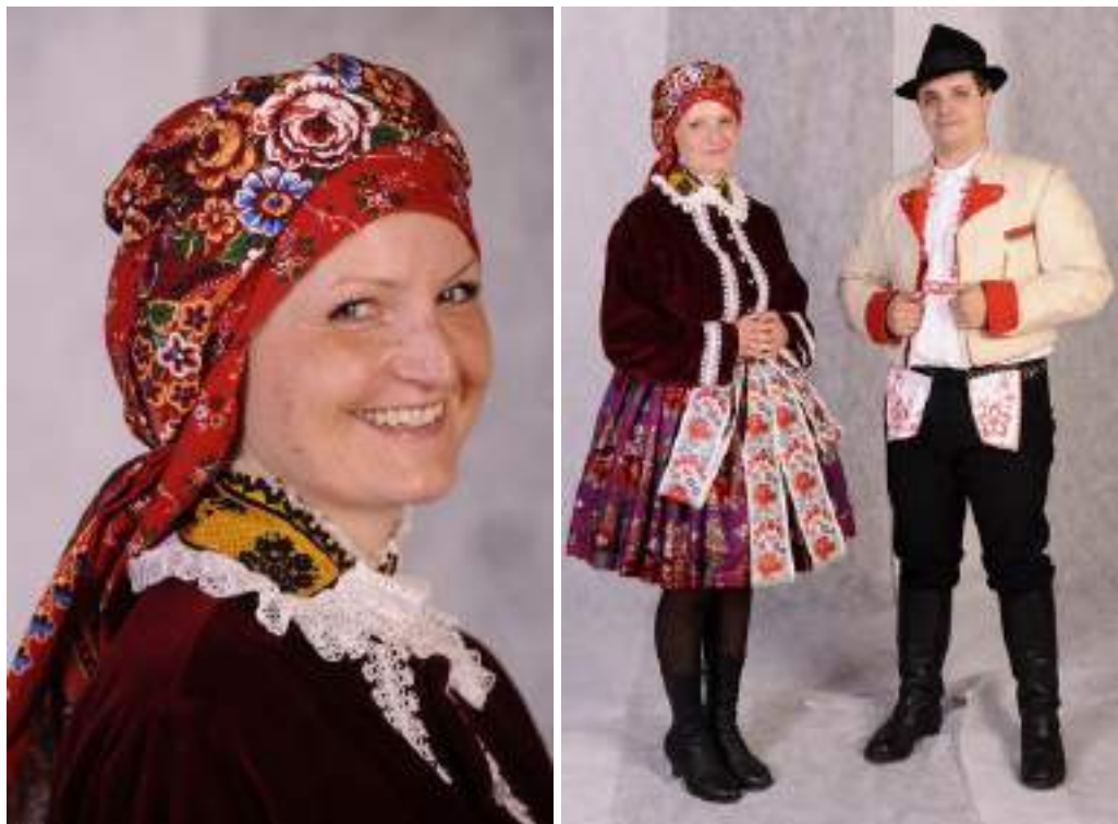
Obr. 48 Slavnostní kroj. Současná podoba kroje. Nedakonice, 2009