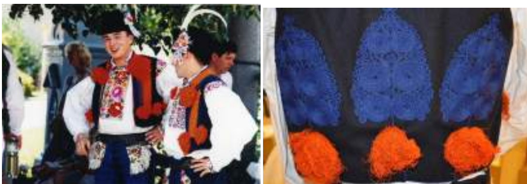
Obr. 188 Zleva: Mladí muži ve slavnostním kroji z Ostrožska. Hluk, 1999. Fond Slovákckého muzea v Uh. Hradišti (foto: L. Chvalkovský)