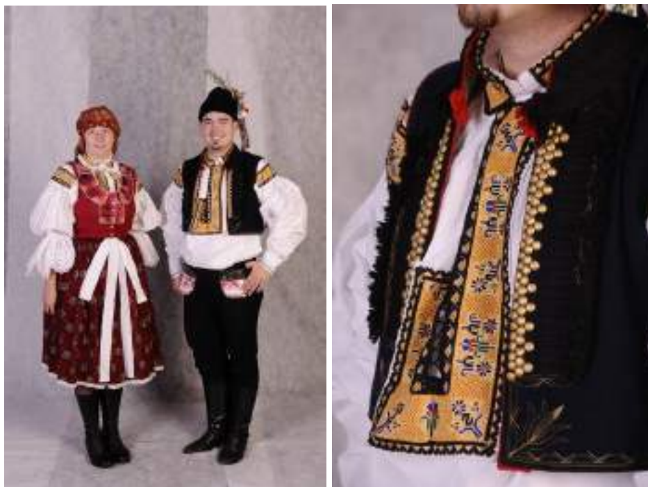
Obr. 58 Slavnostní kroj. Současná podoba kroje. Velehrad, 2009