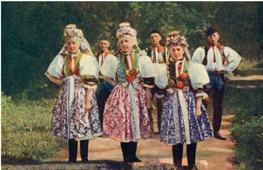
Obr. 24 Nevěsta a družice v obřadních krojích a ve věncích. Z Památníku mor. Slovácka. Pohlednice. Autochrom F. Sukaného v Uherském Hradišti. Kunovice, kolem roku 1910