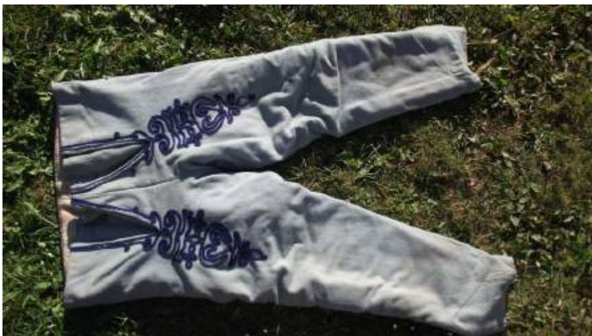
Obr. 16 Nohavice. Krakovany. 1. tretina 20. storočia

Zimný variant sviatočného odevu pre mládencov a mladých mužov na začiatku 20. storočia pozostával z košele z bavlneného plátna so žltou výšivkou. Nohavice a vesta – prucl boli robené z bledomodrého súkna. Vesta bola zdobená tmavomodrou našitou šnúrkou – šujtášom . Výzdoba sa sústreďovala na okraje vesty a na chrbát, nad zošitím bočných dielov. Na predných dieloch boli okrem šujtášu ozdoby robené aj trukovaním a použité boli aj ozdobné gombíky. Takáto vesta bola vždy podšitá. Nohavice sa šili z rovnakého tenkého svetlomodreho súkna ako vesta. Podšité boli bielym hrubším barchetom. Výzdoba na nohaviciach sa sústredila okolo predného rázporku, až po stehnách a na bokoch nohavíc. Zdobenie bolo robené tmavomodrou šujtáškou . Podľa rozsahu výzdoby boli nohavice určené pre mládenca či mladého muža. Starší muži mali výzdobu jednoduchšiu. Taktiež košele boli vyšívane iba bielou farbou. Do rázporku si mládenci na slávnostné príležitosti vkladali často červený ručník. Na nohách sa nosili vyššie čižmy s tvrdou sárou, ktoré siahali ku kolenám. Na hlave nosili čierny klobúk, v chladných mesiacoch súkennú čiapku s kystkou na dienu.