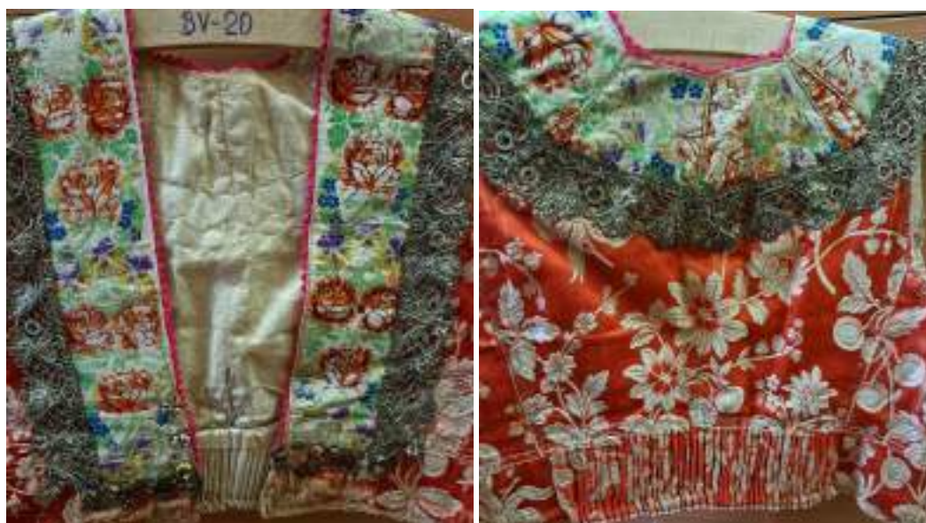
Obr. 79 Ženská vestička/kordulka – přední a zadní díl, Staré Město