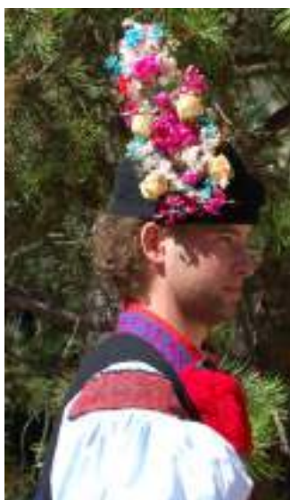
Obr. 119 Mužská pokrývka hlavy beranice-astrigánka s obřadní ženichovskou vonicí (Kunovicko, 2013)

Beranice na hlavě vypadá, jako by byla uprostřed přerušena. Bývala zhotovována z kožešin mladých, dokonce nedonošených černých tureckých jehnat, vlnky na ní musely být v minulosti co nejjemnější. Podšívka bývala z bílé ovčí kožešinky, nakrátko sestřižené. Její okraj byl lemován asi tři centimetry širokým páskem červeného sukénka. Před nepříznivým počasím se chránila tím, že se obracela bílou podšívkou ven. Současné beranice se nosí nejen v zimě, ale i v létě, a to k parádnímu, tedy slavnostnímu i obřadnímu oblečení. Ženich a družbové o svatbě nosí astrigánky ozdobené mimořádně velkými vonicemi z umělých květín, mládenci na levé straně, ženich vždy na pravé.