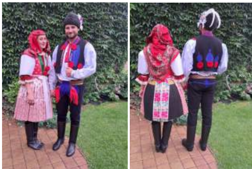
Obr. 117 Současná podoba slavnostního kroje Kunovicka. Kunovice, 2025

Vesta z Kunovicka je kratší, aby vynikla košile mezi okrajem korduly a pasem nohavic, který je obtočen opaskem. Vyšívání a trásně jsou z červeného kamrholu, je velmi střídmé ve srovnání s červenými trsovými kytkami na kordulách vlčnovských, hradčovických nebo oranžových a velmi kadeřavých na Ostrožsku.