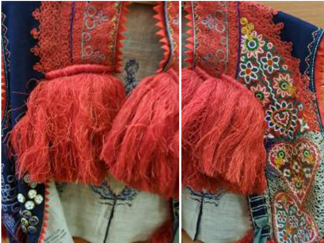
Obr. 222 Mužská vesta z Vlčnova – přednice levá a pravá strana s cifrovanou výšivkou. Fond Slovákého muzea v Uh. Hradišti