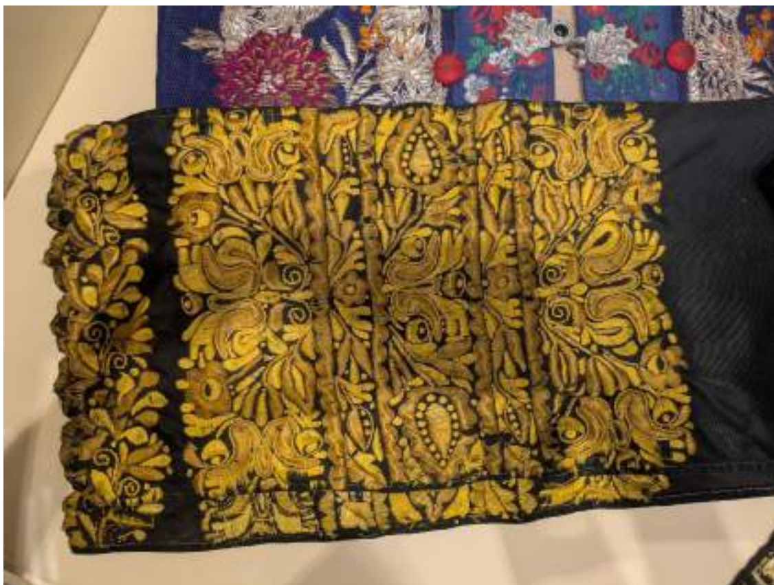
Obr. 2 Konce opasovačky, 1. štvrtina 20. storočia

Do 1. svetovej vojny sa ku sviatočnému odevu nosila tzv. opasovačka . Bol to dlhý pás z čierneho glotu alebo súkna. Jeho konce boli vyšívané žltou, oranžovou a zlatou bavlnkou. Výšivka siahala do výšky približne 30 cm a skladala sa z niekoľkých pásov. Najspodnejší tvoril zároveň ukončenie výšivky a tvorili ho zúbky alebo oblúčiky doplnené pásom rastlinnej výšivky. Nad týmto ukončením bolo 5 pásov rastlinnej výšivky , symetricky sa opakujúcich (prvé dva spodné a horné boli rovnaké, prvý, tretí a piaty boli široké, druhý a štvrtý úzke), oddelenej pásom oblúčikov. Pás sa omotal okolo pása nositeľky na zadnú zásteru alebo súkennú sukňu zozadu dopredu, kde sa prekřížil a omotal späť dozadu. Vyšívané konce sa spojili šnúrkou tak, aby viseli popri sebe na zadnej zástere (čiastočne sa prekryvali). Na opasovačku sa uviazala predná záster a stuha, ktorá na nej ležala.