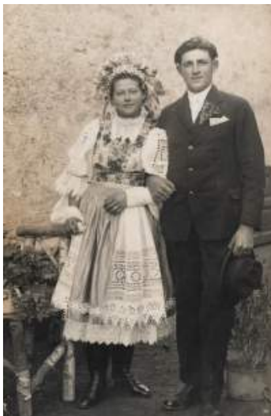
Obr. 3 Nevesta a ženich, Piešťany, okolo roku 1920 (archív autorky)

Špecifikom odevu neviest bola parta . Z Piešťan sa žiadna nezachovala . Dokumentácia je len na historických fotografiách a v jednom opise (Kosová 1978, s. 38). Z nich usudzujeme, že parta sa skladala z čelenky – venčeka, korunky a stúh. Čelenka bola husto pošíta farebnými korálkami, ktoré v zadnej časti dopĺňali vetvičky rozmarínu alebo inej vždyzelenej rastliny. Na venček sa pripieňovala korunka z kruhových ozdôb. Poslednú, zadnú časť party vyplňovali vyšívané stuhy. Niekoľko z nich sa naskladalo do záhybov, ktoré lemovali zadnú stranu party, zvyšné stuhy padali neveste na chrbát a siahali až ku stehnám.