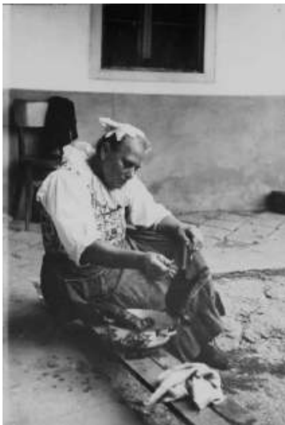
Obr. 11 Všetný ženský odev. Krakovany, 2. tretina 20. storočia