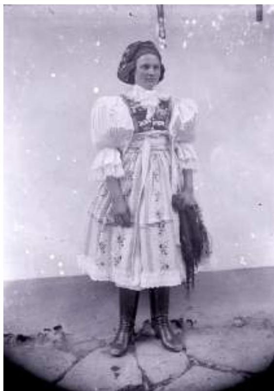
Obr. 133 Ženský slavnostní kroj, dívka v hedvábné kordulce, volných baňatých rukávcích a v úvazu šátku na náušnice. Ostrožsko, začátek 20. století (soukromý archiv)