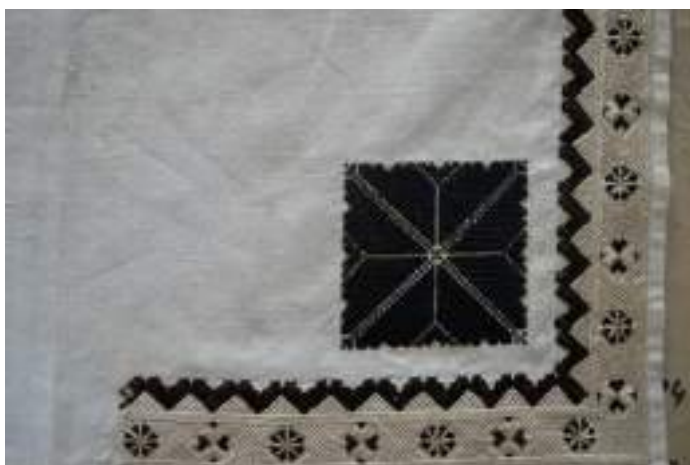
Obr. 161 Detail výšivky na jemný výřez – roh šatky jako pokrývky ženské hlavy. Ostrožsko, kolem roku 1830. Fond Slovákého muzea v Uh. Hradišti

Nejstarší typy výšivky byly velmi jemný. Dokladem toho jsou hlavně šatky a dýnka čepců se starobylými, většinou geometrickými ornamenty, které jsou uloženy v paměťových organizacích jako velmi vzácné starobylé kusy textilu, dokonce z přelomu 18. a 19. století. Převládající barevnost té doby je krémová v kombinaci s černou.