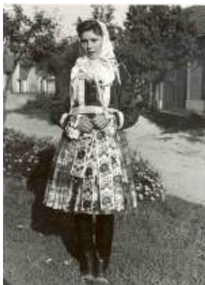
Obr. 106 Mladší varianta polosvátečního oděvu z Kunovicka, žena v jupce a třásňovém brokátovém šátku. Popovice, 2. polovina 20. století

Jupky patřily ve 20. století k nejrozšířenějšímu krojovému oděvu žen, svobodných dívek i malých děvčat. Oblékaly je nejen ve všední dny, ale také ke kroji svátečnímu i nedělnímu. Pod jupku ženy neoblékaly rukávce, ke krku připínaly jednoduchý zřasený obojek, tzv. lémeček, který byl z bavlněného tylu, někdy vyšitý křížkovým vzorkem různobarevným hedvábím, zdobený bílým štikováním, které bývalo i vypodloženo, nebo byl zdoben našitými strojovými pásky s vetkaným vzorem červené barvy. Zdejší ženy nosily také jupkové halenky s krátkým rukávem, k nim si pořizovaly i zástěrky ze stejné látky. 29