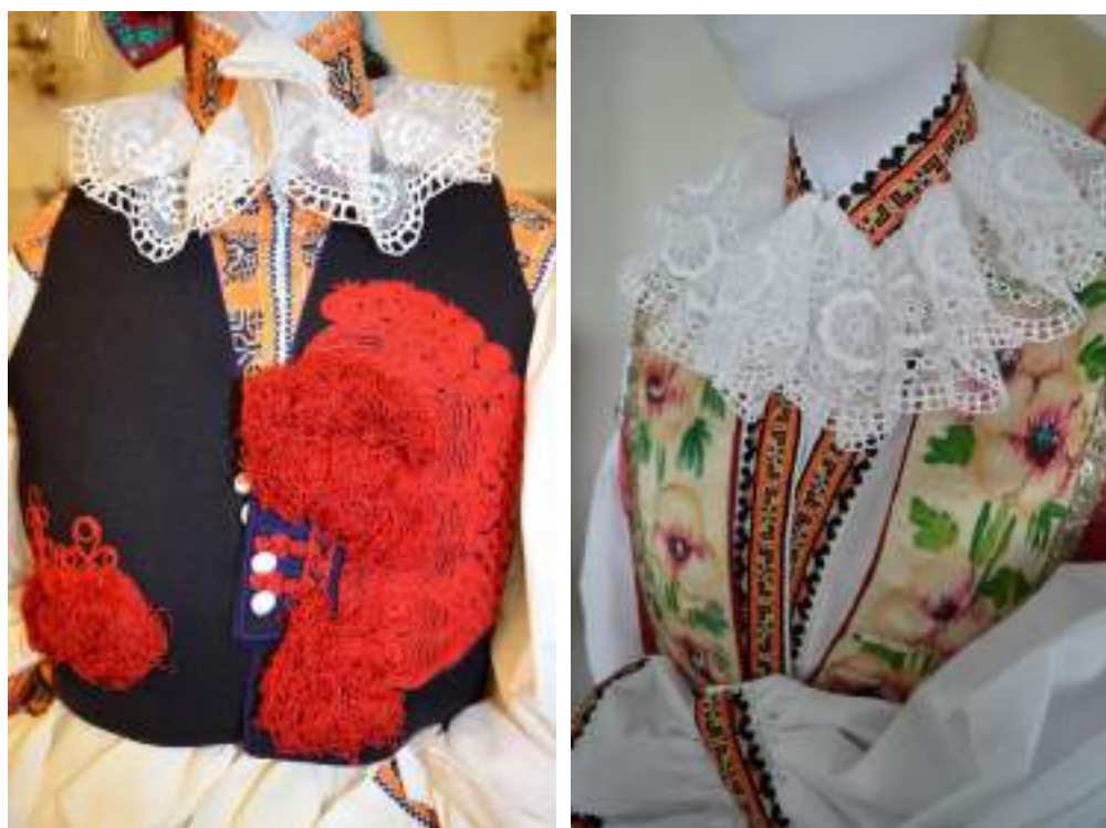
Obr. 158 Rekonstrukce - tmavě modrá soukenná ženská kordulka, zdobená ruční výzdobou-cifrováním a výšivkou, hedvábná atlasová kordulka, rukávce s kompletním vyšíváním (kolem roku 1890) - podle návrhu R. Habartové. Ostrožsko, 2013