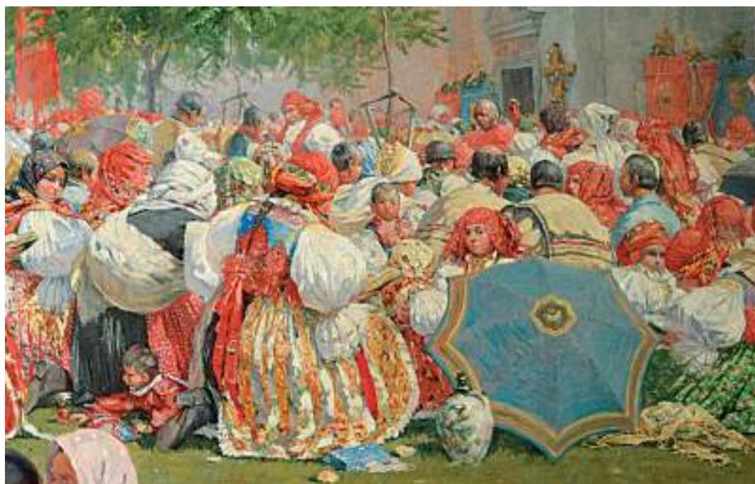
Obr. 35 Pout' u svatého Antonínka v Blatnici, 1894. Joža Uprka, výřez z obrazu (foto: Romana Habartová)