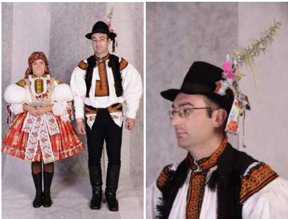
Obr. 55 Slavnostní kroj. Současná podoba kroje. Medlovice, 2009

Kroj z Medlovic dnes patří do skupiny krojů uherskohradištského Dolňácka, polešovické oblasti. V mikororegionu Buchlov se tento typ kroje nosí také v Boršicích, Tupesích, Hostějově a Stříbrnicích. Ještě na začátku 20. století se zde však nosil kroj podobný kroji buchlovickému. Dnes si mladí muži oblékají tmavé skoukenné kalhoty- nobavice , zdobené hustým černým šňůrováním. Přední díl nohavic má starodávny poklopec, kterým se provléká vybíjený opasek- řemeň . V punktu je zasunut bílý šáteček s krajkou. Košile typu dudovice s širšími rukávy u zápěstí zúženými a bez manžet, jejichž okraj je zpevněn červeným líčkem, jsou zdobené vyšíváním na hrubý výřez, který je ale v poslední době nahrazován méně pracným výřezem bez vysokých bubínků. Bílé plochy tak dávají více vyniknout výraznější barevné prokreslenosti. Často se již vyskytuje i vyšívání provedené křížkovou technikou. Kordula je šitá z tmavého sukna s tmavým šňůrováním, obě strany předního dílu jsou lemovány kulatými knoflíčky.