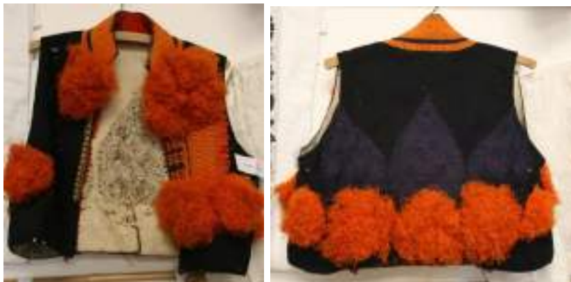
Obr. 187 Mužská kordula z Ostrožska. Blatnice, 1925. Fond Slovákckého muzea v Uh. Hradišti

Nejcharakterističtější krojovou součástí mužského oděvu je tmavá až černá soukenná vesta-kordula . Její střih je obdobný jako u jiných kordul na Dolníácku vytvářející na zádech tři šúsky. Nepřehlédnutelná je na mužské ostrožské vestě její bohatá výzdoba. Stojatý límec je po celé ploše zdoben velmi hustě a jemně vyšitým pruhem provedeným oranžovou harasovou vlnou. Josef Klvaňa zmiňuje, že na stojatém límci je šňurování modré, červenými stehy prošité, a to buď jablíčkovaté nebo růžičkovaté, kde totiž buď jablíčka nebo růžičky jsou vyšity. 71