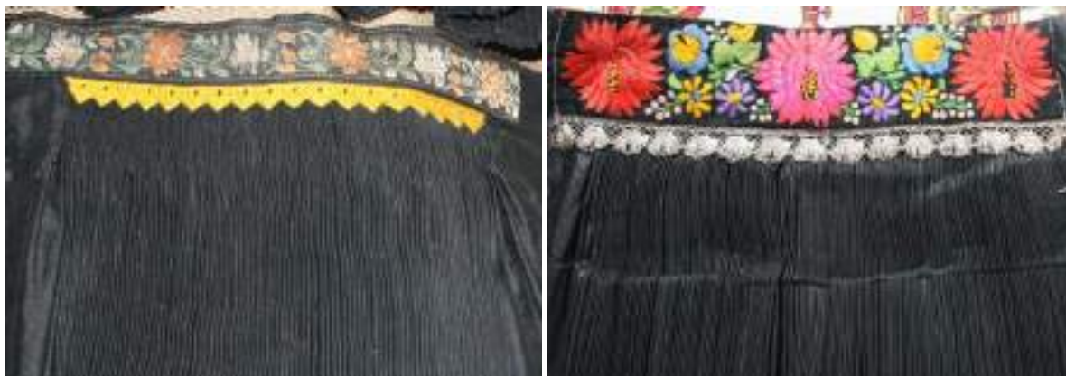
Obr. 149 Zdobení šorce jemnou žlutou geometrickou výšivkou přes vrapy, vpravo s plochou výšivkou s naturalistickým květinovým. Blatnie pod Sv. Antonínkem, 20. století