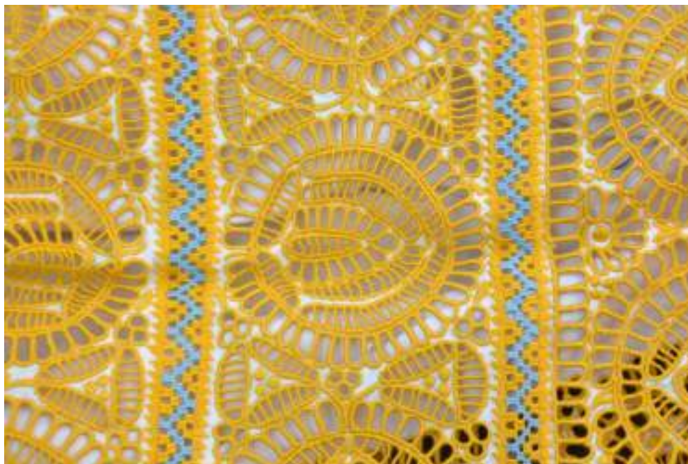
Obr. 14 Sviatočné sirkové rukávce - detail. Krakovany, 1. polovica 20. storočia