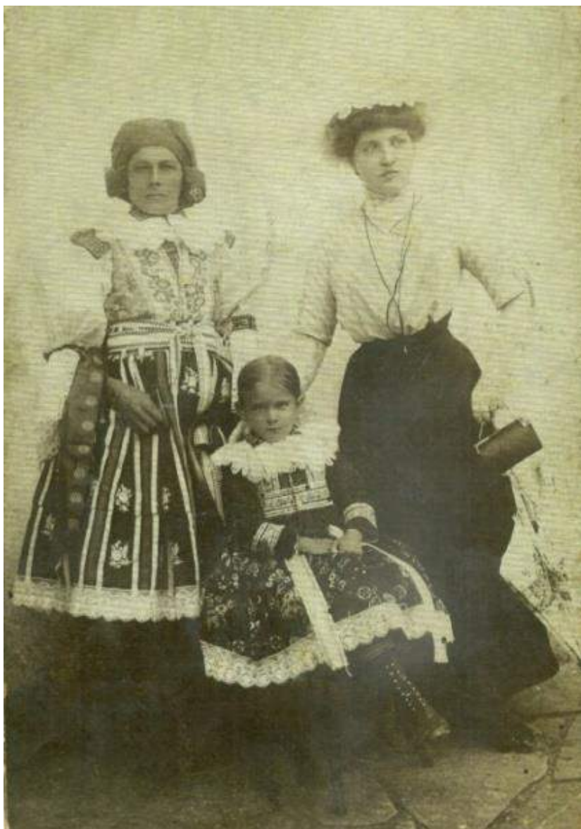
Obr. 123 Matka s dcerkou-školačkou ve slavnostním ostrožském kroji, žena v módním městském šatu. Ostrožsko, začátek 20. století

naškrobených spodnic. S ní musela korespondovat horní polovina těla, která se nově vzniklé nepraktické siluety snažila přiblížit použitím vyztužení a vycpávek v rukávcích, které nabyly nových nelogických, rozměrných a lomených tvarů. Postupně lze sledovat pronikání střihu městského oděvu do oděvu lidového. Mužský oděv byl tvořen stále častěji tzv. selskými obleky ve skladbě: sako, košile, kalhoty, klobouk městského typu. Zvýšila se obliba hedvábných materiálů převzatých z městského prostředí. Odchod za prací mužů i žen způsobil rychlé pronikání městské módy do lidového oděvu, včetně doplňků, především se to týkalo obuvi. Rovněž význam proslaveného poutního místa na kopci svatého Antonínka se setkáváním tisíců lidí různých krojových typů i s městským aktuálně módním oděvem návštěvníků poutního místa, nepřímo zasahovalo aktuálními módními trendy do tohoto prostředí a zvolna působilo na vývoj kroje zdejších obyvatel. Velkou roli sehraává možnost svobodného pohybu s cestami do měst a na trhy a jarmarky s rozvojem obchodní činnosti a zvyšování kupní síly jednotlivců.