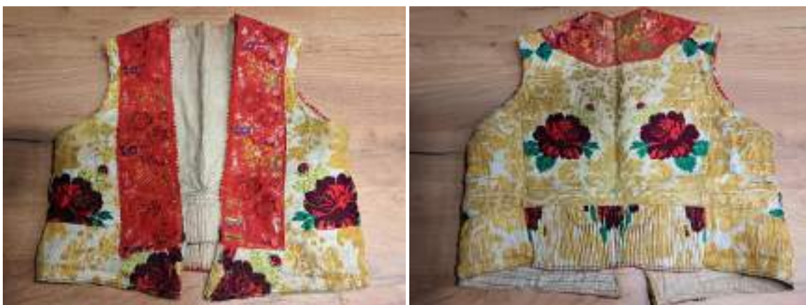
Obr. 83 Ženská vestička/kordulka – přední a zadní díl, Staré Město