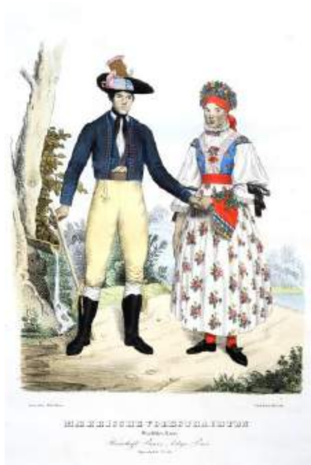
Obr. 34 Kolorovaná litografie Wilhelma Horna. Mladý pár v lidovém kroji. Bzenecké panství, 1836 (reprodukce z knihy)

Významnou pomůckou pro dobrou orientaci ve vývoji odívání na našem území představuje obrazové dílo malíře Wilhelma Horna , soubor litografií Maehrens ausgezeichnete Volkstrachten . Vzniklo v roce 1837 při příležitosti korunovace císaře Ferdinanda V. Soubor obsahuje barevné litografie krojů moravského, německého a chorvatského obyvatelstva, které se zúčastnilo zmíněné lidové slavnosti. Význam tohoto díla spočívá v tom, že podává přesný obraz krojů díky věrohodnosti kolorování. Jednotlivé Hornovy litografie prozrazují, že k podstatné diferenciaci krojového rozvrstvení došlo až po roce 1848 v souvislosti se zrušením poddanství; možnosti volného pohybu obyvatel a industrializace vedly k postupnému vytlačení domácí rukodělné výroby a nahrazování starších materiálů novými textiliemi. 19