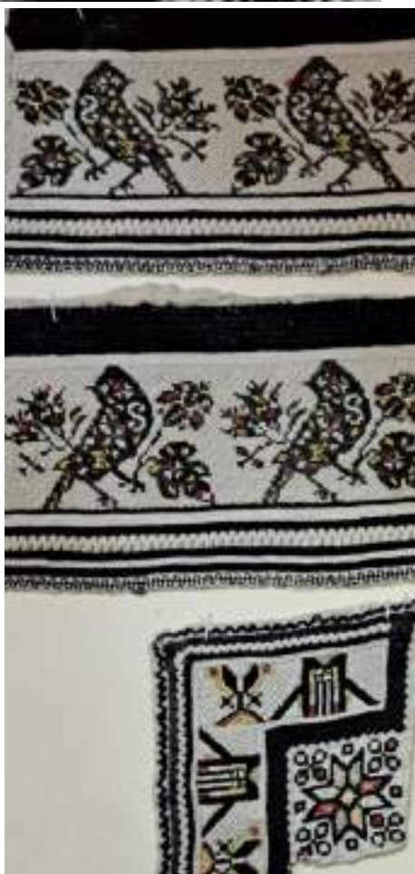
Obr. 220 Ukázka mužského výřezového vyšívání na slavnostní košile. Vlčnov, 20. století. Fond Slovákckého muzea v Uh. Hradišti