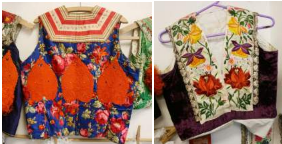
Obr. 159 Atlasová kordulka s rypsovou stuhou zazadu, začátek 20. století; sametová kordulka s naturalistickou výšivku kolem výstřihu a s kovovou krajkou, 2. polovina 20. století. Ostrožsko (fond Muzea Blatnice pod Sv. Ant.)

Na začátku 20. století patřily k nejoblíbenějším mezi mladými dívkami kordulky z hedvábí , nejčastěji modré a květované se secesními motivy. Tyto kordulky byly již zdobené kolem výstřihu stuhou- pantlou i lesklým prýmkmem-portou, podobně jako u vestiček okrsku hradištských krojů. Ostrožské vestičky mají vzadu výšivku (cifrovanou, ručně vyšívanou) s motivem na tři tulipány, s oranžově červeným šňůreckováním a malými štrapatými kytkami.