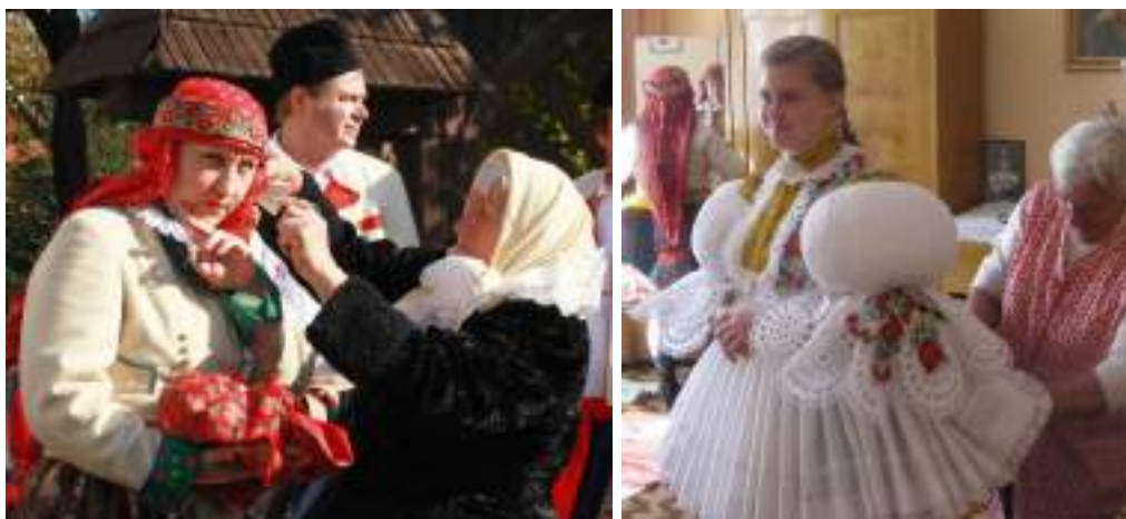
Obr. 67 Slavnostní kroj hodové mládeže. Současná podoba kroje. Mařatice, 2015

Mařatice jsou částí města Uherského Hradiště. Dodnes si udržují během roku řadu svébytných zvyků a obyčejů. Můžeme se zde setkat s tradičními prvky, které charakterizuje oblékání do krojů, Mařatice disponují zachovalou tradiční lidovou architekturou i Muzeem v přírodě, skanzenem Rochus, kde se setkávají folklorní soubory a skupiny. Mařatice jsou proslulé pěstováním vína, vinnými sklepy ve vinohradnickém areálu. K výročním slavnostem, fašanku, velikonoční obchůzce, stavění máje, slavnosti hodů apod. se mařatická chasa schází a obléká slavnostní kroj.