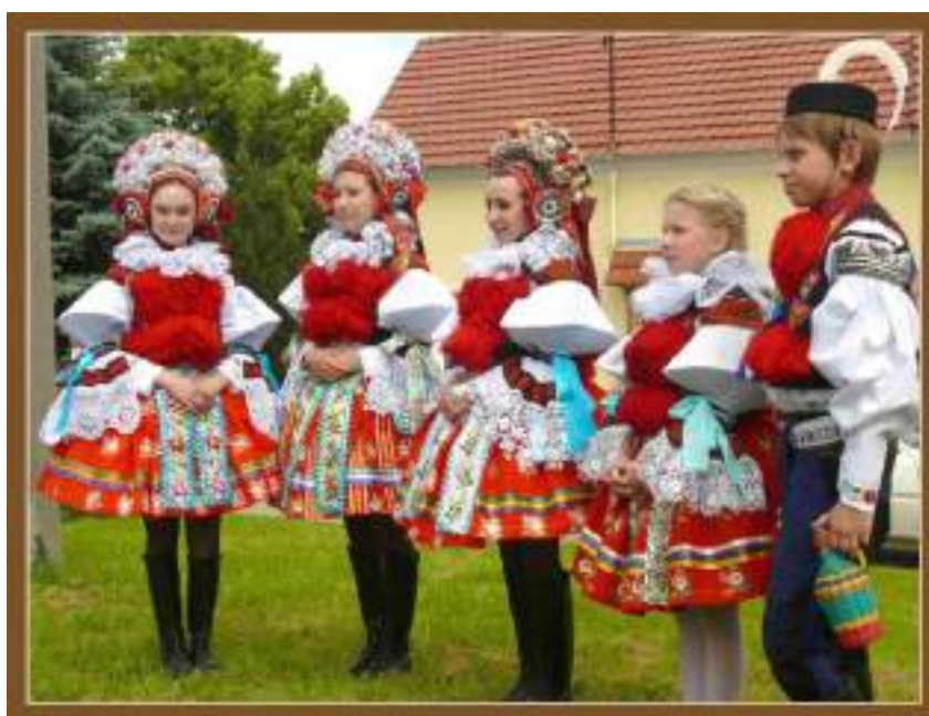
Obr. 211 Mladé ženy z Vlčnova v soukenných kordulkách s velkým rozvinutým třepením a rukávcí s lomenými rukávy a velkým krajkovým límcem. Vlčnov, 2011