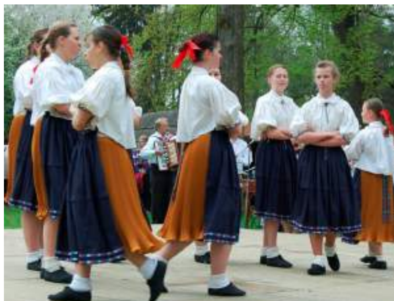
Obr. 37 Stylizace krojů ze Strání. Dětský folklorní soubor Děčka z Kunovic. Rožnov pod Radhoštěm, 2015

Ke stylizaci jako osobitému způsobu zpracování tradičního oděvu jako uměleckému dílu přistupujeme tehdy, pokud se snažíme nebo musíme z jakýchkoliv důvodů (finanční nákladnost, nedostupnost materiálu např. textilie, galanterie, ale i praktičnost, účelnost, pohodlnost, rychlost vrstvení kroje při jeho oblékání pro scénu) vlastním osobitým způsobem upravit, sestavit a realizovat zpracování tradičního oděvu posunem nebo dokonce deformováním skutečnosti. Musí však zůstat zachovány základní stavební prvky předlohy, které respektují strukturu vzoru. Jedná se tedy o formu zjednodušení krojového typu se zachováním původního střihu a podstatných vlastností krojového typu.