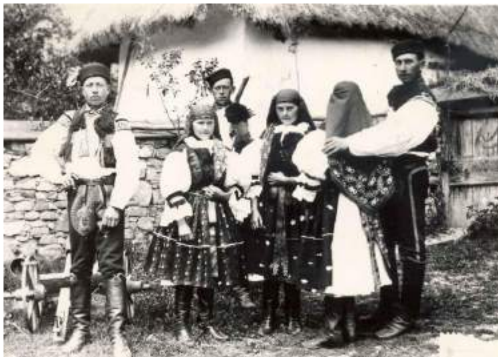
Obr. 28 Vlčnovjané ve slavnostních krojích. J. Klvaňa. Vlčnov, 1890 (soukromý archiv)