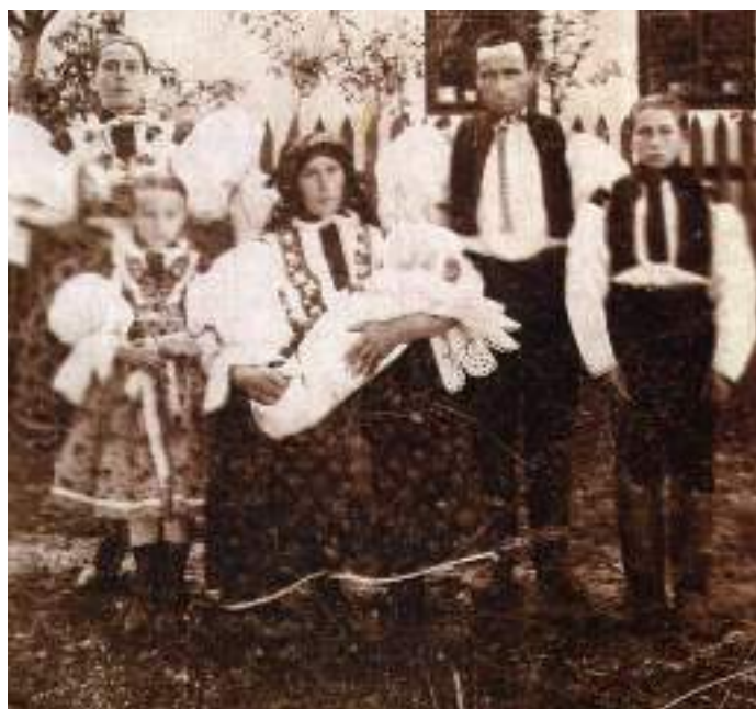
Obr. 43 Soubor snímků – podoba slavnostního a svátečního kroje. Modrá, kolem roku 1910