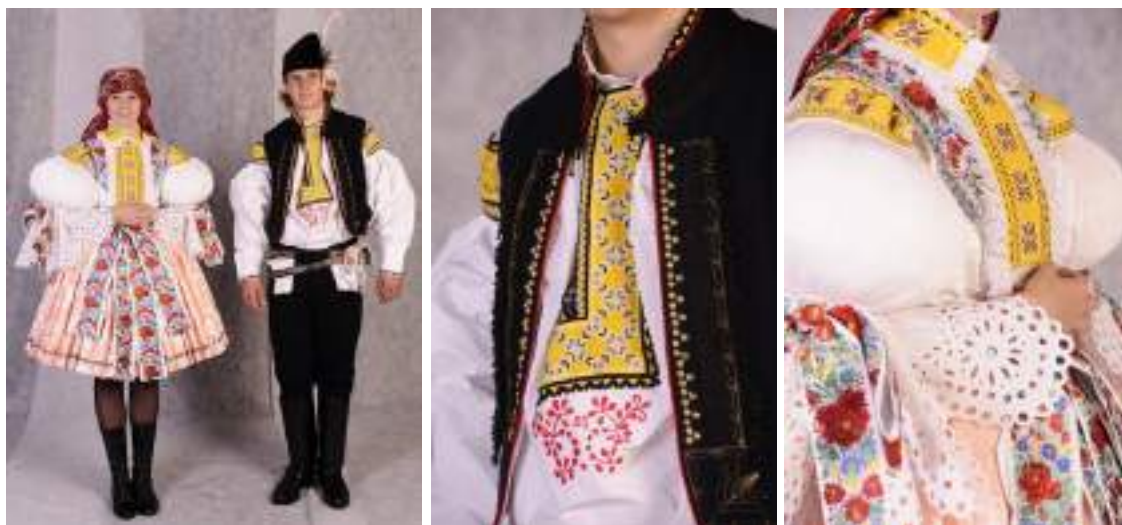
Obr. 64 Slavnostní kroj hodové mládeže. Sušice, 2009

I když v malé obci Sušice je příležitostí k oblékání do kroje méně (červencová pouti hody), obyvatelé obce kroje vlastní a umí se do kroje oblékat. Chlapce nejvíce zdobí košile s baňatými rukávy, na kterých je v současnosti přišitý žlutý, tedy mladší typ výšivky s motivem na keříže , v tomto krojovém okrsku často se světle modrými výplněmi. Široké nárameníky, ale i fajka , přednice, mají při okraji vyšitou formičku či mřížku podobnou mrštěnce . Zvláštností mnohých košil je výšivka na prsou pod fajkou, provedená plochým stehem červenou bavlnkou květinovým vzorem, obvykle do obloučku. Mnohdy mají muži v tomto květinovém medailonu vyšitý vlastní monogram. Soukenné kalhoty doplňuje vyšívání kapesníček a vybíjený řemen dvakrát omotaný okolo pasu. Svobodným chlapců náleží pokrývka hlavy v podobě beranice s vonicí a kosírky.