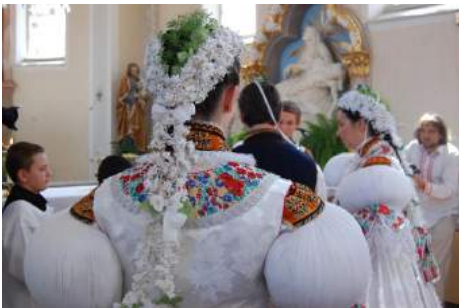
Obr. 51 Obřadní úprava hlavy nevěsty, Kostelany, 2010

Svobodní chlapi nosí slavnostní kroj typický pro polešovickou oblast: soukennou kordulu, nohavice, košili s baňatými rukávy a vyšívaným obojkem, nárameníky a fajkou s typickou sytě oranžovou hedvábnou nití s tradičními vzory na věnečky , na kříže a výšivkou pracovanou na vysoký výřez s bubínky. Zvláštností mužského kroje je vyšívání sytě oranžové a cihlové barvy, provedené vysokým výřezem s barevnými znameny na kříže , četné jsou drobné světle modré a fialové výplně. Zcela nový typ vyšívání u mužských košil se objevil po roce 1930, kdy pro větší výraznost motivu se plochy mezi motivy přestaly úplně vyšívat a zůstaly bílé, takže vzor černo-oranžový vynikl více než původní výšivka s hrubým a velmi pracným bubínkem na ploše. Ke zvláštnostem v oblečení hodových stárků patří bílá beranice ozdobená vonicí, barevnou hedvábnou protkávanou navázanou stuhou a kosírky. Starší muži oblékají soukenné kalhoty, sámkovou košili, lajbl, vysoké boty, v letním období klobouky se širokou střechou a beranice v zimě. Do nohavic už nevkládají vyšívaný šátek.