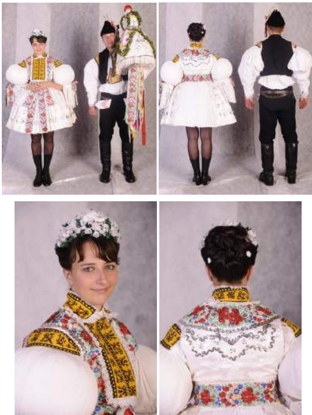
Obr. 72 Slavnostní kroj hodové mládeže. Současná podoba kroje. Březolupy, 2009

V současné době hlavně se o udržování krojů a místních zvyků starají nadšení jednotlivci, soubor Botík a zdejší krojové specialistky. Mladé ženy v Březolupech se o hodech oblékají do slavnostního kroje, jen stárka chodí po bílu , v obřadním kroji, který kdysi oblékala nevěsta k svatbě. Na baňaté rukávce se světlým vyšíváním na výřez je oblečená bílá brokátová kordulka, zdobená našitými stříbrnými portami na přednici i zádech. Zadní sukně- fěrtoch je bílá, plátěná, hustě našarovaná, dříve měla přes vrapy hrubší bílou nití vyšitou formu. Přední fěrtušky jsou šité k slavnostním příležitostem z různě barevného brokátu, stárka o hodech jej má ušitý z bílého