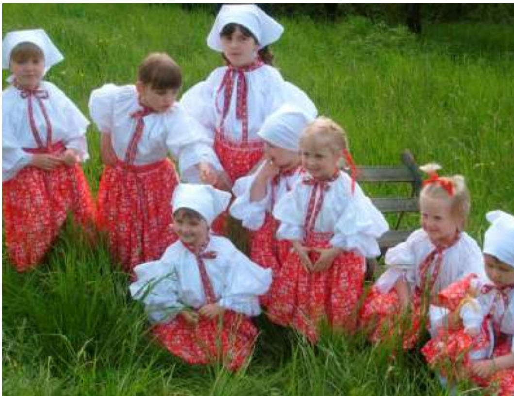
Obr. 38 Imitace kroje pro děti, Střílky, kolem roku 2007

Slovem imitace označujeme nápodobu něčeho, připodobnění nějaké věci k jiné věci. Imitace se může realizovat i v oblasti hotovení napodobeniny krojového oděvu, který už není krojem, ale má vzbuzovat tento dojem. Jedná se o nápodobu původní předlohy s imitováním a zjednodušováním ve všech stavebních prvcích a detailech, včetně možné deformace stavebních prvků původní předlohy, případně vzniká bez ní a je výsledkem osobité představy autora.