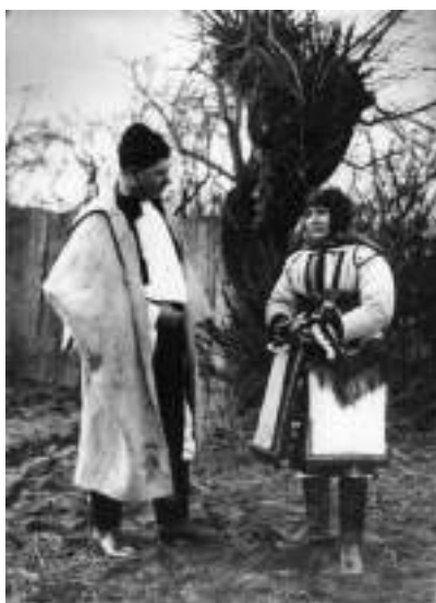
Obr. 107 Žena v kožichu a tureckém šátku uvázaném na rožky, muž v haleně a v beranici-astrigance, Kunovice, 20. století