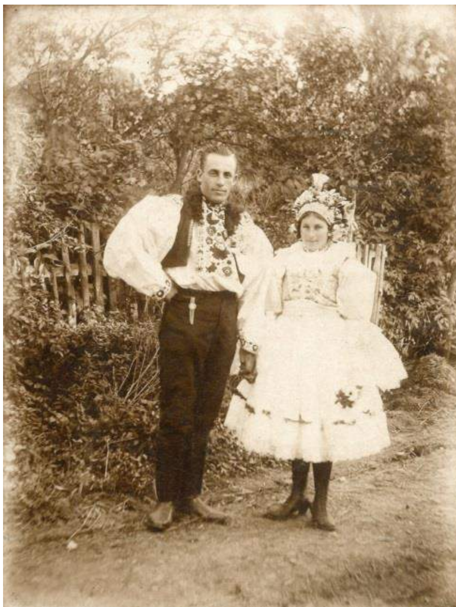
Obr. 135 Novomanželský pár v obřadním kroji. Ostrožsko, první polovina 20. století

Zásadní dopad na podobu kroje měla městská móda, která negativně ovlivnila délku sukní, jež se během 20. století ve dvou etapách zkrátily téměř o třetinu. Přední sukně-fěrtůšky a zadní sukně-šorce a fěrtochy se z délky sahající do půle lýtek (kolem roku 1920 ještě činila kolem 80 centimetrů) zkrátila do poloviny 20. století po kolena a ustálila se asi na 55 až 60 centimetrech. Módní vlna šedesátých a sedmdesátých let 20. století opět negativně zapůsobila na délku sukní v lidovém oděvu. Také vrstvením většího počtu více naškrobených spodnic nabyla silueta ženské postavy na šířce a sukně působí dnes kratším dojmem, než ve skutečnosti jsou. 63