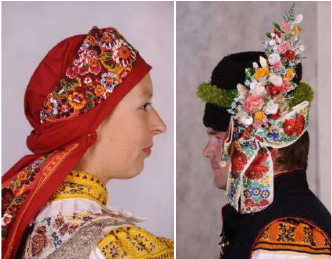
Obr. 62 Slavnostní kroj hodové mládeže. Jalubí , 2009

Mladí muži a děvčata z Jalubí dodnes oblékají slavnostní kroj. Slavnost Božího Těla, dožíněk či hodů na konci září nebo další svátky k tomu poskytují jedinečné příležitosti. I dnes se najdou ženy, které kroji rozumí, umějí ho ušít, ovládají techniky vyšívání, žehlení a škrobení i oblékání. V Jalubí je to velehradsko-spytihněvský typ kroje a od ostatních obcí se příliš neodlišuje. Jalubští mládenci nosí kroj jako ostatní v tomto krojovém okrsku. Tmavou kordulu a kalhoty doplňuje plátěná dudová košile s bohatým výřezovým vyšíváním. Zajímavý je šátek či kapesníček, který se vkládá do v průstříhu kalhot. Zde je rozměr šátku daleko větší a širší, neboť jej muži mají několikrát složený, po stranách jim hodně přečnívá z obou stran. Stárci jej mívají obvykle čistě bílý s velkým dírkovým vyšítím, ostatní chlapci mají šátek bílý s červeným květinovým vzorem vyšítým plochým stehem. Mladí chlapci si zdobí beranici jen voničkou se stuhou a kosárky, stárek navíc zeleným věnečkem po jejím obvodu.