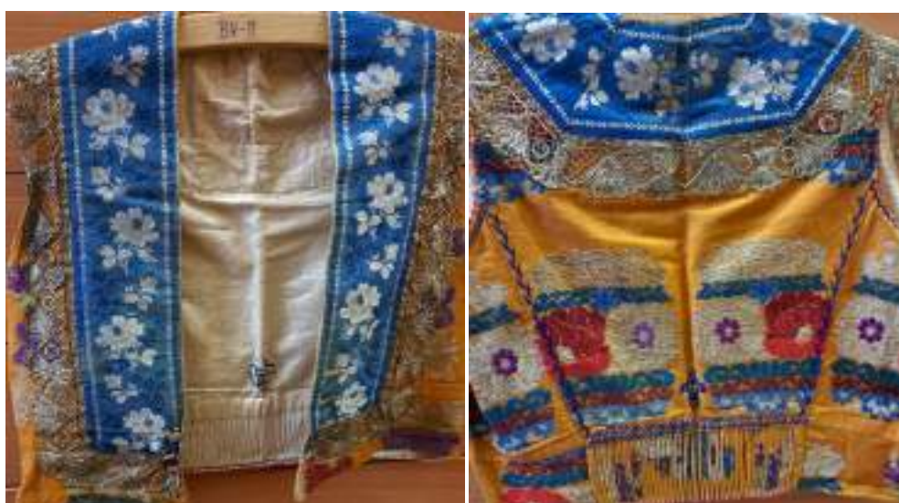
Obr. 80 Ženská vestička/kordulka – přední a zadní díl, Uherské Hradiště