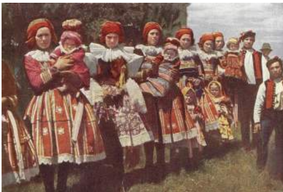
Obr. 126 Matky s dětmi ve slavnostních krojích, tzv. kanduších, na hlavách mají pupy s frčou. Uherskoostrojsko, kolem roku 1915 (F. Sukaný)

Batolata se chovala v širším popruhu z pevné tkané textilie, tzv. chůvce , do které se dítě zavinovalo a mohlo se nosit na zádech i v náručí. V době, kdy děti již začínaly chodit a až do předškolního věku, nosili chlapci i děvčátka šatičky s dlouhým rukávem, kterým se říkalo kanduše nebo němkyně .