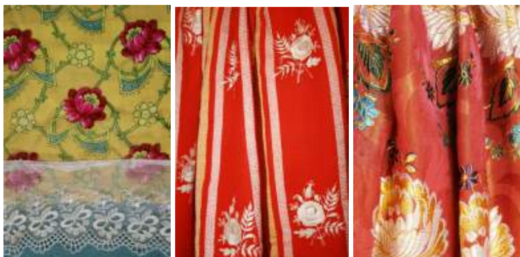
Obr. 152 Různé materiály předních sukni v průběhu první poloviny 20. století: vlněný-kašmírový, (merinový), vlněný štof-pruhokvět, brokát, oblíbený dodnes (fond Slovákého muzea v Uh. Hradišti)

Na hotovení předních sukni-fěrtůšků, byly v 19. století používány kartounové a batistové látky světlejších barev, poté vlněné sukně harasové a kašmírové v tmavších pastelových barvách. Byly pestré, široké a splývaly do půl lýtek. K nejrozšířenějším patřily kašmírové sukně-delínky se žlutým, zeleným, bordó nebo růžovým základem a pestrými drobnými kvítky, sukně harasové, tzv. pruhakvěty či harásky.