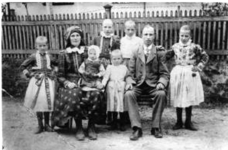
Obr. 19 Rodina ve svátečním oděvu. Ořechov, kolem roku 1920