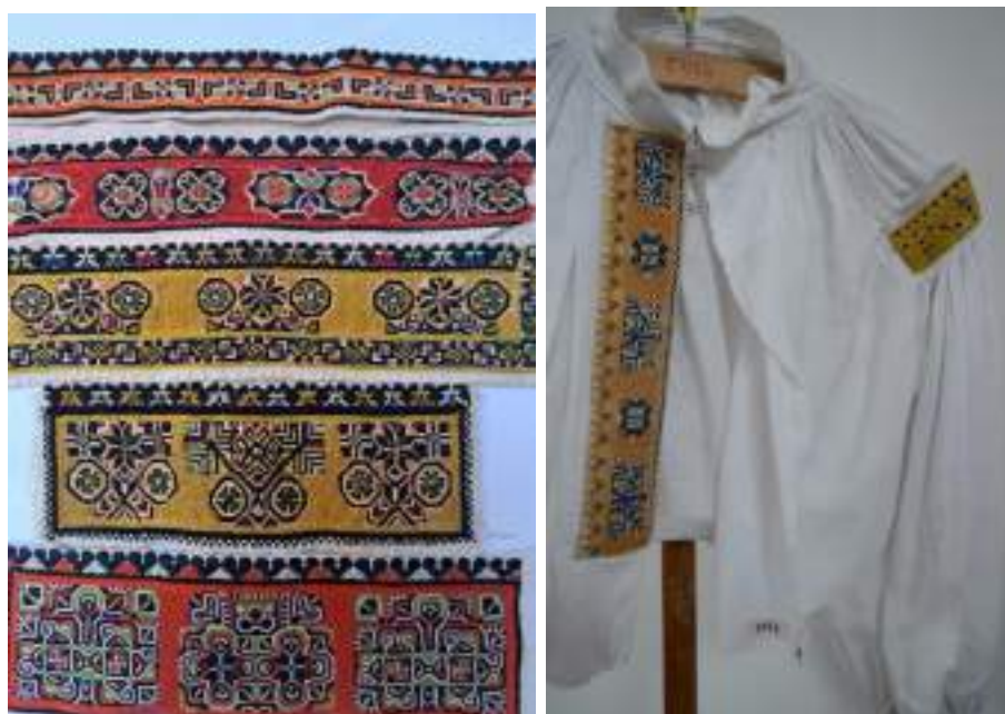
Obr. 160 Ukázka proměny ženského vyšívání z Ostrožska a rukávce s výšivkou na výřez. Období 1890-1930. Soukromá sbírka a fond Slovákčého muzea

Geometrická výšivka dle počítané niti nevyžaduje předkreslení, vzor a jeho velikost je definován pomocí sítě osnovy a útku vyšivací tkaniny. U tohoto druhu výšivky dochází ke stylizaci vzoru, který způsobuje respektování podkladové tkaniny. Při domácí produkci plátna s vhodnou hustotou osnovy pro výšivku dle počítané niti byla výšivka zpočátku vyšívána přímo na ženský či mužský oděv. Výšivka podle počítané niti má na rozdíl od výšivky podle předkresby i funkci praktickou – bývá aplikována v namáhaných místech oděvu, v místech, kde je potřeba látku začistit, zpevnit – kolem výstřihu, na límci, kolem loktů, zápěstí.