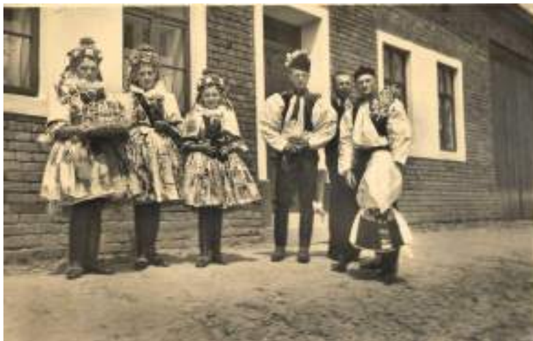
Obr. 91 Obřadní oděv kunovického okrsku - nevěsty, ženicha, družiček a družby. Kunovice. Kolem roku 1935