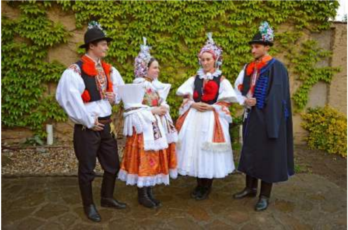
Obr. 154 Rekonstruovaná podoba ženského a mužského obřadního kroje svatebních párů podle muzejních sbírek dle návrhu R. Habartové (zleva 1920 a 1890). Ostrožsko, 2012

U mladší generace dívek byly oblíbené pestrobarevné sukně-hedvábné atlasky s pestrobarevným, rostlinným a květinovým vzorem, kolem okraje vždy zdobené bílou kraječkou, tzv. kaničkou, o šířce tři až pět centimetrů. Mladé a svobodné dívky nosily sukně světlejších tónů, sukně tmavších barev byly vhodné pro starší ženy; typické byly pro období zimy, půstu a smutku. Od třicátých let 20. století se začal více používat brokát, který vedle kašmíru přetrvává dodnes. K slavnostním a obřadním příležitostem se dnes využívají těžší látky, dvojútkové brokáty, často protkané kovovými nitěmi. Ve všední dny a v letním čase nosí ženy sukně z lehčího brokátu, polobrokátu, světlých pastelových barev. Přední sukně jsou v současné době u dolního okraje nebo dokola téměř až k pasu lemovány bílými tylovým, tzv. tyranglovými krajkami, kterým se říkalo orientálky. Dnes i tyto kanice či kaničky nabyly na velikosti a dosahují šíře osm až dvanáct centimetrů. 65