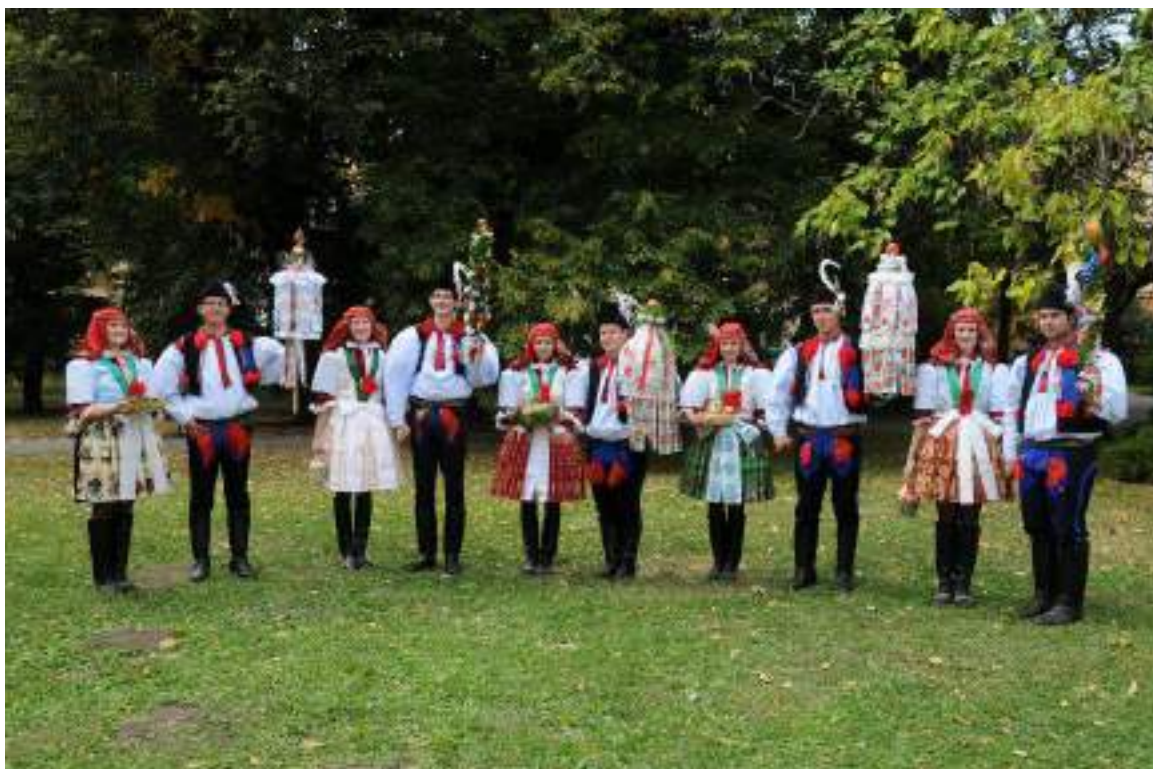
Obr. 114 Hodové páry oblasti Kunovicka ve slavnostním kroji, současná podoba kroje

Všední košile je holá, bez vyšívání, a má stejný střih jako košile slavnostní. Tvoří ji vrapený trup s příramkovými, nahoře nadutými a ostře kosenými rukávy. Široké baňaté, tzv. vyduté či naduté, rukávy jsou u zápěstí zúžené, ale bez manžet. Zde bývala košile zpevněna ručním zdobným stehem, později, ve druhé polovině 20. století, i našitím stužky, tzv. líčka. Okraj rukávu u zápěstí těsně přiléhá, proto má v současné době nástřih, aby do ní muži ruku dostali, a zapíná se na jeden patent. Holé košile bez zdobení se nosily na všední dny, muži je oblékali pod černé selské vesty, svrchní cajkové kabátky i kabáty, ale i k slavnostním kordulám. Je to univerzální a praktická košile. Kolem krku a na ramenou je hustě vrapená, nepřiléhá těsně k tělu, dle slov pamětnic se dá dobře prát i žehlit. V ramenou je široká, baňaté dudy v horní části rukávů přispívají k šířce ramen mužů a dodávají jim na robustnosti i mužnosti. Rukávy jsou však ve srovnání se sousedními obcemi mnohem užší. Nosila se k soukenným kalhotám i k bílým gatím, převázaná zástěrou. Košile stejně jako plátěné gatě patří k těm součástkám mužského oděvu, které si v celé oblasti kunovského typu kroje muži znovu pořizují. V této oblasti nikdy nechodili a nechodí muži v košilích se stánkem na gatích, jak je zvykem v některých obcích na Brodsku.