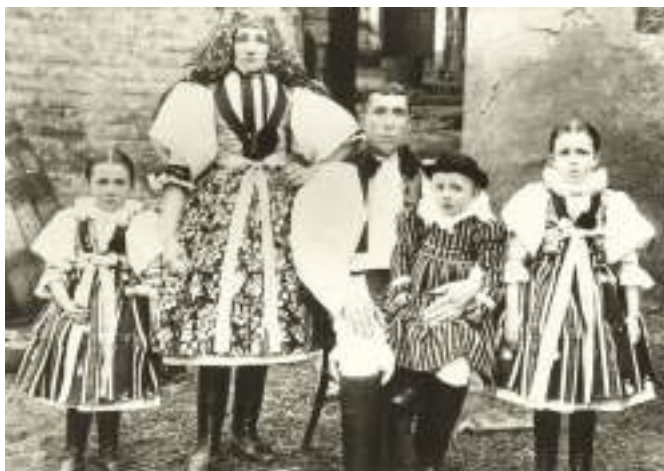
Obr. 90 Mladá rodina ve slavnostních krojích kunovického okrsku. Kolem roku 1915

Kroj Kunovicka si do dnešních dnů uchovává ve srovnání s ostatními kroji regionu jednoduchost a starobylost, v porovnání s okolními obcemi působí obyčejně, až stroze. Vývoj zde nevytlačil ani různé varianty s množstvím krojových součástí, mimo kožichy, haleny a bílé lajble, které se díky rekonstrukcím těchto oděvních kusů vracejí znovu do života současného kroje.