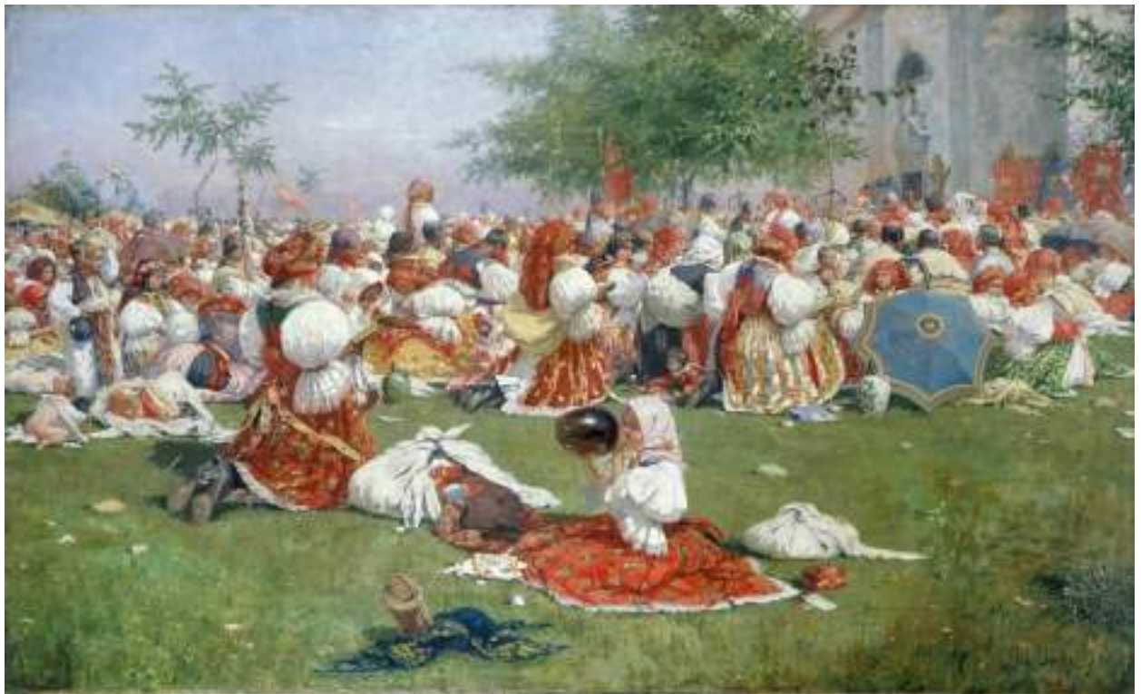
Obr. 125 Pout' u Sv. Antonínka nad Blatnicí – v popředí lidé z Ostrožska a Kunovicka. Blatnice, 1894. Joža Uprka. Reprodukce pohlednice