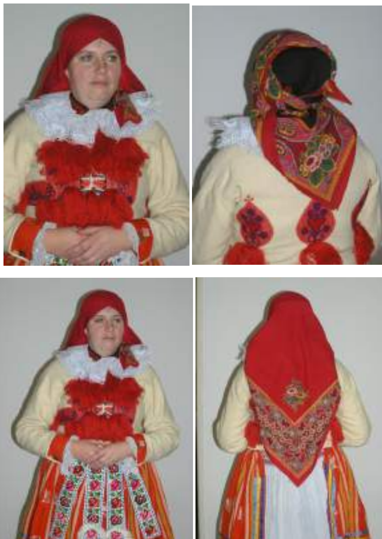
Obr. 206 Vdaná žena z Vlčnova v lajblu a ve specifickém úvazu šátku. Vlčnov, 2008