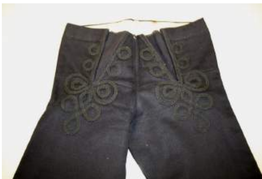
Obr. 185 Šňurování na mužských kalhotách. Ostrožsko (Blatnice, 1890)

Mužský sváteční kroj tvoří kalhoty nohavice z temně modrého až černého sukna, které je obvyklé pro šití krojů z Dolňácka. Tento typ přiléhavých dlouhých kalhot je zdoben tmavě modrým až fialovým šňurováním. Je vytvářeno stáčením plochých či dutinných prýmků, kterým se říká sutašky a tresy. Sutašky tvoří splétaný prýmek s nitěmi spojenými do dvou sloupků, do kterých se obvykle vkládá výplňková nit a ploché tresy tvoří splétaný prýmek, u kterého se každá nit pravidelně provazuje nad a pod další nití. Ostrožské šňurování je odlišné od šňurování kalhot hradištských nebo kunovických a mělo by respektovat lokální motivy. V minulosti nebylo bohatě rozvinuto, dnes zůstává zdobení pomocí šňůrek ve volnější kompozici, ale často sahá až nad kolena.