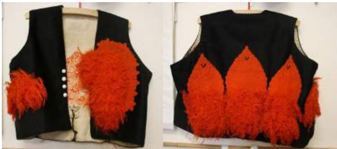
Obr. 157 Tmavě modrá až černá soukenná ženská kordulka, zdobená ruční výzdobou-cifrováním a výšivkou, Ostrožsko, přelom 19. - 20. století (fond Muzea Blatnice pod Sv. Ant.)

Ženské kordulky se ještě na přelomu 19. a 20. století podobaly mužským. Byly šité z černého sukna, ale bez stojatého límečku, na zádech i vepředu byly zdobeny tzv. cifrováním-šňůrečkováním. Spolu s červenými či oranžovými střapečky-kytkami z kamrholu (niti z velbloudí srsti) představovaly hlavní znak ženského slavnostního ostrožského kroje. Vedle soukenných kordulek se začala paralelně vyvíjet na konci 19. století řada kordulek z jemných hedvábných textilií, z atlasu, rypsu, saténu, taftu, jemného brokátu apod.