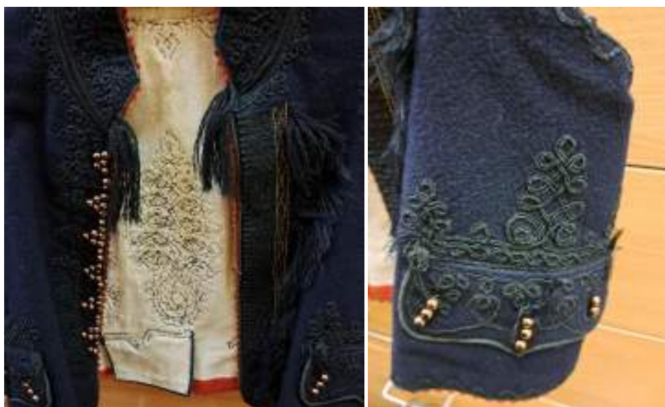
Obr. 75 Detail zdobení mužské vesty – přednice, kapsa, Boršice u Buchlovic