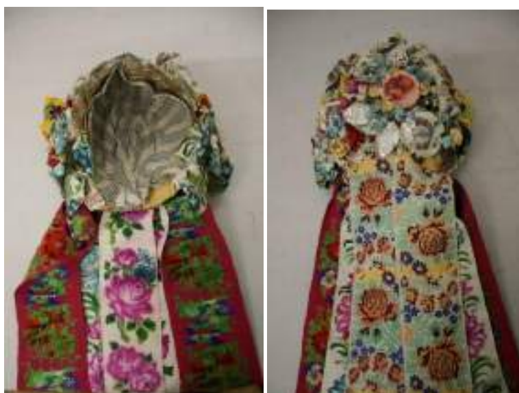
Obr. 176 Obřadní ženské pentlení, v barevnosti pomalu mizí dominantní červená barva. Ostrožsko, kolem roku 1925b(fond Slovákkeho muzea v Uh. Hradišti)