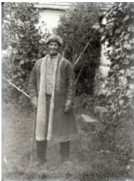
Obr. 33 Stařeček v kořichu. Komňa, kolem roku 1900

Při studiu tradičního oděvu se stávají důležitým pramenem poznání ikonografické doklady starší vrstvy lidového odívání . Prvotní zájem o jejich vyhledávání můžeme spojit s generací badatelů, kteří se pohybovali kolem Národopisné výstavy československé v roce 1895, jež inspirovala další badatele a nadšence k pořádání obdobných výstav na regionální a lokální úrovni. Tak postupně docházelo k soustavnému shromažďování i vystavování různých dokladů lidového umění, krojových kompletů i jejich jednotlivých součástí, spolu se zájmem o jejich starší obrazové doklady.