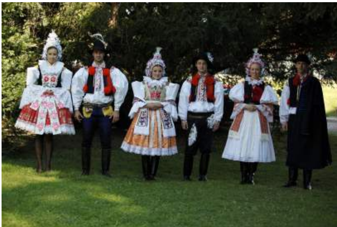
Obr. 168 Obřadní kompletní kroje z Ostrožska (zleva současná podoba, rekonstrukce podle návrhů R. Habartové – uprostřed cca podoba kolem roku 1920, vpravo kolem roku 1890) podle muzejních sbírek

Na úvodních plachtách se už v první polovině 20. století začaly uplatňovat motivy z církevních oltářních plachet-antependií a k poslední úpadkové vlně výšivkové výzdoby úvodnic můžeme zařadit motivy pestrých velkých naturalistických motivů ve formě velkých květů, provedených plochým stehem. Okraje úvodnice, které splývají k okraji přední sukně, bývaly hladce zaobroubené nebo zdobené malými trásněmi. V minulosti v ní bývala žena po své smrti také pohřbená.