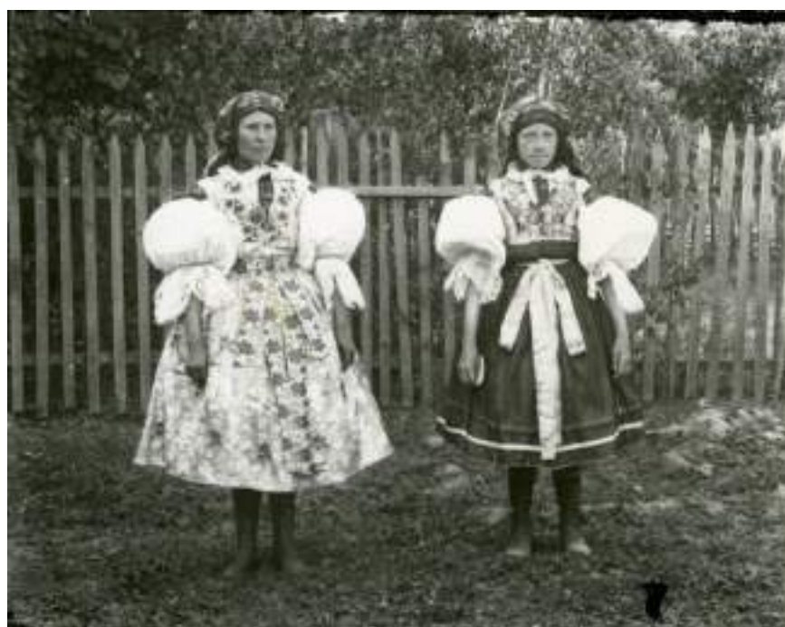
Obr. 40 Dívky ve slavnostním kroji. Boršice u Buchlovic, kolem roku 1900