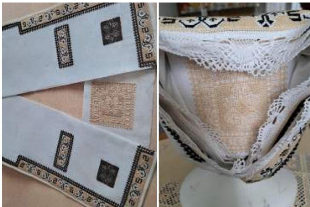
Obr. 162 Rekonstrukce - detail výšivky na jemný výřez – dýnka a konce šatky jako pokrývky ženské hlavy a čepce s šatkou konce hore. Ostrožsko, podle návrhu R. Habartové, kolem roku 1830. Práce L. Farkašové, 2025