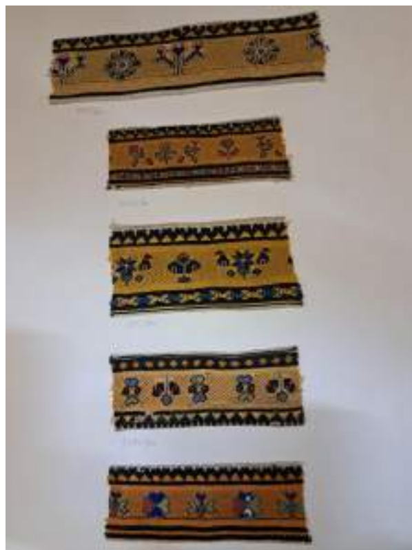
Obr. 87 Výšivky podle počítané niti, na jemný výřez, Babice