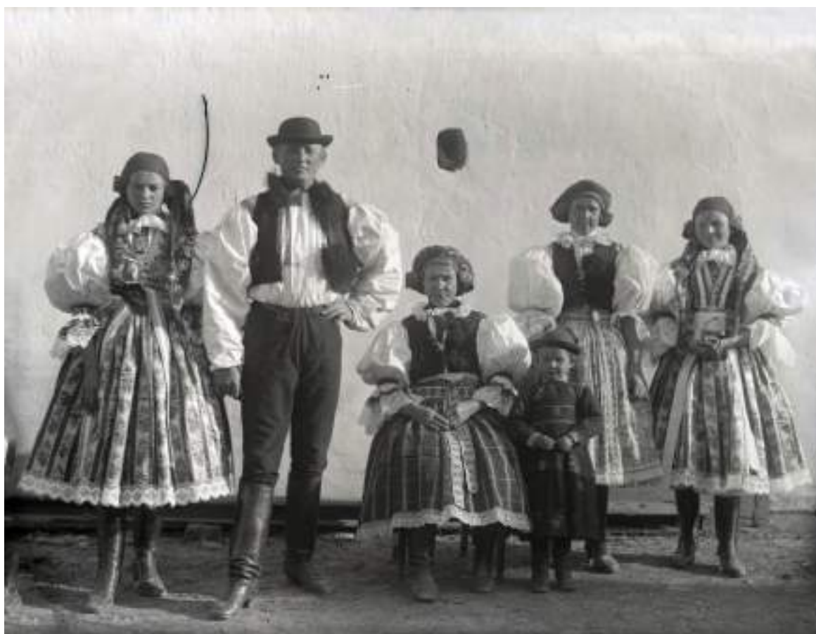
Obr. 26 Rodina ve slavnostních krojích, ženy mají na sobě hedvábné (dívky) i soukenné vestičky (starší ženy). Ostrožsko, kolem roku 1900

Ostrožsko je dodnes prezentováno právě pestrostí v kroji. V minulosti zaujal zdejší kroj malíře Jožu Uprku, Antoše Frolku a další profesionální umělce. Řada reprodukcí je obecně rozšířena, především jsou to výjevy od „Svatého Antonínka“ nad Blatnicí s kdysi světoznámými poutěmi. Ostrožsko pojímá obce, které řadíme do oblasti krojů dolňáckých, do uherskoostrožského krojového okrsku . Tento typ kroje se s lokálními odchylkami nosí na území vymezeném obcemi: Ostrožská Nová Ves s Chylicemi a Kvačicemi, v Hluku, v Uherském Ostrohu s Milokošticí, v Ostrožské Lhotě, na území Jihomoravského kraje v Blatnici pod svatým Antonínkem a v Blatničce. I zde si kroje ještě v první polovině 20. století zachovávaly svou znakovost, jako byla například funkce nebo postavení nositele, určení věkové, sociální i stavovské kategorie, lidový oděv byl rovněž znakem konkrétní příležitosti. Kroj této oblasti prodělal během 20. století značné proměny, což můžeme konfrontovat s ikonografickými doklady, dobovými snímky datovanými koncem 19. století, ale také se sbírkovým fondem muzeí, kde jsou krojové součásti a výšivky tohoto lokálně vymezeného subregionu hojně zastoupeny a dokumentovány od začátku 19. století po současnost. 6