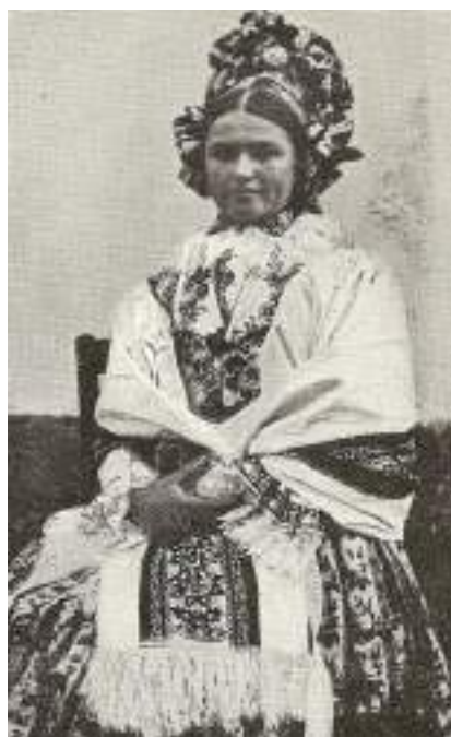
Obr. 169 Družička v pentlení a v úvodnici. Ostrožsko, 20. století

Na úvodních plachtách se už v první polovině 20. století začaly uplatňovat motivy z církevních oltářních plachet-antependií a k poslední úpadkové vlně výšivkové výzdoby úvodnic můžeme zařadit motivy pestrých velkých naturalistických motivů ve formě velkých květů, provedených plochým stehem. Okraje úvodnice, které splývají k okraji přední sukně, bývaly hladce zaobroubené nebo zdobené malými trásněmi. V minulosti v ní bývala žena po své smrti také pohřbená.