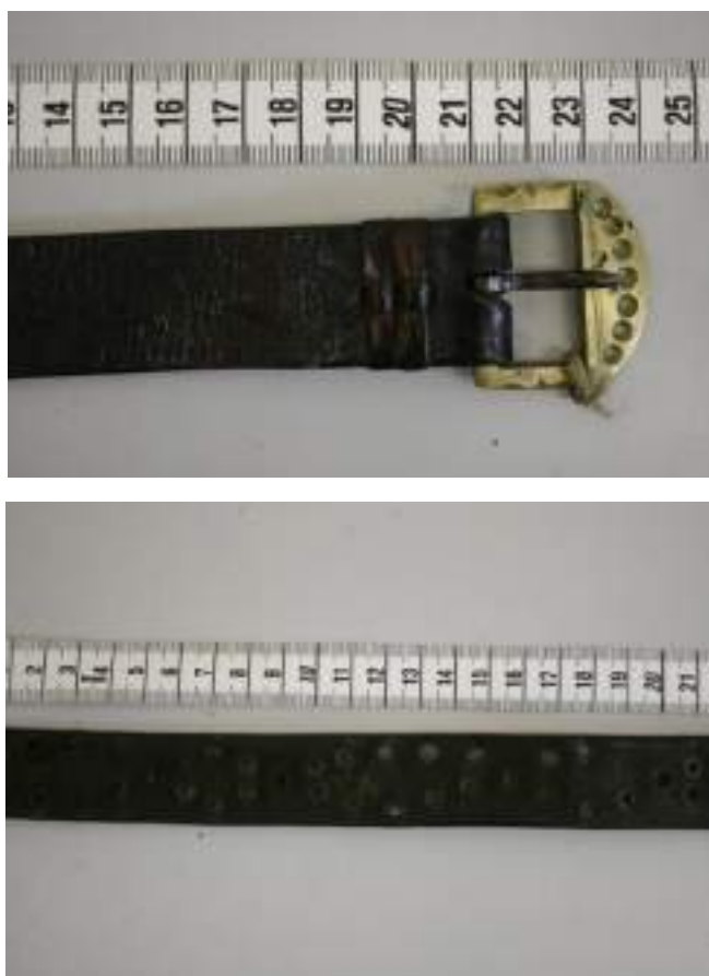
Obr. 186 Shora: Opasek ke kroji, zdobený vybíjenými kroužky vzorem do vlnovky. Ostrožsko, kolem roku 1930 a opasek jemně zdobený vyráženým vzorem do vlnovky. Ostrožsko, 1890. Fond Slovákckého muzea v Uh. Hradišti (foto: Romana Habartová)

Malí chlapci a staří muži nosili režné konopné, dnes lněné nebo bavlněné bílé plátěné kalhoty-tráslavice , zvané též drle , a bavlněné bílé kalhoty, kterým se v Hluku říká porcelánky . K nim se v minulosti vázala tmavě modrá, dnes černá klotová zdobená zástěra . K svátečnějším příležitostem je zástěra v dolní části zdobená plochou výšivkou s květy a u dolního okraje je mírně otrásněná nebo zdobená plochou výšivkou vytvářející u okraje malé obsmykované obloučky. V pase se na suk převazovala červeným tkaným trháčkem , červenou stuhou z harasu. Dnes ji nahradila červená stuha s vetkaným vzorem, která by měla splývat až k dolnímu okraji zástěry. Konce trháčků jsou bohatě zdobené flitry, krajkami a krepinkami. Doplnkem nohavic je kožený, malými kroužky bohatě vybíjený řemen , tzv. opasek , který je dlouhý tak, že jej muži dvakrát až třikrát obtáčíjí puntem a kolem pasu.