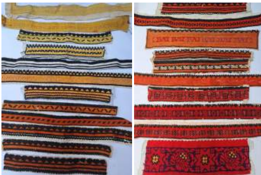
Obr. 120 Ukázky proměny výřezového vyšívání od začátku 19. století do současnosti

Dochovaná nejstarší vyšívání byla jednoduchá, úzká, jako vyšíváčský materiál sloužily rezné konopné nitě, nebílené, surové, později bílené. Dokladem jsou vyšívané formy na konopných fěrtoších a pásy z koutnic. Vyšívání bylo provedeno hrubými nitěmi na hrubém podkladě, tím vzory plasticky ze základu téže barvy vystupovaly. Původně byla v bílém či krémovém provedení jako zpevnění a spoj přímo na látce. Od poloviny 19. století se již jedná o vyšívané pásky, které se původně vyšívaly přímo na textili, proto se nejsvátečnější kusy nepraly, a až v druhé polovině 19. století se staly zdobnými pásky, které se našívají na uvedená místa košil a rukávců.