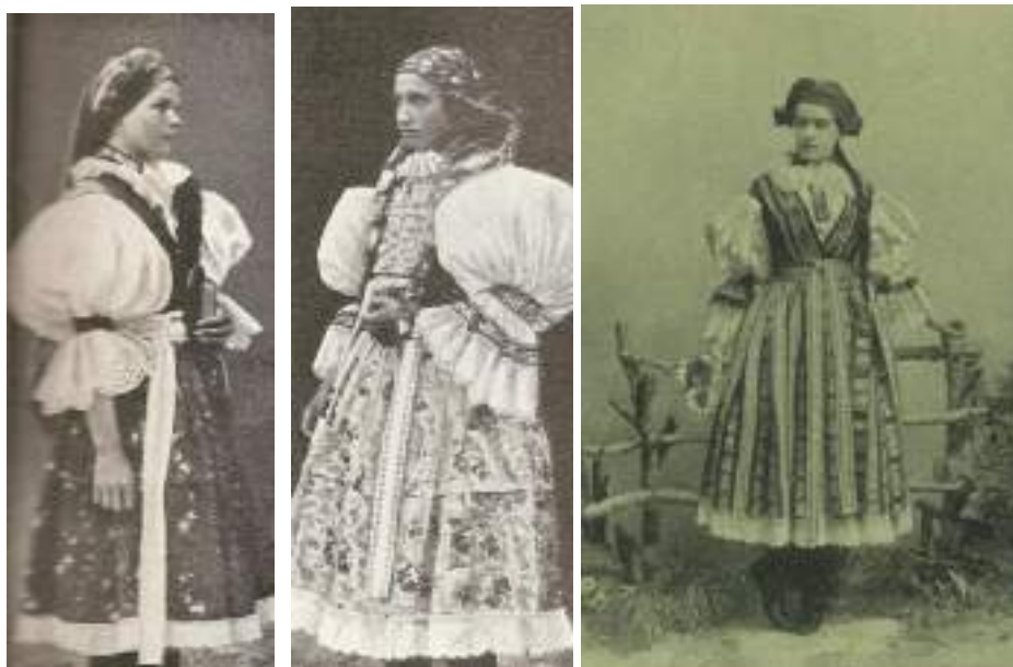
Obr. 138 Zleva: Dívka v soukenné kordulce, volných baňatých rukávcích a v polosvátečním úvazu šátku „na ocas“. Ostrožsko, 1892

K slavnostním tzv. parádním krojovým součástkám patří rukávce . Tvoří je tělo-stánek, podpažní klínek, vrchní a spodní nárameník, límeček v podobě úzkého stojáčku a vlastní vrapené rukávy s volány-kadrlými. Josef Klvaňa ve své době zmiňuje tzv. duté, volně zřasené široké rukávce s geometrickým výřezovým malým mozaikovým vyšíváním na žluté půdě. Rukávce byly šité z namodralého šifonového plátna, nebyly vrapené, baňky byly volně hustě zřasené. 64