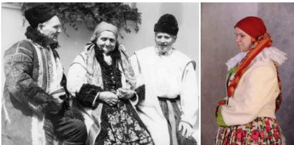
Obr. 167 Staří lidé v kožíšku a haleně, mladá žena v bílém lajblu. Ostrožsko, 20. století (soukromý archiv)