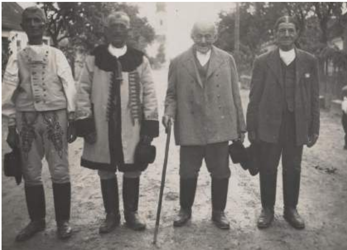
Obr. 17 Rôzne typy mužského odevu do chladných dní. Krakovany, 1. polovica 20. storočia

Zapínal sa vpredu na kovové háčiky z rubu lajblika . Na líci boli prišité okrasné gombíky. Zdobený bol štepovaním kontrastnou (žltou) nit'ou. Nohavice sa šili z rovnakého súkna ako pruceľ . V spodnej časti sa zužovali a schovávali do čižiem s tvrdou sárou. Na zadku (v mieste spoja) na stehnách a okolo rázporku sa zdobili rovnakou tmavomodrou našívanou šnúrkou ako pruceľ . V rázporku nohavíc sa nosil zastrčený červený ručník. Nohavice boli pripevnené na telo navlečeným tenkým koženým opaskom. Ženícha označovalo pierko , ktoré mal pripnuté na hrudi. Na klobúku mal taktiež ozdobné pierko .