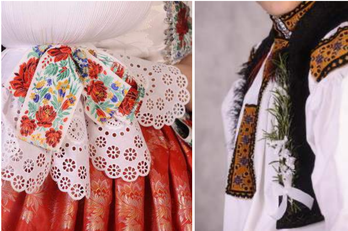
Obr. 63 Slavnostní kroj hodové mládeže. Spytihněv, 2009

Muži nosí variantu kroje velehradsko-spytihněvského, který byl již popsán výše a tvoří ho nohavice, kordula, dudová košile a beranice nebo klobouk. Soukenné kalhoty jsou ve vysokých botách s leštěnou holení, košile s velkými dudovými rukávy je zastrčena v kalhotách přepásaných řemenem. Na košili bývá našitá žlutá výšivka s rozvinutým motivem často se světle modrými výplněmi. Důstojnosti celému kroji dodává kapesníček vložený do průstřihu kalhot po obvodu vyšíváný červenou bavlnkou do květinových motivů a bohatě zdobená beranice s voničkou a větší navázanou květinovou stuhou a bílými kosárky. Starší a ženatí muži si berou na sebe místo tmavých nohavic plátěné drle a modrotiskovou zástěru, někteří zase místo kordule lajbl. Na hlavě mají vždy beranici nebo klobouk, který už není zdoben kosárky.