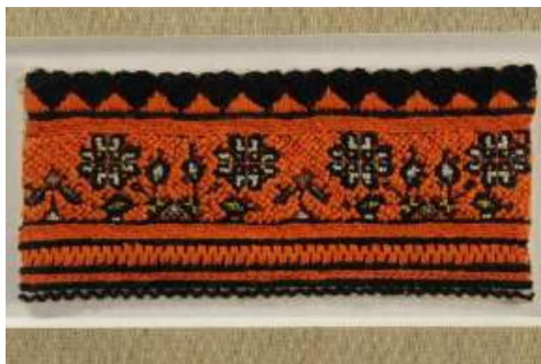
Obr. 204 Ukázka pracného výřezového vyšívání k ženskému kroji. Fond Slovákéjo muzea v Uh. Hradišti (foto: Romana Habartová)