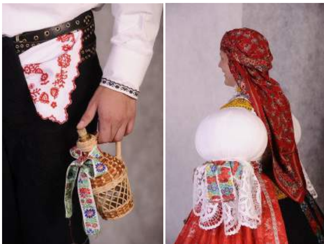
Obr. 70 Slavnostní kroj hodové mládeže. Současná podoba kroje. Bílovice, 2009

V Bílovicích s místní částí Včelary se mládež sdružuje hlavně v období přípravy hodů, kdy si nechávají u místních a přespolních specialistek nažehlit a připravit kroj.