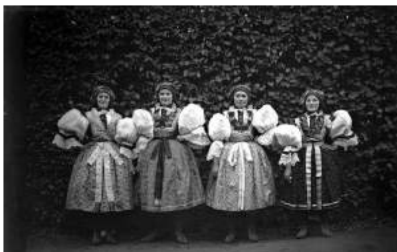
Obr. 21 Dívky ve slavnostním kroji. Polešovice, 1908 (soukromý archiv)