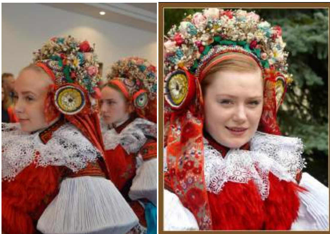
Obr. 219 Vlčnovské dívky v obřadním kroji ve věncích. Vlčnov, 2011

Důležitou obřadní součástí oděvu byla plachetka či úvodnice . Pruh plátna s vyšitým středem nosila nevěsta a družičky při svatebním obřadu. Po odchodu z kostela se odkládala. Původní stříhová konstrukce plachetky byla tvořena dvěma pruhy plátna uprostřed spojenými sít'ovaným pruhem paličkované krajky se vzorem zvaným Ještě před rokem 1900 nahradil paličkovanou krajku pruh mulu s výšivkou barevnými vlnami, kterou ve třicátých a čtyřicátých letech doplněnou pošitím stříbrných a zlatých perliček-ovsů z foukaného skla a patáčků. Plátno se zcela zakládá dovnitř, takže zůstal patrný pouze široký pruh výšivky lemovaný pásy výřezového červeno-černého vyšívání. Původně měla výřezová výšivka stejný vzor jako výšivka na rukávcích. Zvláštností je uplatnění vzoru na hamovník, který se jinde v oděvu nevyskytuje a pravděpodobně měl ochrannou magickou funkci, která měla nositele chránit před zlými silami. Ve Vlčnově chodila do úvodnice zahalená při svatbě nejen nevěsta, ale také mladší a starší družička. 82