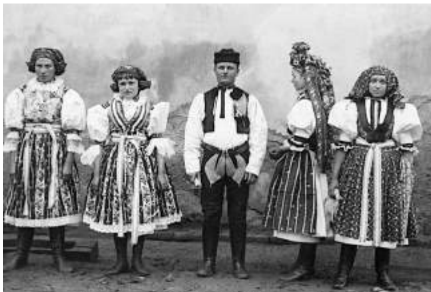
Obr. 30 Podoba mužského a ženského kroje z Kunovic, mládenec v astrigance bez příkras, dívka s obřadním věncem, děvče v úvazu na záušnice, vlevo dvě dívky ve slavnostním kroji z Ostrožské Nové Vsi, 1890

Na konci 19. století prodělával kroj mezi vládnoucí a vyšší sociální vrstvou mírné změny. Kroj lidových vrstev se vyvíjel mnohem pomaleji. Vesničané přijímali velmi rozvážně jen takové novinky, které jim vyhovovaly prakticky, líbily se jim, nebo je přijímali z pohnutek vlasteneckých. Móda se nešířila stejně rychle, obtížně pronikala do horských krajů a oblastí odloučených od měst a komunikací. Rolnický lid si svůj lidový oděv uchovával jako výraz stavovské hrdosti, dělníci a řemeslnické stavy začali lidový oděv odkládat dříve. Díky horskému prostředí a odloučeným karpatským údolím, díky panským poměrům trvajícím až do převratu v Uhrách si lid udržoval v odívání svůj charakter. Na proměnách se podepsaly hospodářské poměry, nerozvinutý průmysl i možnost lepšího zaměstnání a nedostatek peněz, který neumožňoval nakupovat novinky. Popřevratové osvobození lidu, sociální povznesení, vzdělání, školství, pokrok a další faktory způsobovaly postupné stírání rozdílů v odívání vesnických vrstev a odkládání kroje. 12