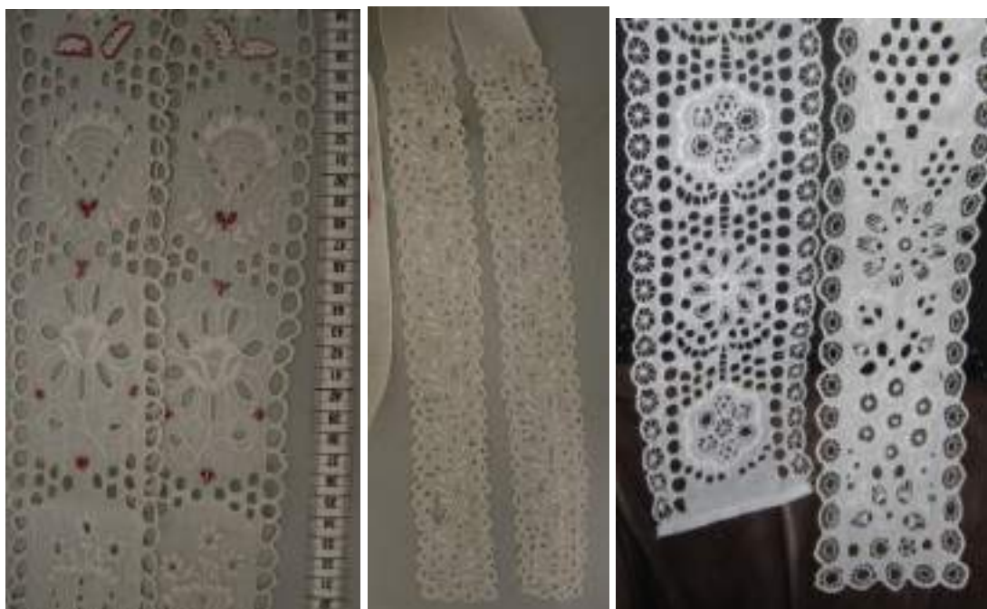
Obr. 150 Stuchy na zadní bílou sukni-fěrtoch. Ostrožsko. Kolem roku 1900-1930 (fond Slovákého muzea v Uh. Hradišti)

Viditelným zdobným prvkem zadních sukni, šorců a fěrtochů, tzv. tráčky či štruple , představující dva pruhy navázané stuhy splyvající na zadní sukni. Pro obřadní chvíle byly na zadní bílý fěrtoch vázány velmi jemné plátěné štruple zdobené bílou dírkovou výšivkou, které působily dojem velmi vzdušné krajky.