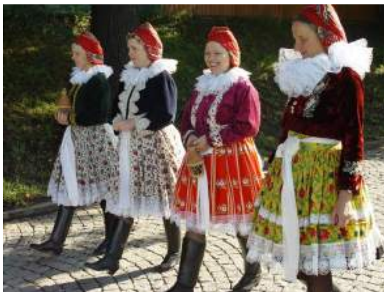
Obr. 144 Současná podoba ženského svátečního (vycházkového) kroje, ženy v jupkách s velkými krajkovými límci. Ostrožsko, 2013

Finální podobu slavnostních rukávců dotváří kompletní ženské vyšívání tvořené dvěma nárameníky, dříve dvěma přednicemi, které dnes nahradila jedna širší náprsenka-přednice, dva náramky u loktů, límcem-obojkem. Výšivky byly původně prováděné pracnou geometrickou technikou na jemný výřez v barvách od krémové, okrové, cihlové, a vytvářelo efektně působící drobný, uzlíčkový celek. Tato jemná výřezová technika se ve 20. století proměnila v mozaikové vyšívání, kde motivy tvoří shluky motivků v pestrých barvách. Dnes v širší a hrubší výšivce převažuje barva oranžová a v ní pestrobarevné mozaikové motivy, tzv. znamena. Obojek, není přišit k rukávcům, je to samostatný kus a kolem dokola je zdoben hustě skládanou širokou obvykle tylovou krajkou, která zvýrazňuje honosnost a bohatost kroje.