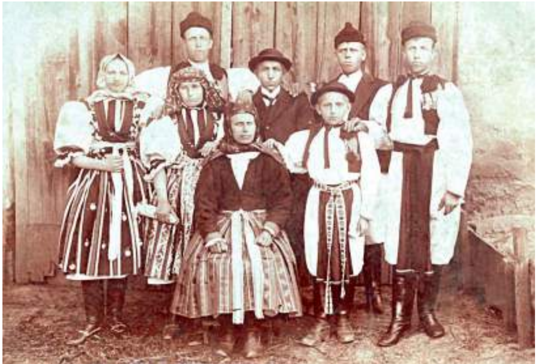
Obr. 23 Rodina ve slavnostním kroji, matka v úvazu na rožky, dcery na záušnice a pod bradu, mladíci ve slavnostní košili, korduli a drlách, ale i v selském oděvu. Kunovice, kolem roku 1900