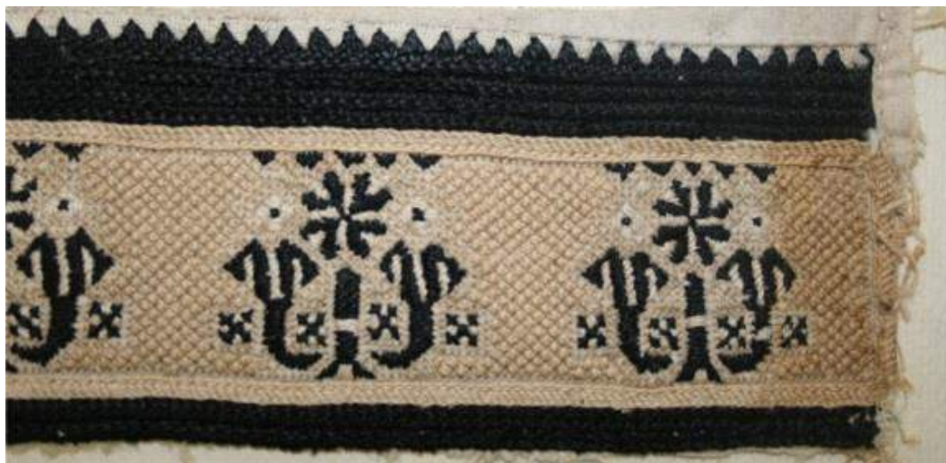
Obr. 163 Nárameník, vzor „na složitý kalich“, kalich je tvořen dvěma tulipány a květem. Kontrastní dvoubarevná výšivka na jemný výřez doplněná v detailech neutrální bílou (krémovou) barvou. Velikost výšivky je 190 x 50mm. Blatnička, kolem roku 1870 (fond Slovákého muzea v Uh. Hradišti)