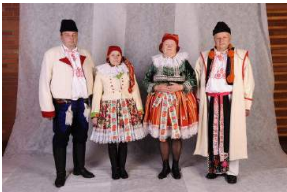
Obr. 183 Současná podoba kroje Ostrožska. Slavnostní kroje pro chladnější počasí, muži v lajblu a haleně, v košilích-červenících, ženy a lajblu a plyšovém kabátku-jupce. Hluk, 2009

Dalším druhem mužské košile je červenice , nošená k méně slavnostním chvílím i na všední den. Má stejný střih jako dudovice , ale s menším řasením v rukávech.