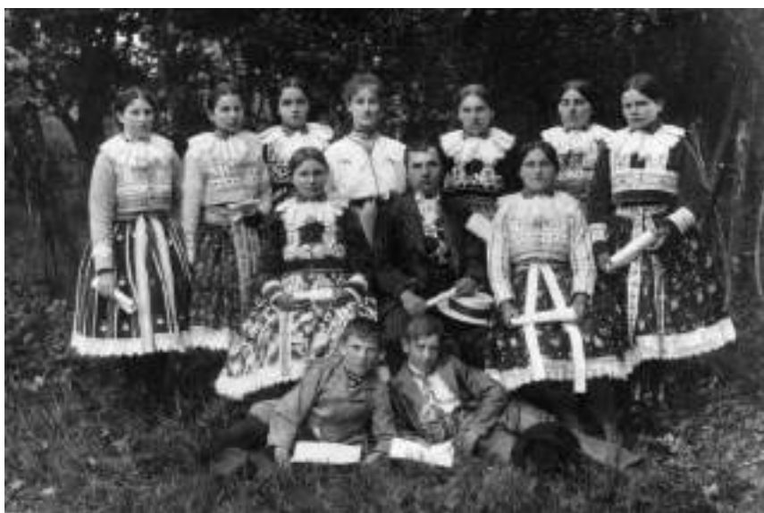
Obr. 166 Dívky v jupkách různého druhu s obršlákem-obojkem z krajek. Ostrožsko , kolem roku 1920

V chladnějším období nosily ženy ke kroji soukenné nebo flanelové světlé svrchní krátké kabátky-lajbly s barevnými vlněnými výložkami na klopách a manžetách, vyložené obvykle z fialovým, červeným nebo zeleným květovaným kašmírem nebo atlasem, vpředu má kabátek dvě řady plochých knoflíčků. Lajbly oblékaly i vdané ženy k slavnostním i obřadním příležitostem. Byly postupně nahrazeny tzv. marýnkami , nepřiléhavými sametovými jupkami s rovným živůtkem a rovnými rukávy. Pro zimní období si ženy na Ostrožsku pořizovaly plyšové nebo sametové jupky a beránkové kacabajky , nejčastěji v barvě fialové, temně červené, tmavě zelené nebo modré, ale i černé, na přednicích, kolem obvodu a na rukávech zdobené řadami port, prýmků, stužek a krajek. U okraje nad pasem jsou jupky zdobené po centimetrech skládaným pruhem sametu vysokým celkem čtyři až pět centimetrů.